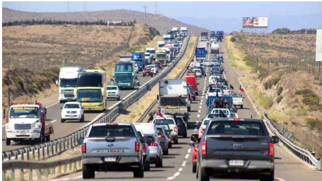
La caravana de 200 vehículos recorrió la ruta 5, expresando su desesperación por la sequía.

Otra de las agrupaciones que se sumó a la protesta fue el Colegio de Ingenieros Agrónomos de la Región de Coquimbo.