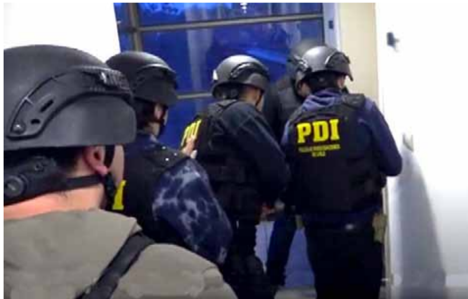
La Policía de Investigaciones realizó diversos operativos para detener a los autores del secuestro en Los Vilos, quienes tendrían participación en varios otros hechos similares.

Según investigaciones el peligroso criminal de nacionalidad venezolana fue el encargado de coordinar las acciones e instruir a los secuestradores en la perpetración del ilícito. En este mismo caso, ayer quedó en prisión preventiva un nuevo imputado por este hecho.