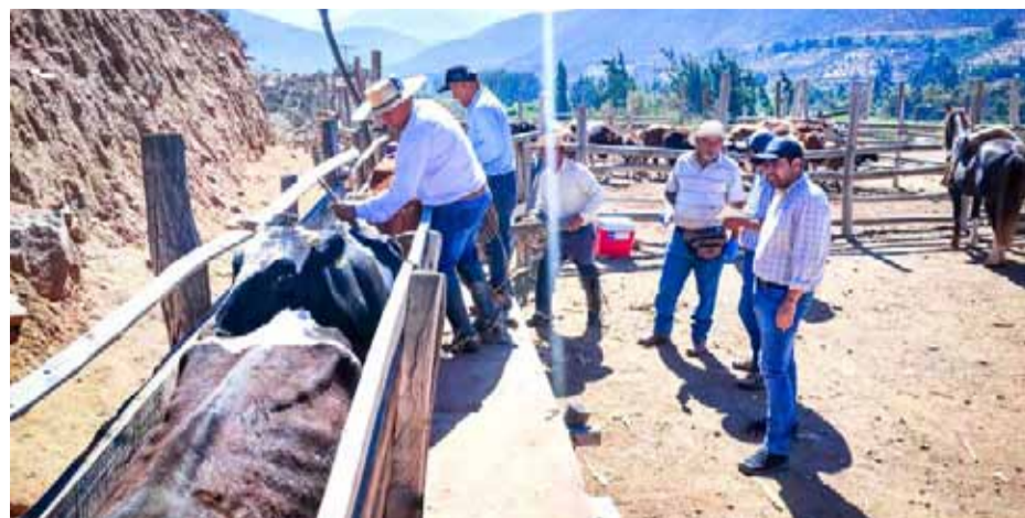
En los próximos días, los operativos gratuitos de desparasitación van a continuar.

Huintil y participar del cuarto operativo sanitario, explicó que “los ganaderos han sufrido los embates de la sequía, no sólo por la escasez de forraje, sino también debido a la limitación de recursos. Por lo tanto, la desparasitación pasa a tener un alto costo para ellos y desde esa perspectiva lo que nosotros estamos haciendo son operativos gratuitos en