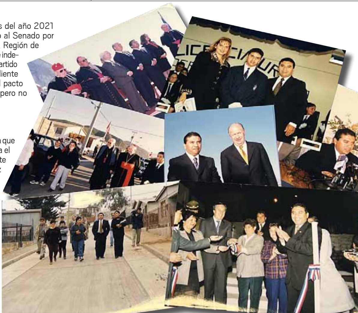
En estas imágenes se pueden apreciar las distintas actividades que encabezó en su calidad de autoridad comunal durante más de una década.

“No. Todas las cosas que hice las hice siempre pensando que yo era un instrumento de Dios y todo lo hacía en su nombre. Por lo tanto, no hay ningún tipo de deuda y tampoco deseo que le vayan a colocar mi nombre a una plaza, calle ni nada, porque yo fui elegido. Me pagaron un sueldo, tuve la oportunidad de estudiar, de viajar. ¡Qué más le puedo pedir y agradecer a la gente de Coquimbo! Entonces, no hay deuda”.