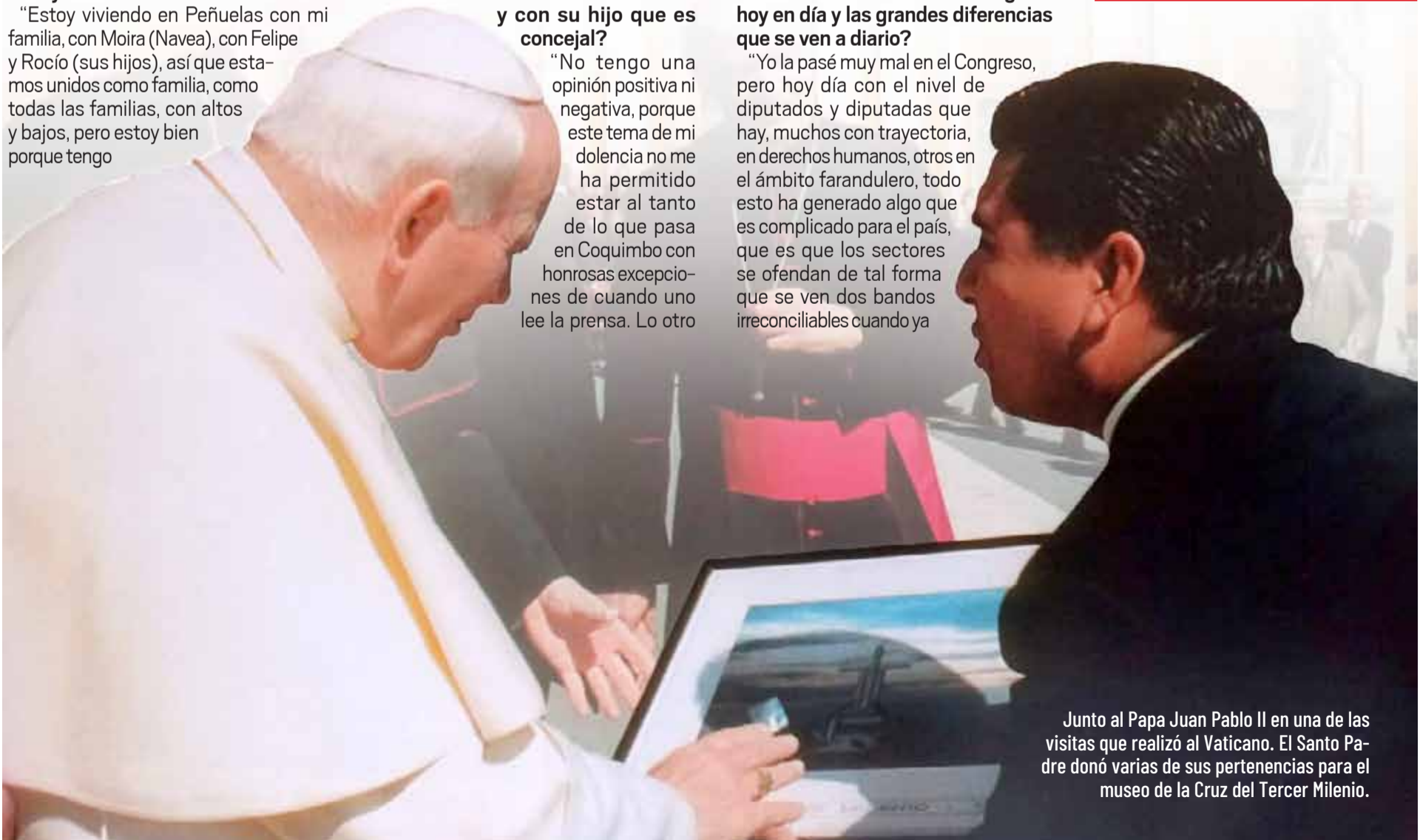
Junto al Papa Juan Pablo II en una de las visitas que realizó al Vaticano. El Santo Padre donó varias de sus pertenencias para el museo de la Cruz del Tercer Milenio.