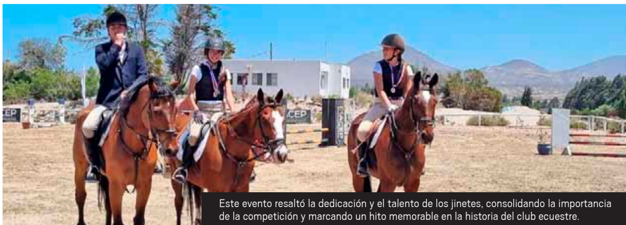
Este evento resaltó la dedicación y el talento de los jinetes, consolidando la importancia de la competición y marcando un hito memorable en la historia del club ecuestre.