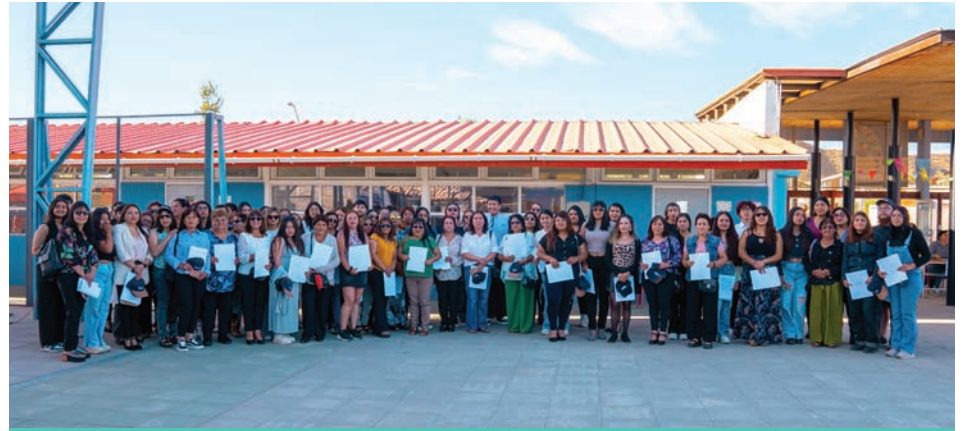
Beca Futuro Andacollo.