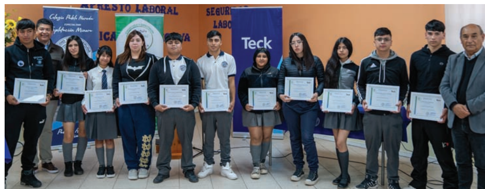
Alumnos del Colegio Pablo Neruda certificados por Sence.

El objetivo de estos programas fue brindar a los estudiantes acceso a recursos educacionales y oportunidades de capacitación que les permitan adquirir habilidades y técnicas de empleabilidad.