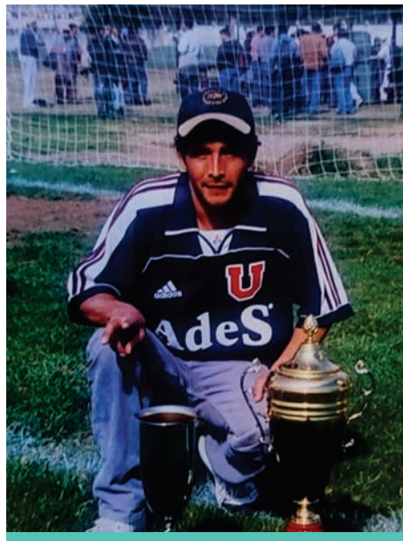
Junto a trofeos que obtuvo en sus momentos de gloria.