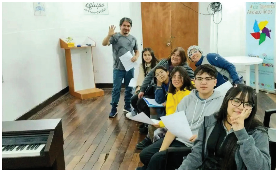
Los alumnos del taller de piano avanzado.