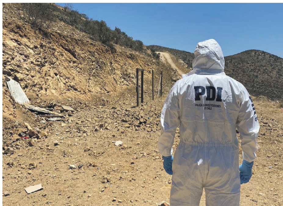
Funcionarios de la PDI investigan las causas de la explosión que causó la muerte de un hombre en la Mina Santa Rosa, del sector Quebrada de Talca.