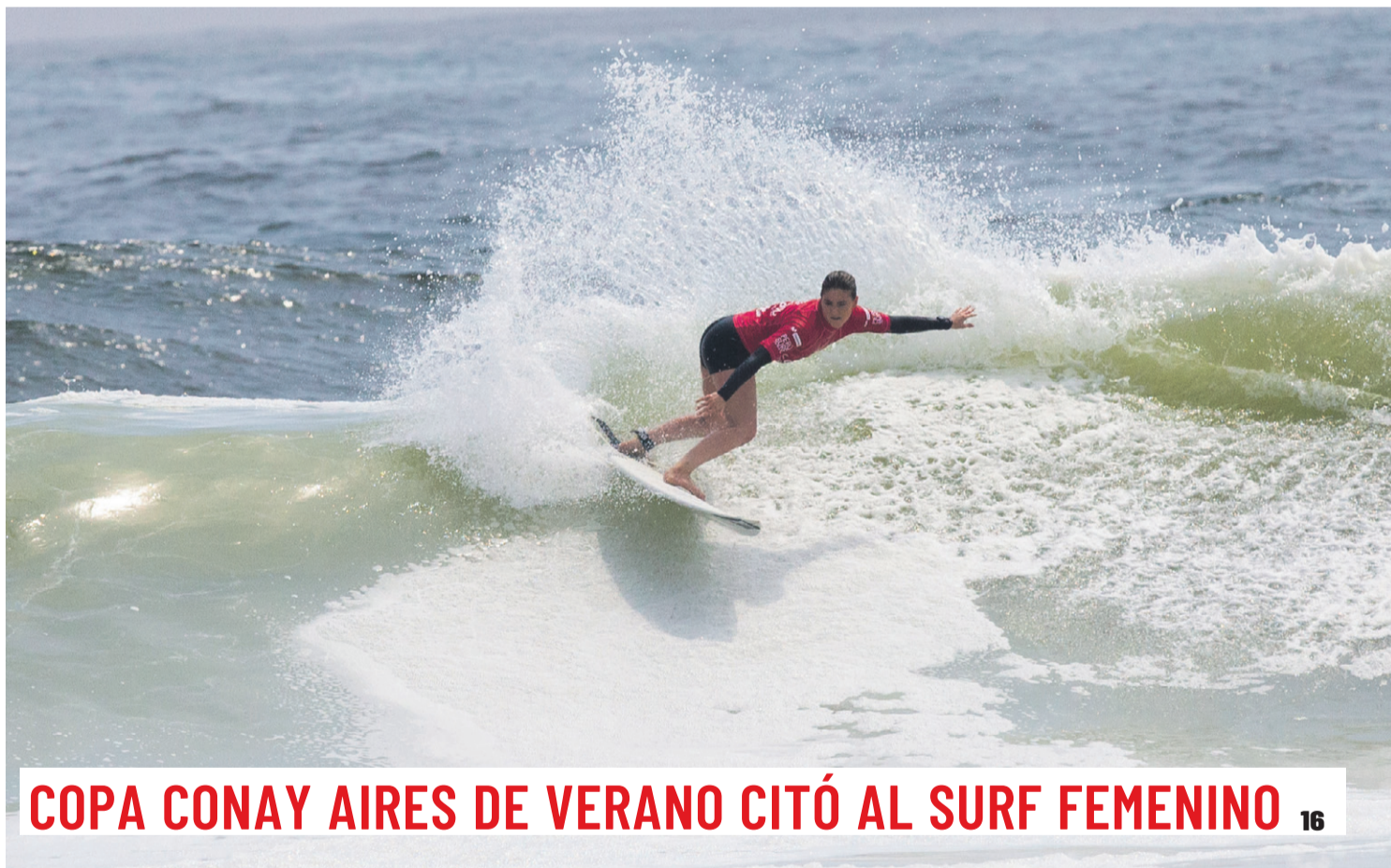
COPA CONAY AIRES DE VERANO CITÓ AL SURF FEMENINO 16