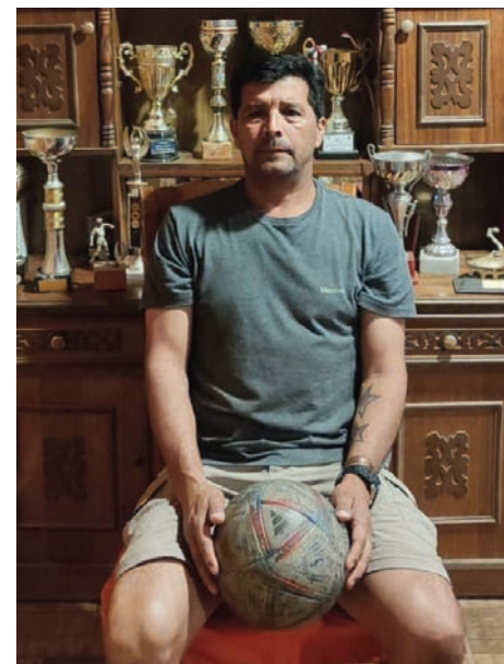
El reposo del goleador.