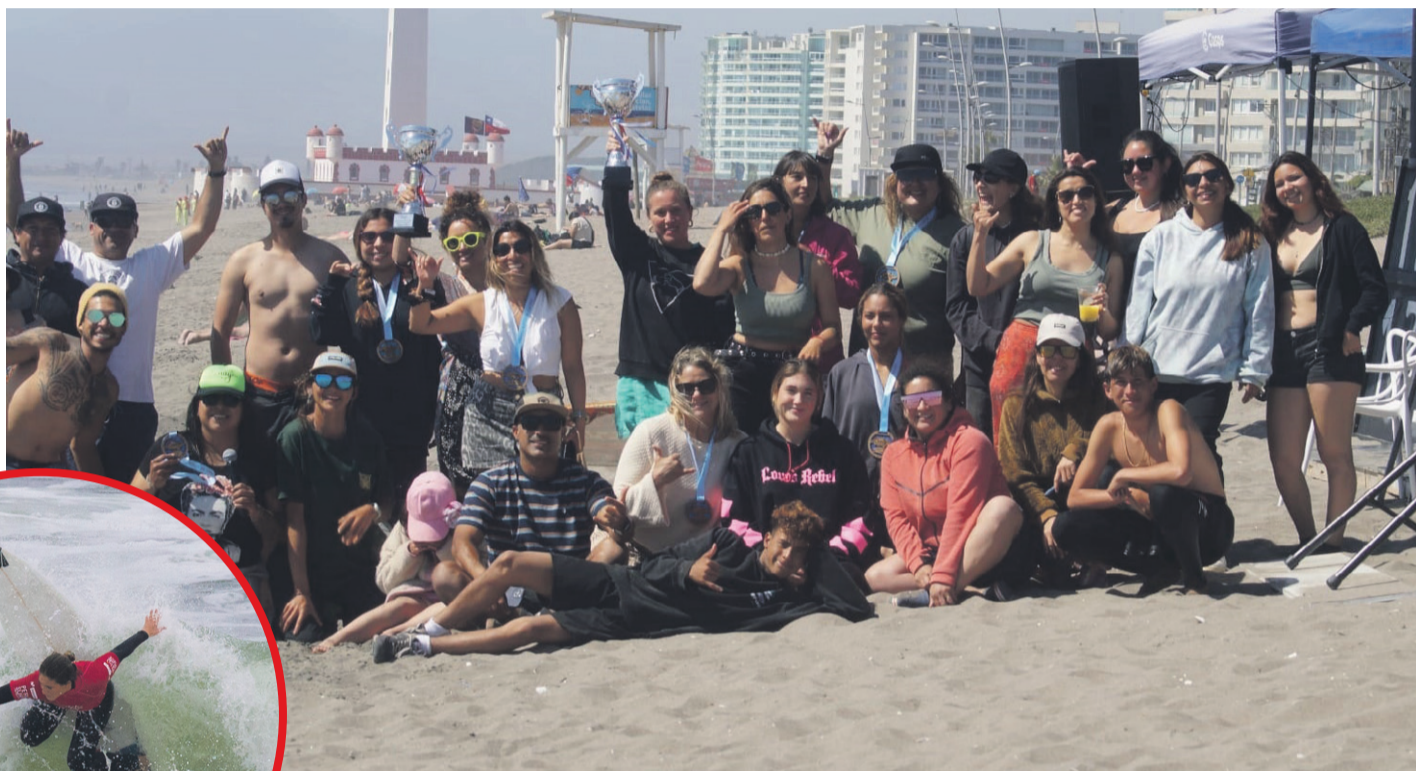
Una alta convocatoria encontró la primera Copa Conay Aires de Verano.

Agregó que "fue organizado por mujeres y para mujeres con la finalidad de potenciar el deporte femenino. No tuvo límites de edad, hubo mucha alegría, con mucha participación e distintas edades, realmente resultó