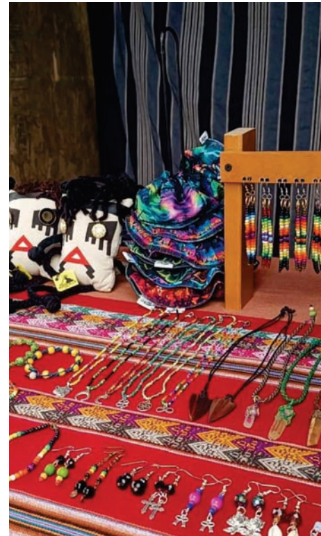
Lindos trabajos de artesanos de la comuna se lucen en la feria que está a un paso de la Plaza Videla.