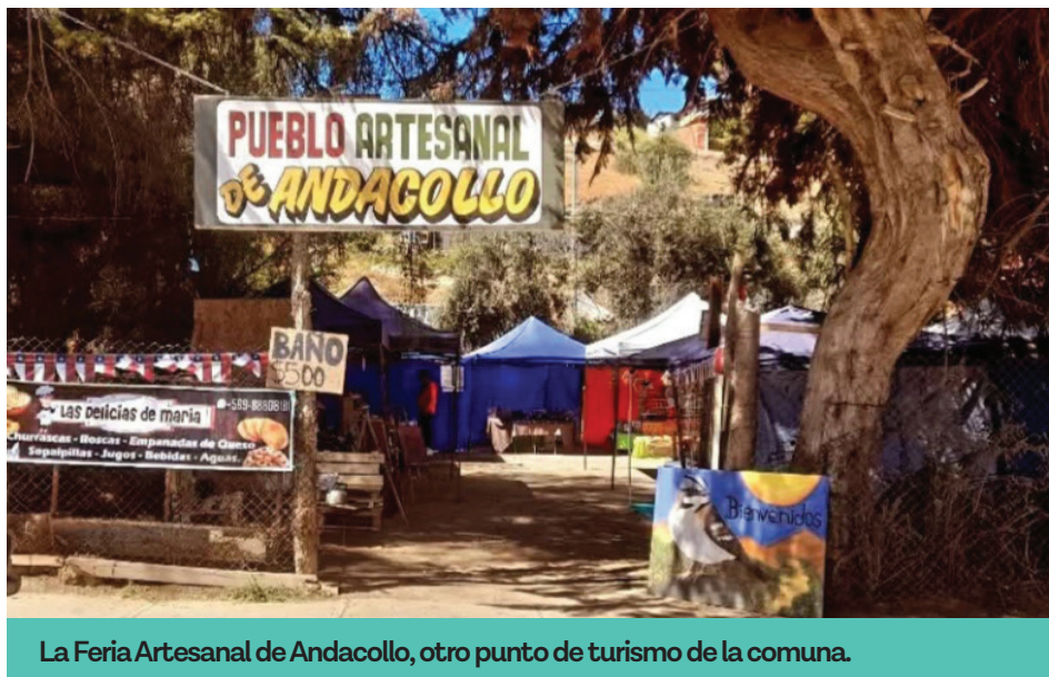
La Feria Artesanal de Andacollo, otro punto de turismo de la comuna.

crecer y trabajar con empresas, “porque solo le vendíamos a los vecinos, pero queremos ir más allá y ofrecer los productos a las empresas, crearles jardines o arreglárselos”.