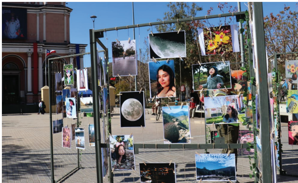
En las exposiciones, los alumnos demuestran su talento.