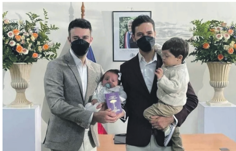
En la zona, son 29 personas que han sido registradas como hijos de parejas del mismo sexo.

como hijos/as de parejas del mismo sexo. 710 como hijos de dos madres, el 86,2% del total, y 114 como hijos de dos padres, equivalente al 13,8%