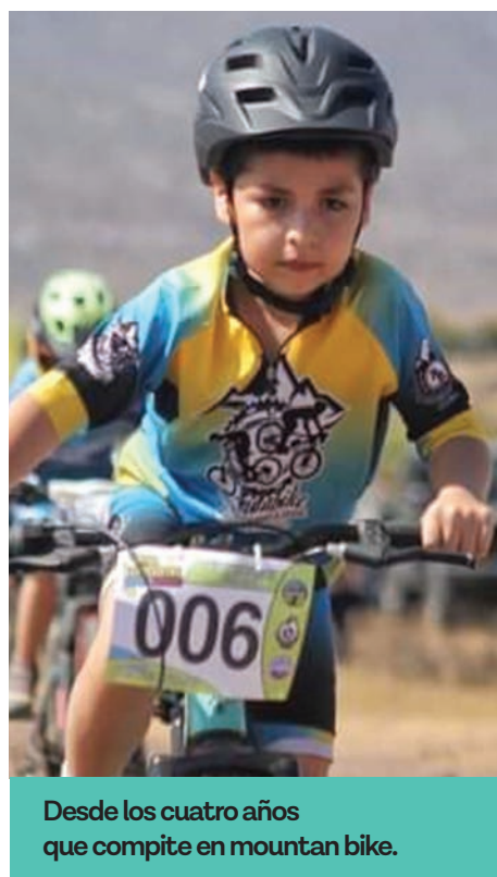
Desde los cuatro años que compite en mountain bike.

cuela de Talentos a preguntar si lo podían recibir. Le indicaron que había vacantes, pero a partir