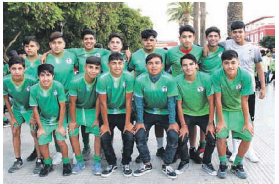
Categoría 2004, ACADEMIA DE FÚTBOL KICO ROJAS- Ovalle.