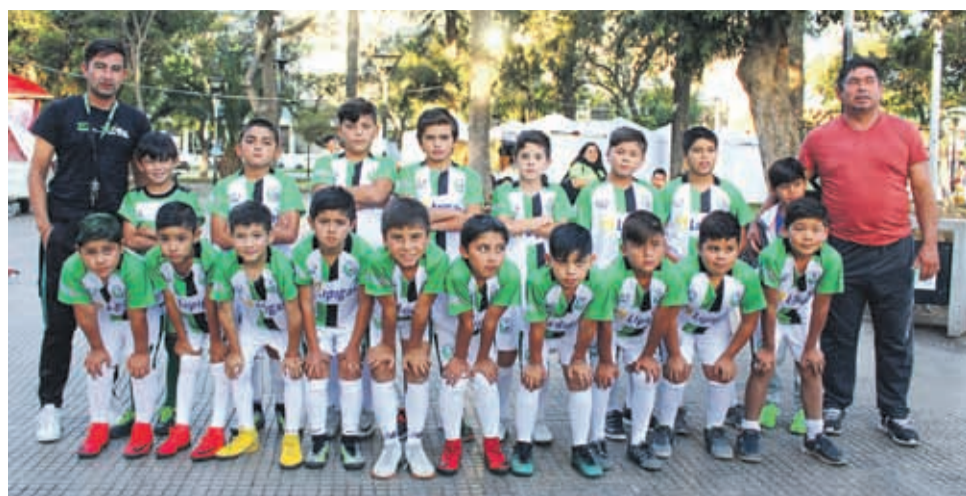
Escuela de Fútbol EL VALLE, Ovalle.