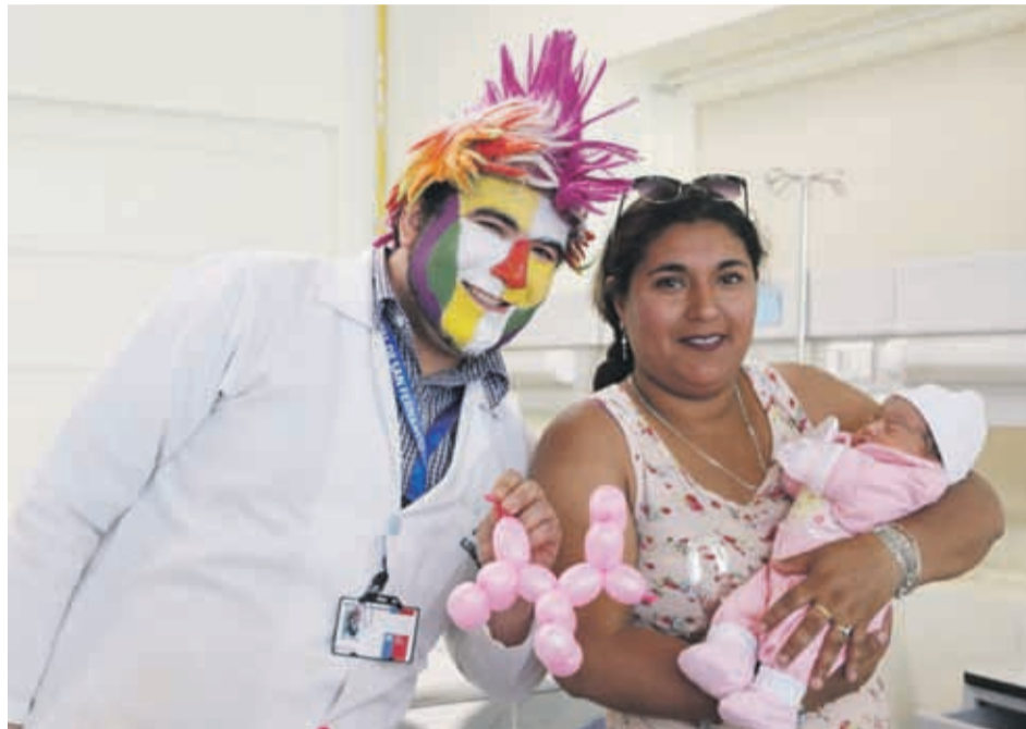
"Doctor Tocris" visitó la maternidad del hospital de La Serena