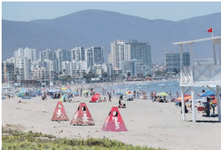
Las playas y calles se han visto más descongestionadas este verano.

LAURA CERDA presidenta de la Cámara de Turismo de Coquimbo.