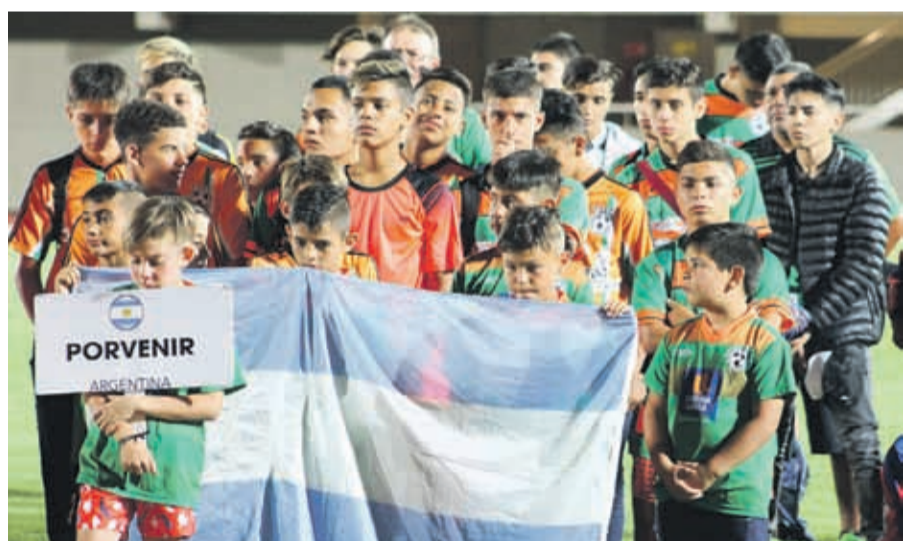
Club Deportivo PORVENIR de Córdoba, República Argentina.