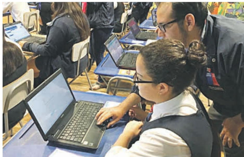
Los estudiantes deben hacer el trámite a través del sitio web www.renuevatubeca.cl

“Estamos preocupados por la gran cantidad de estudiantes que al día de hoy no han renovado sus beneficios y dejarían de contar con ellos para el 2019. Nuestro compromiso como Gobierno desde Junaeb es que todos los estudiantes completen sus estudios sin