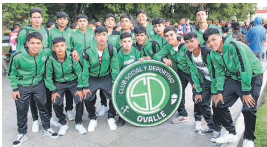
NOVATOS, Club Deportivo y Social Ovalle, Categoría 2003.