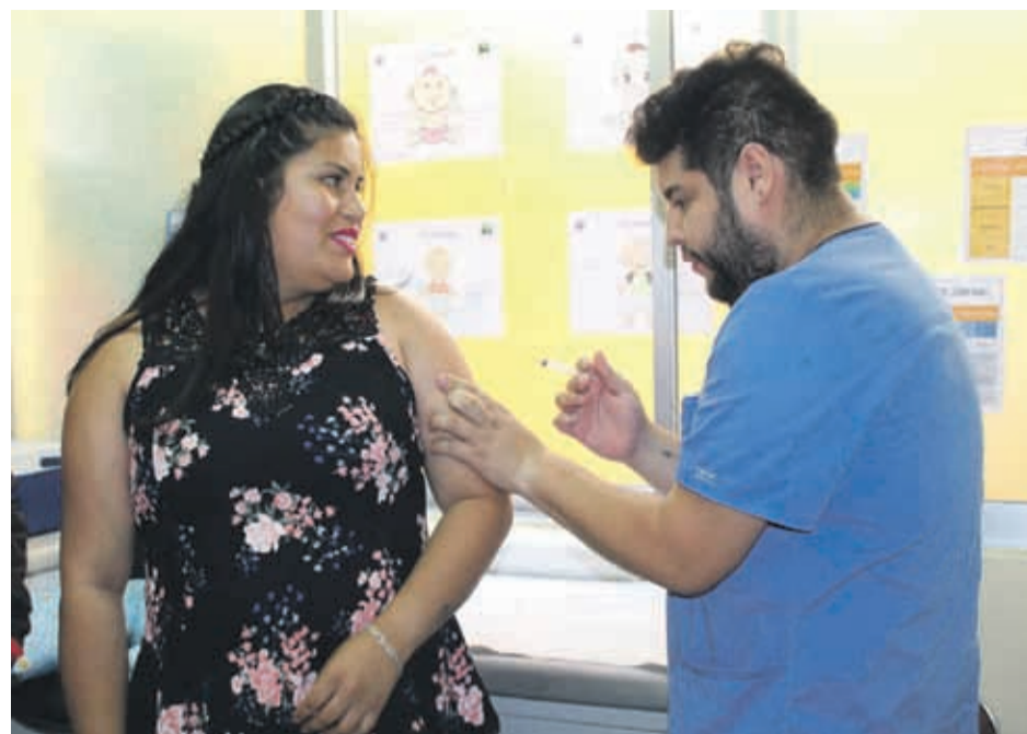
Los jóvenes entre 20 y 24 años se pueden vacunar durante los meses de enero y febrero

que “La vacuna está disponible en todos los CESFAM en la Atención Primaria, por lo tanto hacemos un llamado a los jóvenes a vacunarse en el centro de salud más cercano a su domicilio”.