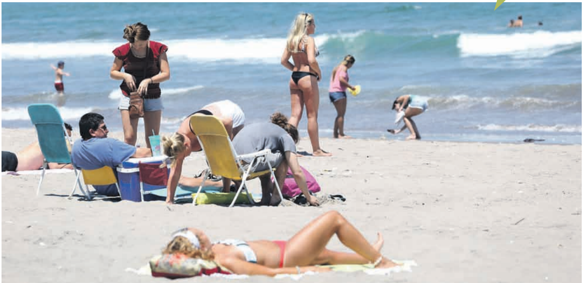
Una menor llegada de argentinos está impactando en la industria turística de la región.

Es una situación que se tenía prevista, pero aun así las proyecciones de los gremios apuntan a conseguir las cifras de la temporada pasada y mantenerlas. En tanto, hasta la primera semana de enero, el paso de argentinos por Agua Negra ha caído en torno a 40% respecto del año pasado.