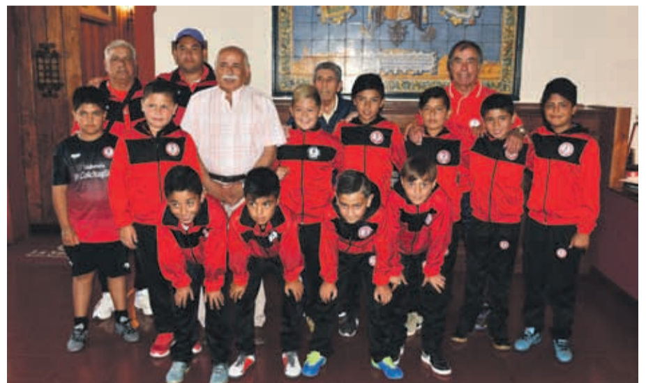
MUNICIPALIDAD DE LA SERENA

Los jóvenes y profesores de la Academia Santa Inés recibieron el apoyo del edil serense.