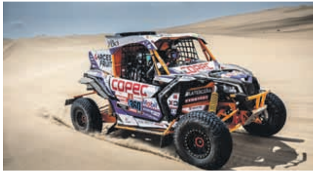
PRENSA CHALECO LÓPEZ