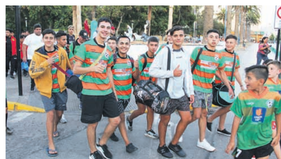
Integrantes del Club PORVENIR, por las calles de Ovalle en el desfile inaugural del torneo.