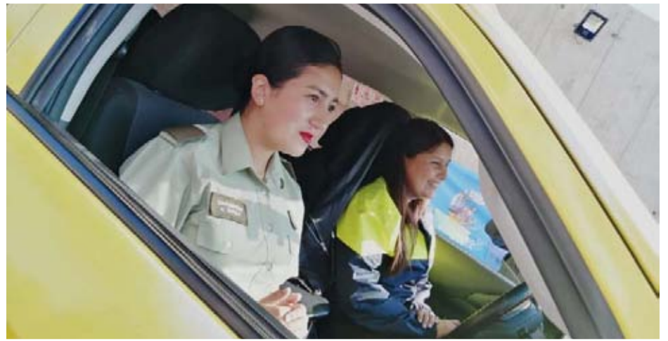
La primera patrulla mixta femenina fue presentada este miércoles, durante el Día Internacional de la Mujer.

motoristas e inspectoras de seguridad, y hemos fortalecido estas unidades porque las mujeres tienen mejor llegada con la gente, tienen una sensibilidad distinta en el ámbito de intervención en el territorio, y eso ha tenido una efectividad muy grande. Estamos innovando con las patrullas mixtas femeninas y formalizando un trabajo que venimos realizando hace mucho tiempo, con el desafío de acompañar a la ciudadanía