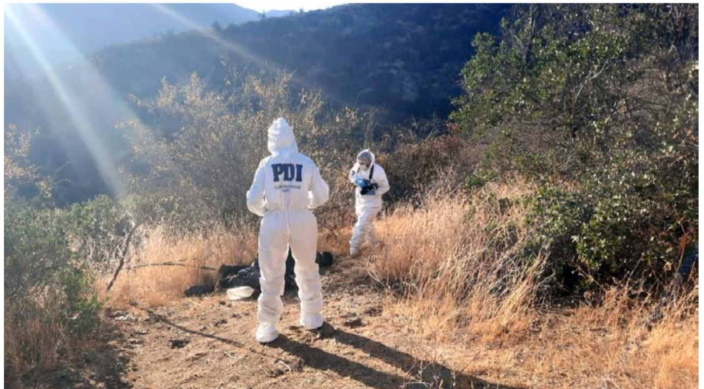
Personal especializado trabaja en establecer la identidad de la persona fallecida y las circunstancias de su muerte.

Cabe mencionar además, que el cuerpo fue encontrado muy cerca de una gran plantación de cannabis