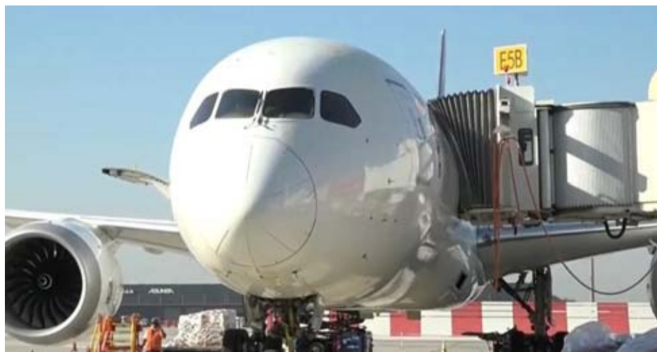
La balacera en la losa del aeropuerto ocurrió en medio de los aviones apostados en el lugar.

La investigación de lo ocurrido quedó a cargo de la Brigada de Robos Occidente de la PDI, por orden de la