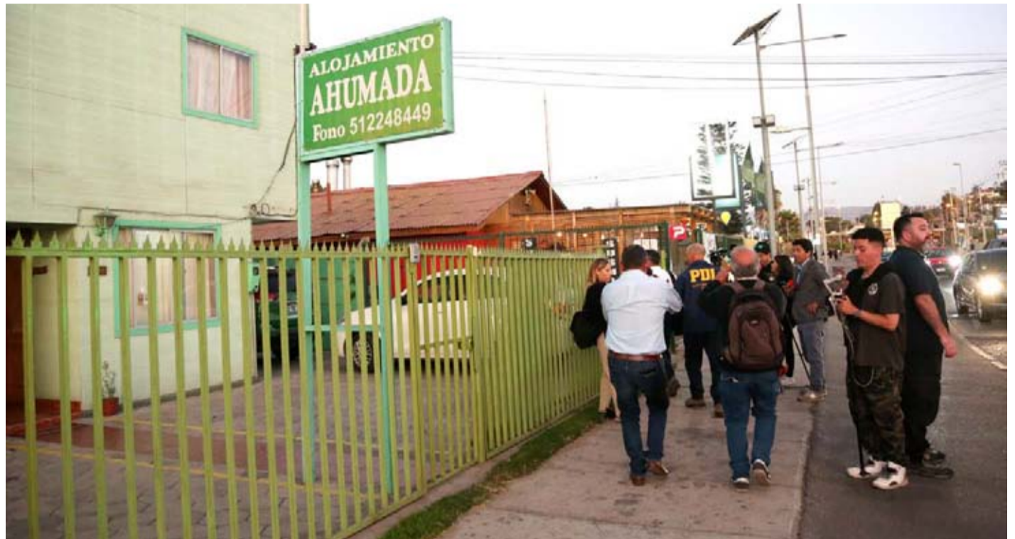
Registro de la noche del martes en el Alojamiento Ahumada, en Coquimbo, una vez que el crimen quedó al descubierto.

Este miércoles, el ambiente en las inmediaciones del Apart Hotel era