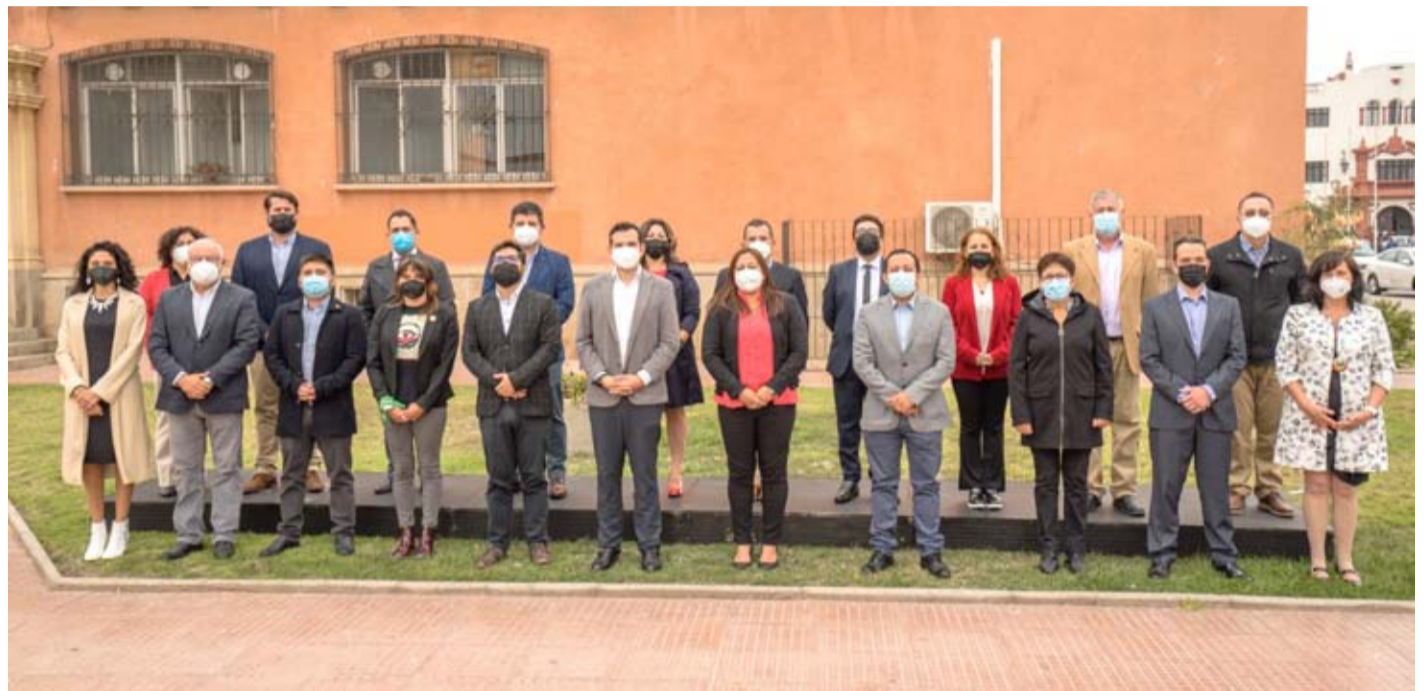
Pronto a cumplirse un año de gobierno, los cambios parecen inminentes.