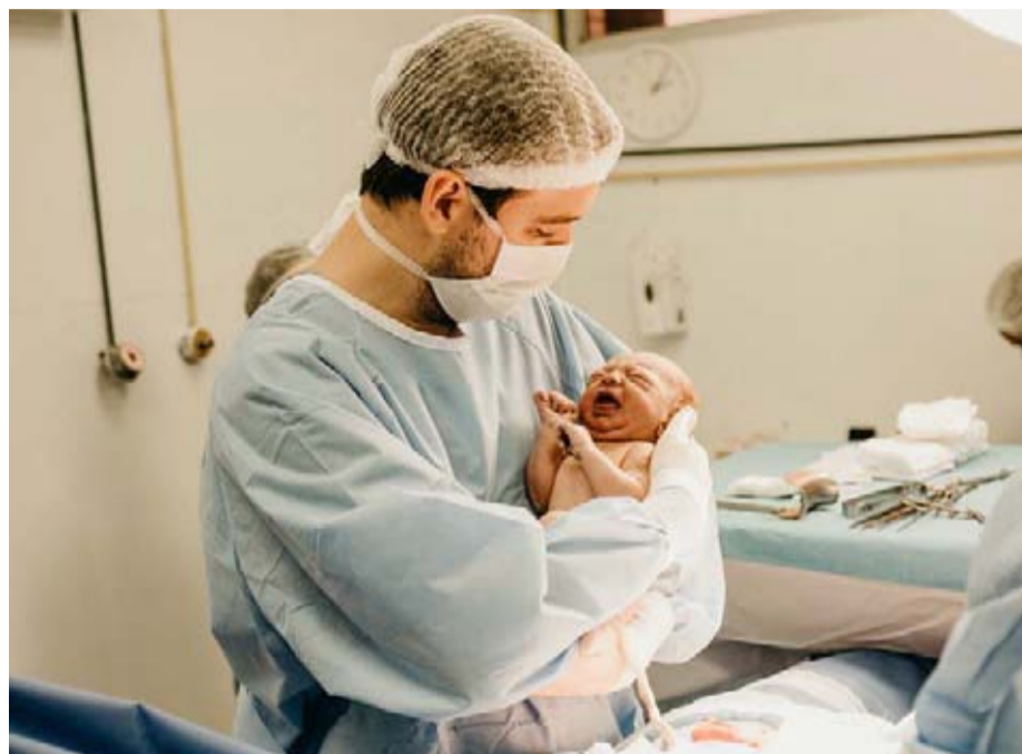
El nacimiento de un bebé nos inunda de amor...y de oxitocina.

Según esta médica, “no produce el mismo efecto un fármaco recomendado por un médico que previamente ha escuchado con empatía al paciente, que el prescrito por un facultativo que apenas ha desviado la vista de la pantalla del ordenador y se ha limitado