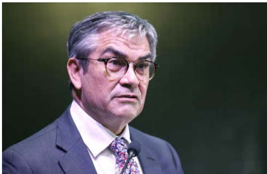
El ministro Mario Marcel lamentó el rechazo que los diputados le dieron a la propuesta de reforma tributaria.

En eso último también coincidió Rubén Darío Oyarzo (PDG), que opinó