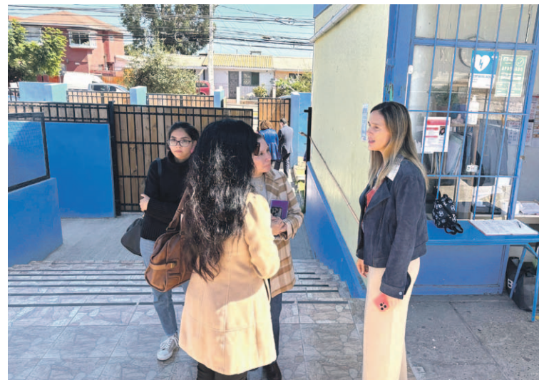
La alcaldesa de La Serena, Daniela Norambuena, se preocupó personalmente de que el conflicto no siguiera escalando.

Entre las medidas acordadas, destaca el arreglo del ascensor, que según los apoderados, lleva años en mal estado. Además, se levantará la reja que bloquea la rampa, se realizarán