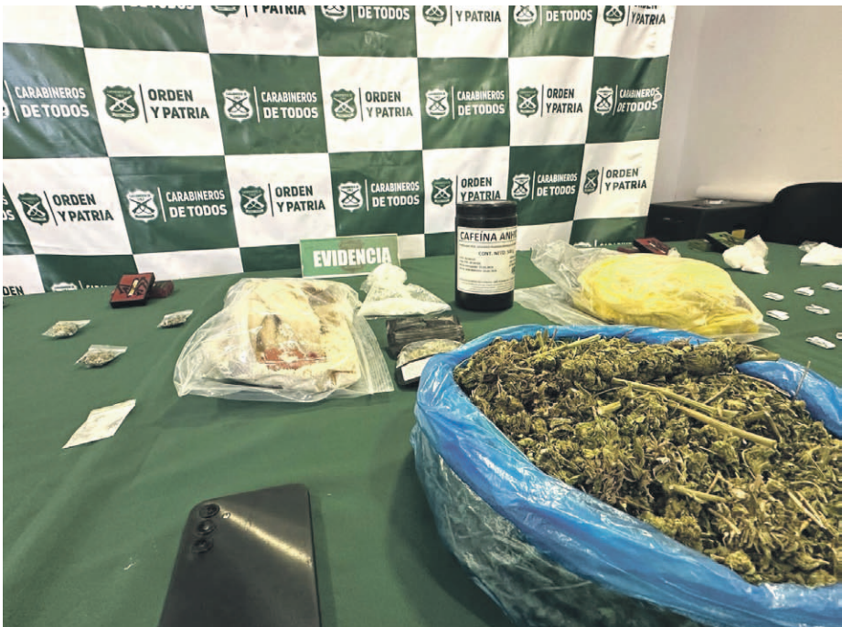
El trabajo del OS7 pudo establecer que el grupo operaba con tres puntos de acopio y venta de drogas en la Población 17 de Septiembre.

del OS7 Coquimbo en la Población 17 de Septiembre, en la zona nororiente de La Serena. El trabajo operativo en terreno consideró una intervención simultánea en tres viviendas con apoyo de carabineros especializados del GOPE y la Sección de Intervención Policial, la cual derivó