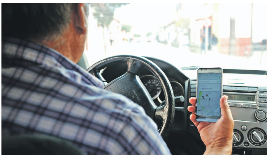
El reglamento definió que, desde ahora, podrán operar vehículos con un mínimo de 1.400 centímetros cúbicos de cilindrada o equivalente.

Sin embargo, uno de los puntos que ha levantado más críticas por parte de estas empresas, apunta a que los con-