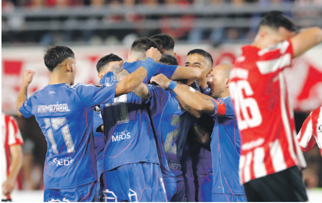
Mostrando un gran nivel de juego, la "U", se recuperó para vencer a Estudiantes de La Plata, sumando su segundo triunfo en el Grupo A.

En los primeros 10 minutos de juego en suelo trasandino, Universidad de Chile pasó del infierno a la gloria en su segundo compromiso del Grupo A de Copa Libertadores. El elenco azul, que comenzó perdiendo tempranamente ante Estudiantes, necesitó de tres minutos para dar vuelta el compromiso y quedarse con valiosos 3 puntos que lo alzan como único líder del Grupo A de Copa Libertadores. En choque de invictos,