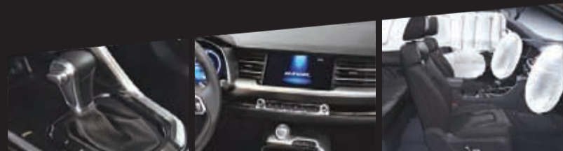
CAJA AUTOMÁTICA 7 VELOCIDADES DE SERIE

(**) CONSUMO HASTA: CIUDAD 8,4 KM/L · CARRETERA 14,2 KM/L