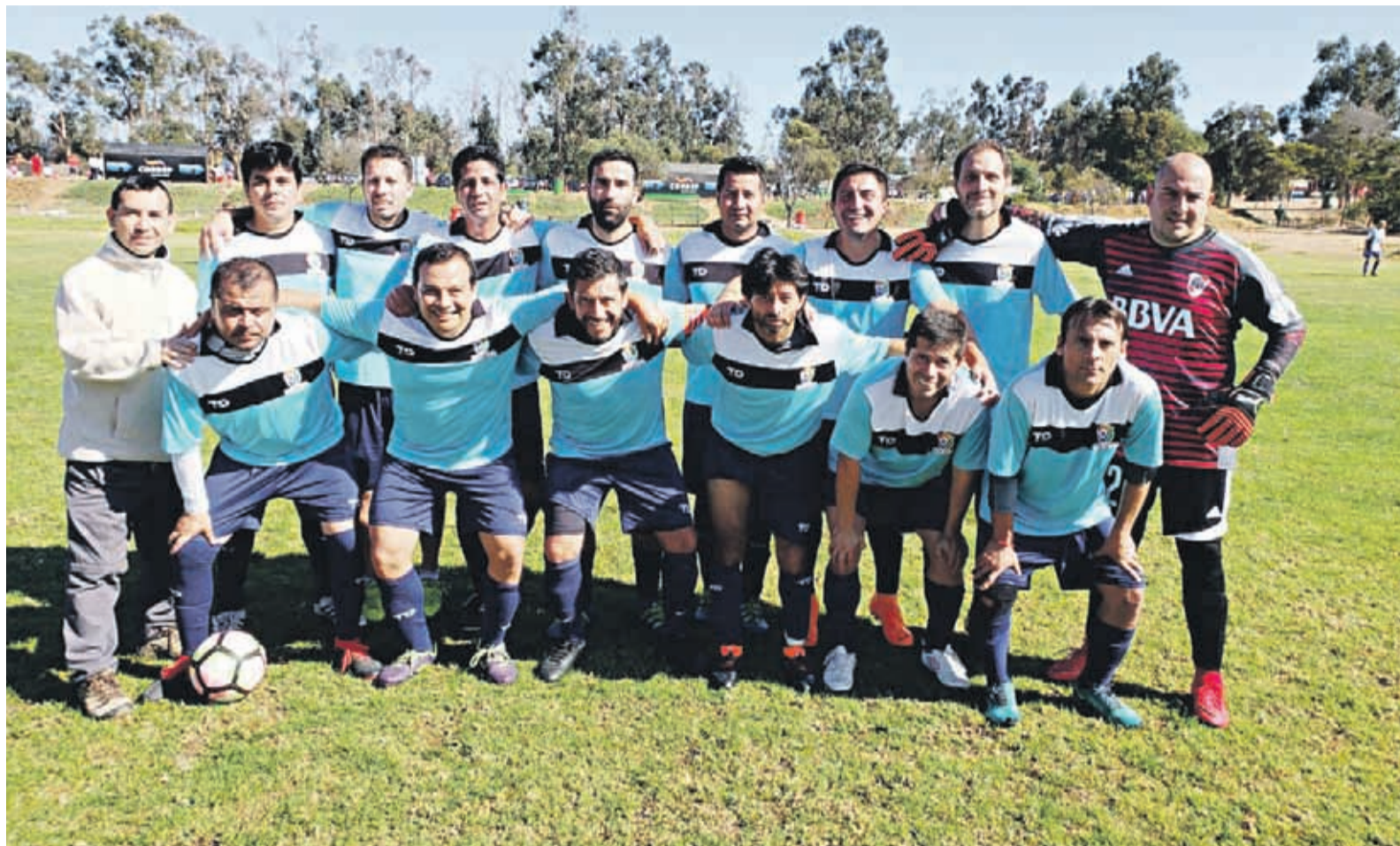
Julieta FC espera seguir extendiendo su buen momento en la Liga Cordep.

“Trabajar con mucho esfuerzo cada partido, ir fecha a fecha y de esa forma