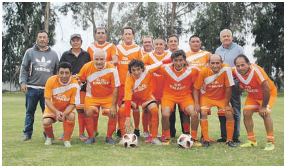
Emase se impuso 2 a 1 sobre Araucano en categoría Súper Sénior.