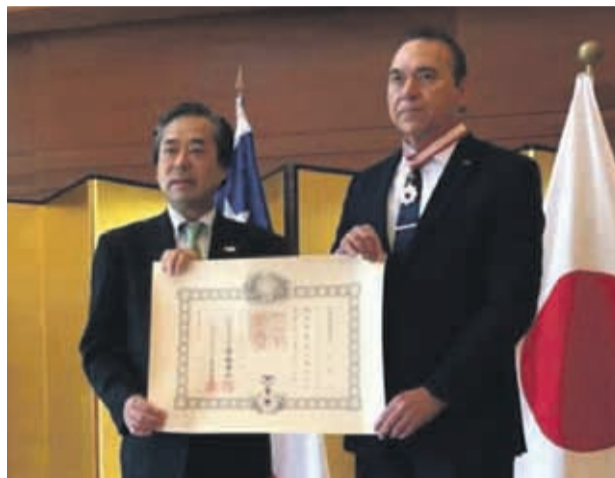
La distinción fue entregada en nombre del Emperador emérito Akihito, por su contribución a la difusión de la cultura nipona y el desarrollo de la enseñanza del idioma japonés en Chile.