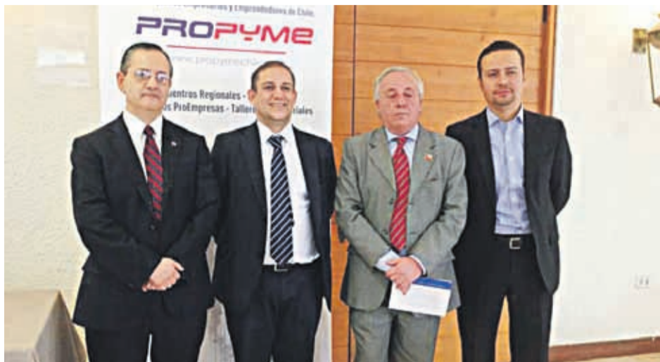
Autoridades dieron a conocer los detalles de la Ley de Pago a 30 días en la ciudad de La Serena.

"Llevamos dos trimestres de aumento en los plazos, lo que marca un cambio de tendencia en relación a trimestres anteriores. Respecto de las razones de esto, estimamos que el mayor dinamismo económico ha incrementado los requeri-