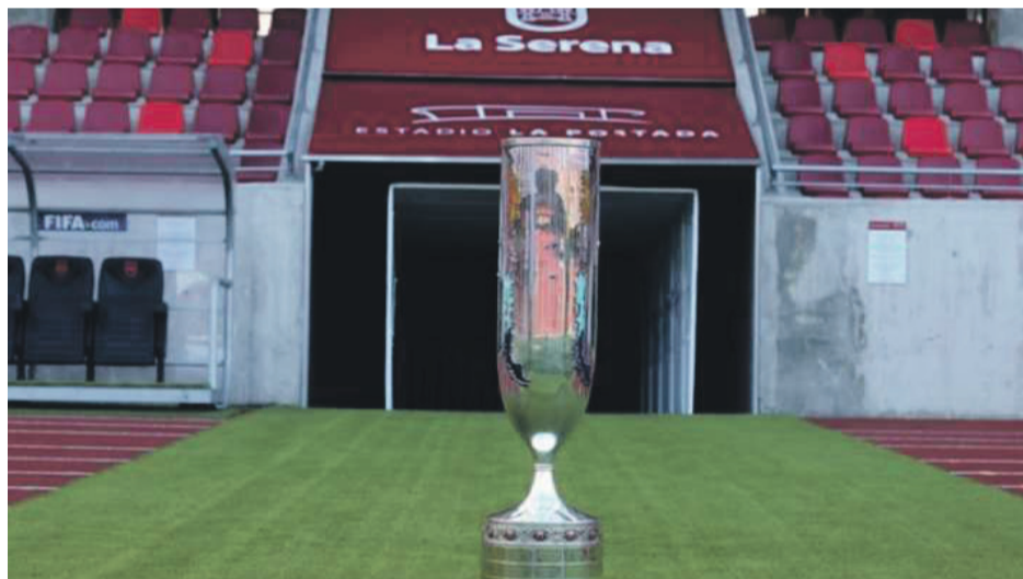
Ya tienen rivales para el torneo federativo los equipos de la región de Coquimbo. La primera quincena de junio se disputarán los cotejos de ida y vuelta.

En otros cruces Colo Colo hará su estreno en el certamen ante Deportes Puerto Montt, mientras que Universidad de Chile debutará ante Rangers.