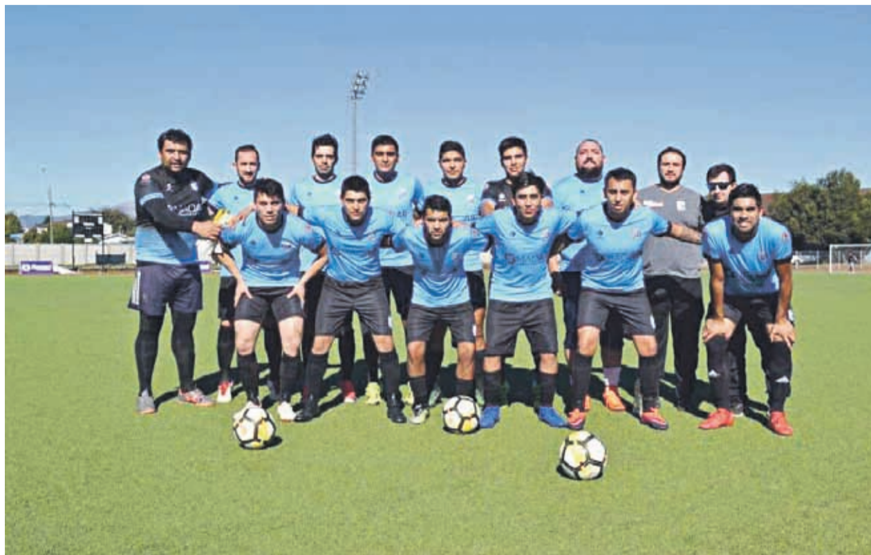
Javiera Carrera de Angol será el rival de Unión Bellavista en la final nacional.