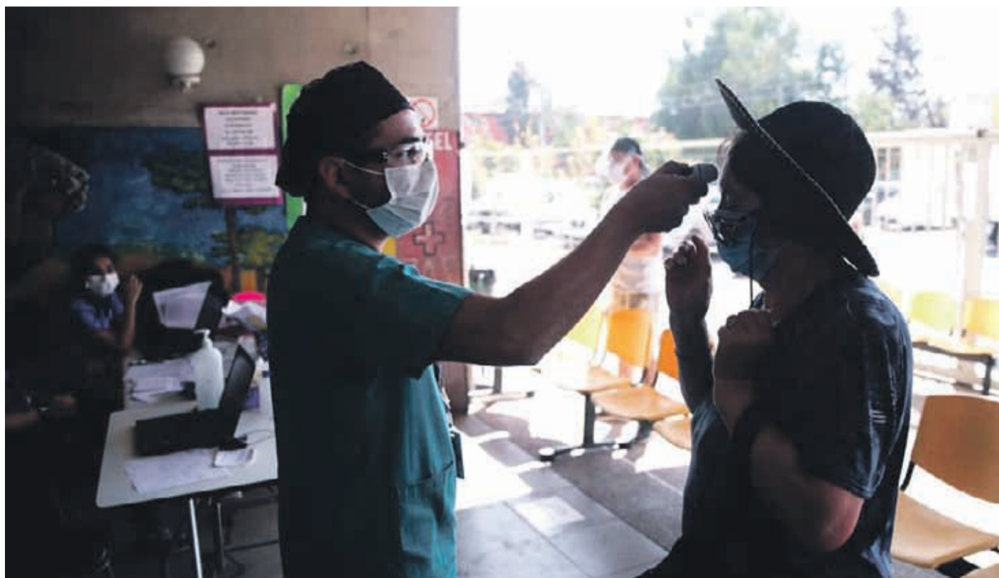
Los casos de Covid-19 han ido creciendo en la comuna en los últimos días, generando preocupación en las autoridades.

“Además he solicitado el contingente militar que tenga más presencia en la comuna y que ayude a controlar el comportamiento social y a vigilar que se cumpla el toque de queda impuesto. Hay que reconocer, y las autoridades lo han dicho, no podemos tener un carabinero en cada esquina, por lo que