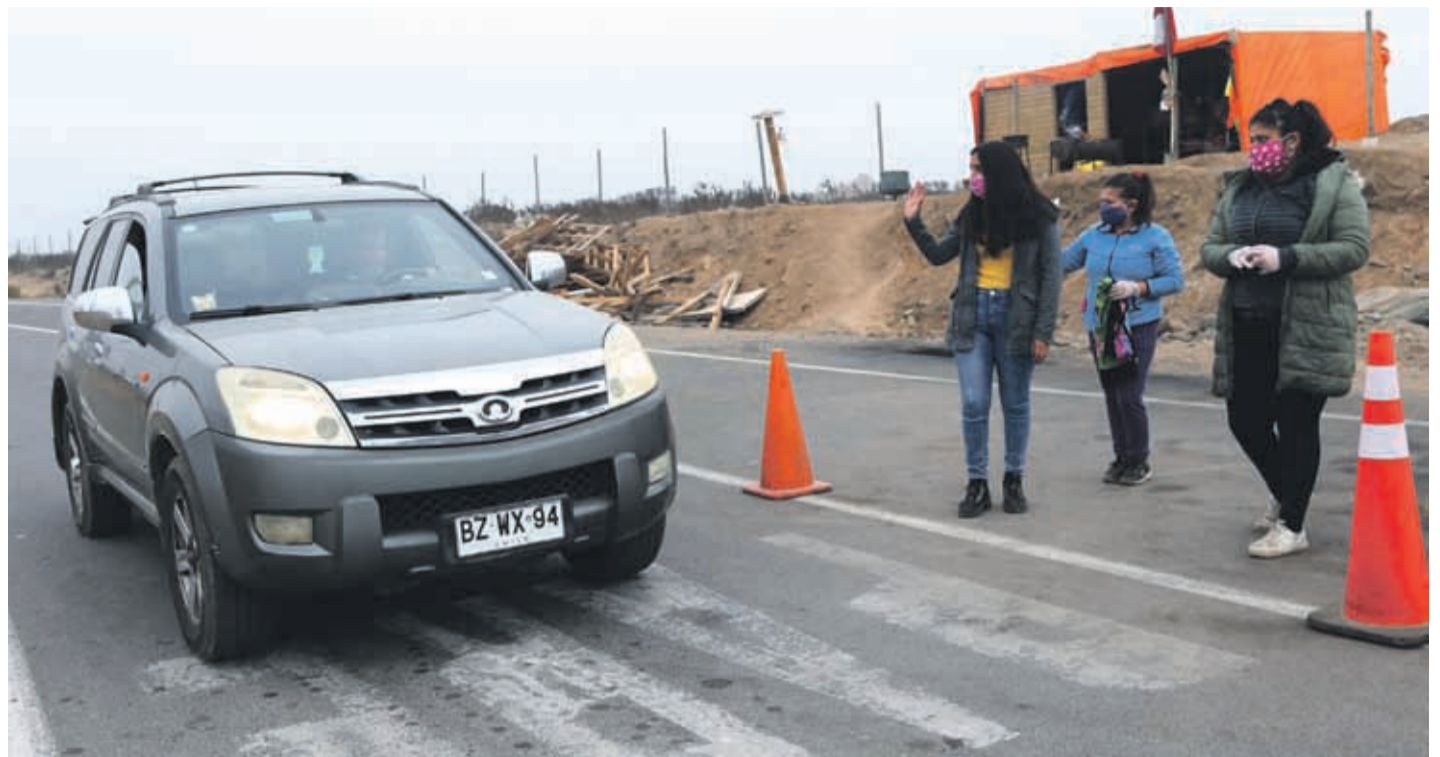
En los accesos a las localidades costeras de Coquimbo, los vecinos han implementados sus propios controles, indicando que los mueve el temor de que el coronavirus llegue a sus pequeños pueblos y sea fatal.

Su temor ha aumentado, ya que dice que recibieron antecedentes de que había una persona contagiada en otra localidad. “Estamos aterrados, más ahora que supimos que en Guanaqueros habría un caso, sería una chica que trabaja en el área de salud en Ovalle, la habían mandado a hacer cuarentena por sospecha y ella se fue a Guanaqueros a la casa del pololo, porque había un cumpleaños y tuvo contacto con más personas. Estamos más aterrados que nunca porque hay colectivos que trasladan gente de Guanaqueros y Tongoy y entran a Totoralillo cuando traen gente, pero