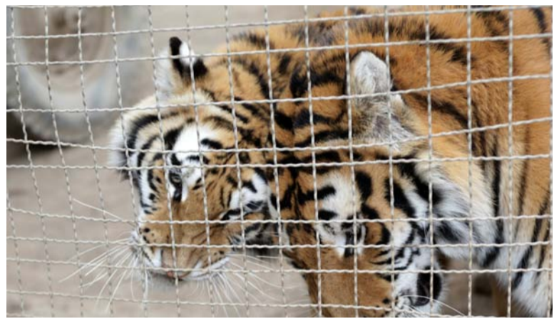
La Serena Zoo tiene una gran variedad de animales exóticos

Por otro lado, el administrador declaró sobre el contacto del zoológico con el Parque Pedro de Valdivia, que también alberga animales y la posibi-