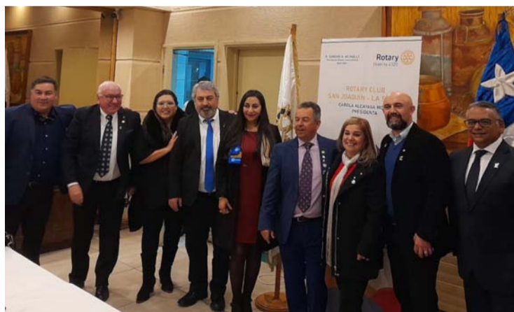
Los integrantes de Rotary San Joaquín realizaron su ceremonia de cambio de mando.

rante el periodo que le correspondió liderar el trabajo social de apoyo, encontrando un tremendo apoyo y compromiso en su gestión, "acá no se necesitaba de muchos recursos, sino que gente comprometida para gestionar y prestar ayuda y apoyos