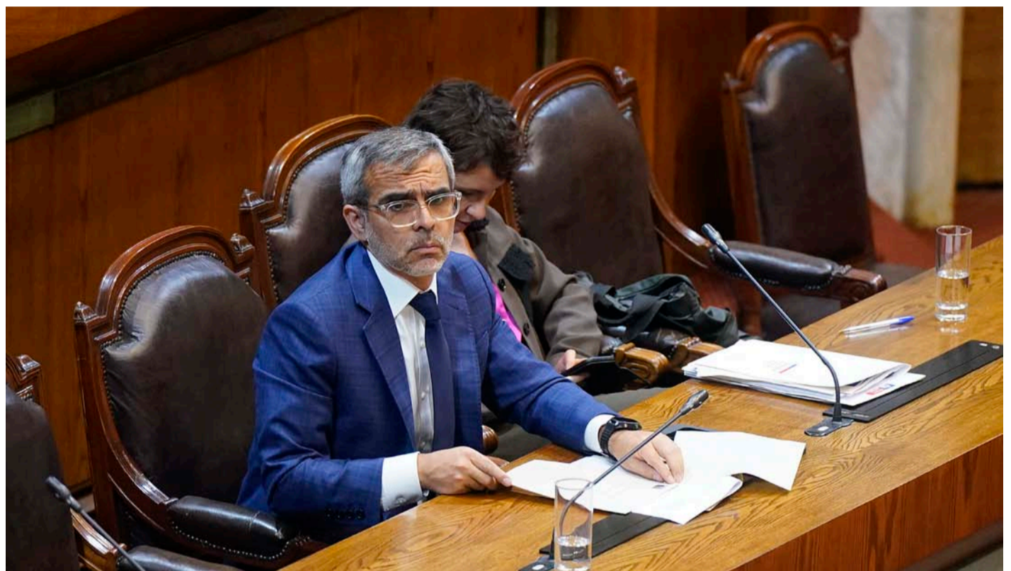
MINISTERIO DE JUSTICIA

Ante la facultad legislativa del Ejecutivo de cerrar fundaciones cuando se estimen contrarias a la ley, desde la oposición exigen terminar la vida jurídica de aquellas organizaciones involucradas en el denominado Caso Convenios.