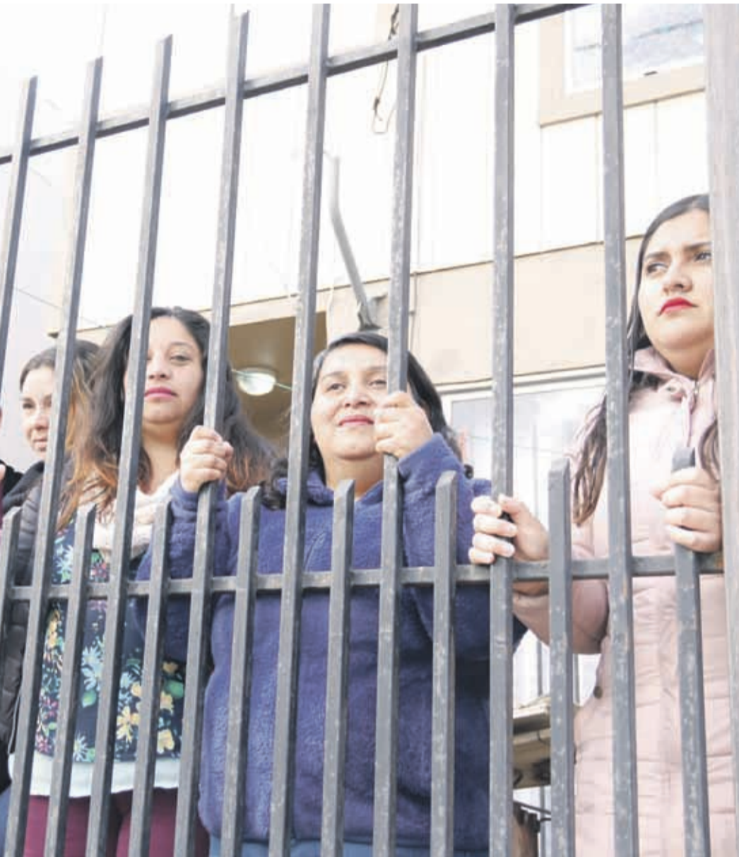
Las vecinas del sector acusan que prácticamente no pueden salir de sus casas debido a la delincuencia.