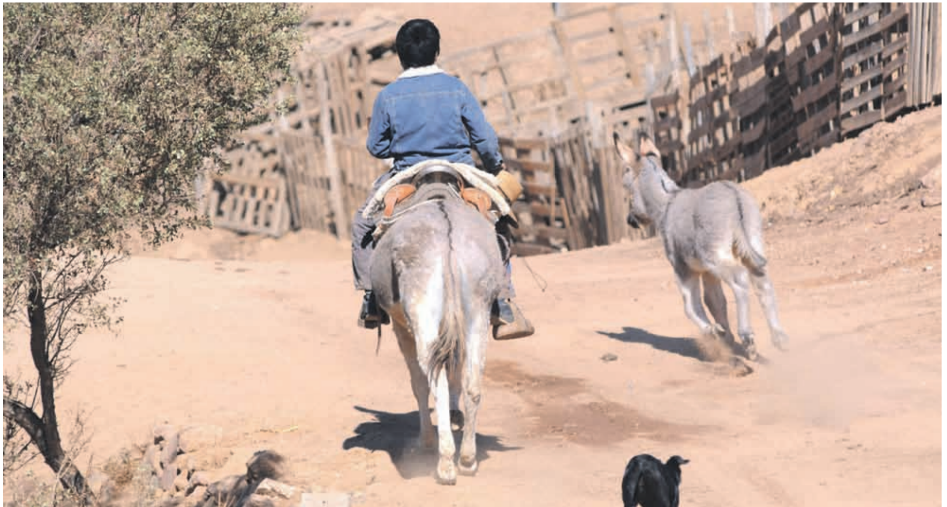
Crianceros, agricultores y regantes piden que ante la sequía, se avance en soluciones de carácter estructurales para enfrentar la escasez hídrica.