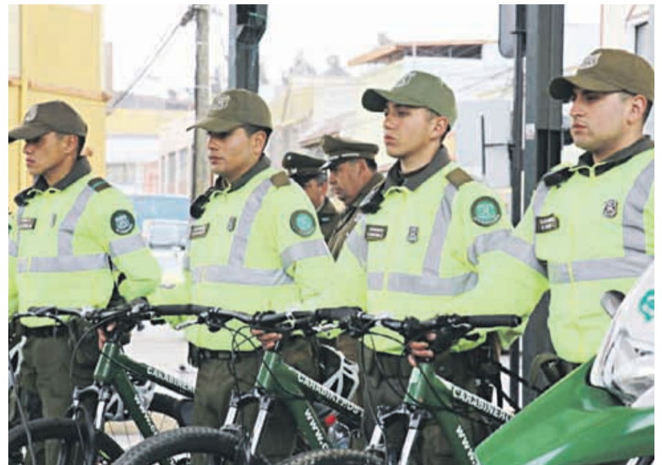
Autoridades comprometieron funcionarios de punto fijo en el centro de Coquimbo para combatir la delincuencia.

Las obras se han extendido, entre otras cosas, por los retrasos en los arreglos de la distribución eléctrica, generando múltiples críticas a la empresa CGE. En