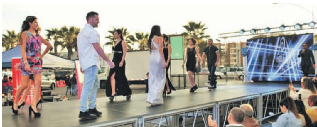
Desfile temporada Primavera - Verano. Participación de clientes y representantes de las diferentes tiendas del centro comercial

Un entretenido cierre de vacaciones de invierno realizó Mall Puerta del Mar, un desfile de moda, animación y un coctél fueron parte de la jornada que contó con la participación de representantes de las diferentes tiendas del centro comercial