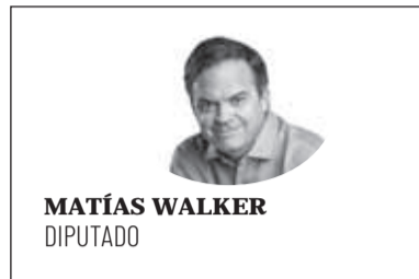
MATÍAS WALKER DIPUTADO

Según el reporte, son 3.928 los fallecimientos en todo el país que aún están a la espera de una confirmación de examen PCR. Así, sumando estos sospechosos con los 10.011 reportados hoy por el Ministerio de Salud en su balance diario, la cifra de fallecimientos llegaría a un total de 13.939. Asimismo, se informó que la tasa observada por cien mil habitantes es de 20,2 en el país.