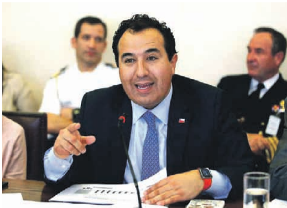
Juan Francisco Galli, subsecretario del Interior, informó sobre la expulsión de un ciudadano peruano que envió amenazas al Presidente Piñera.

El subsecretario del Interior, Juan Francisco Galli, dijo que tenían que dar una señal clara. El ciudadano peruano, había dirigido un correo electrónico a la presidencia en el mes de marzo y se determinó que se encontraba de forma irregular en el país.