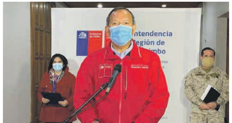
Las autoridades sanitarias llamaron a la población a permanecer en sus casas este fin de semana y a cumplir la cuarentena obligatoria en la conurbación La Serena Coquimbo.