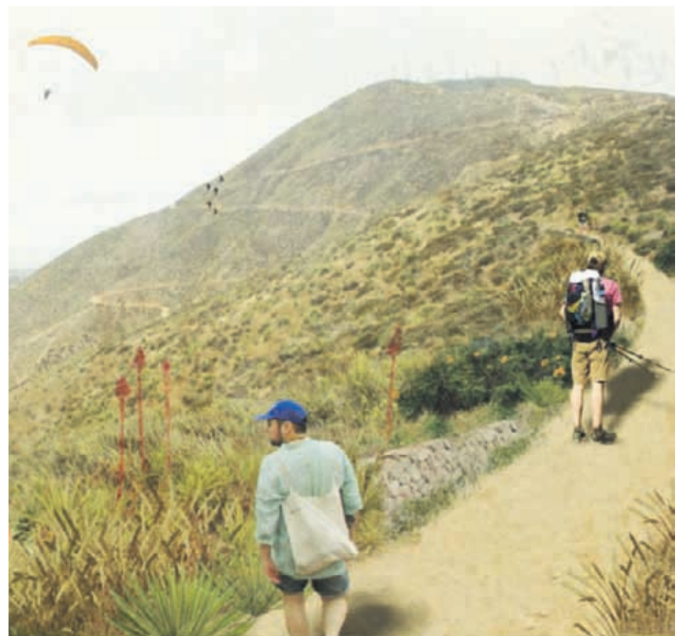
Se destrabó la problemática con las acciones de agua, de esta manera el proyecto sigue adelante al contar con el vital suministro.