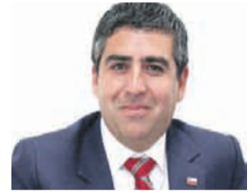
ROBERTO VEGA SEREMI DE MINERÍA

"Necesitamos tener esa capacidad de energía limpia que permita reemplazar las centrales a carbón, segundo, infraestructura de transmisión que permita esa conexión entre los grandes centros de generación y los centros de consumo".