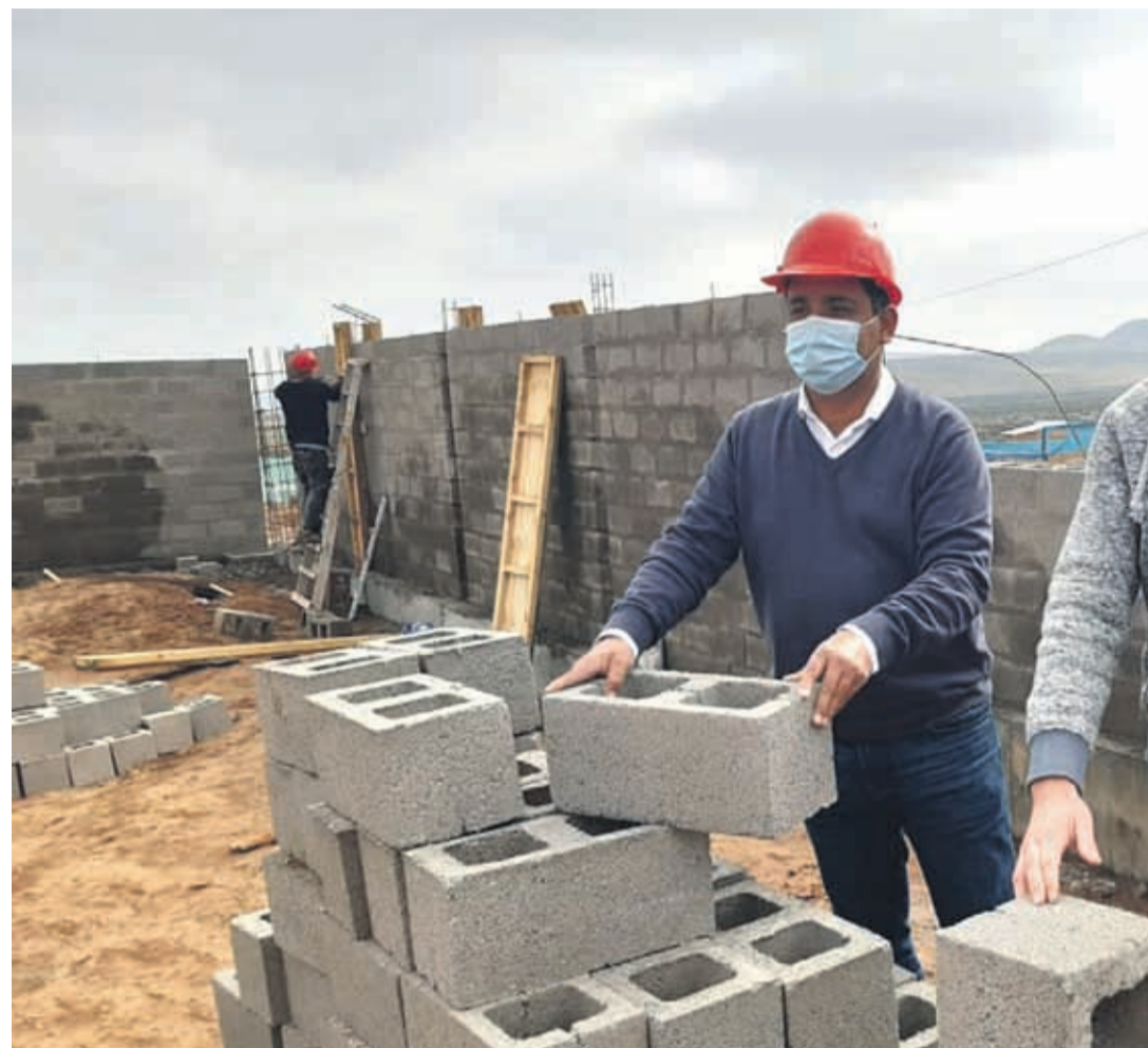
Cada uno de los 7.700 bloques que conforman el muro de albañilería, de 310 metros lineales y 2,5 metros de altura, contiene en su interior alrededor de 20 botellas de plástico reciclado.

toneladas de plástico se sacaron de circulación gracias a la ampliación del cementerio de Las Compañías