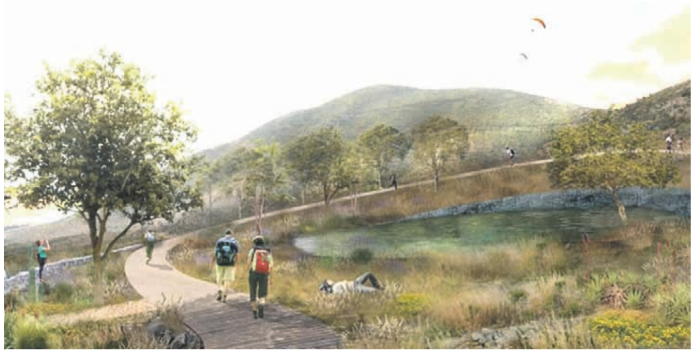
El proyecto contempla 88,5 hectáreas destinadas para proyectos deportivos, áreas de esparcimiento y nuevos accesos.

Este acto administrativo, es un complemento a la concesión de uso gratuito entregada el año 2018. Son 88,5 hectáreas destinadas para proyectos deportivos, áreas de esparcimiento y