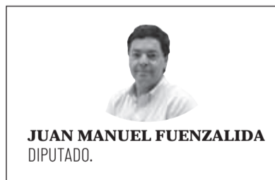
JUAN MANUEL FUENZALIDA DIPUTADO.

Sin duda, que han sido días difíciles para todos los habitantes de la conurbación La Serena-Coquimbo. La cuarentena total significa una serie de restricciones en la movilidad y las actividades diarias de las personas, familias, comercios, etc.