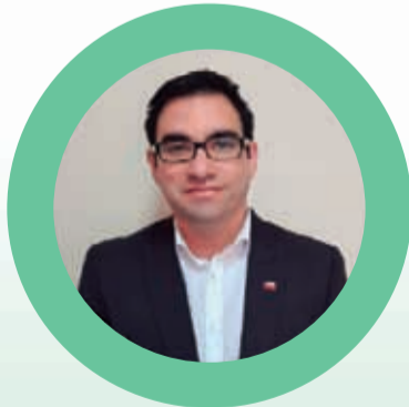
CARLOS LILLO Seremi de Economía

"Poder llegar a nuevos clientes y ser un aporte al crecimiento económico de las localidades"