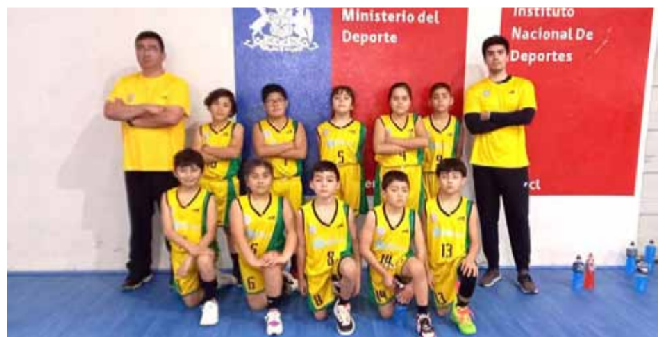
La serie U11 de la Academia de Básquetbol del Club Villalón de Ovalle, logró dos triunfos en un cuadrangular celebrado en Los Vilos.

Cabe señalar que la academia y escuela de básquetbol del Club Villalón, es formativa en esta disciplina y depende del multicampeón y reconocido Club Arturo Villalón