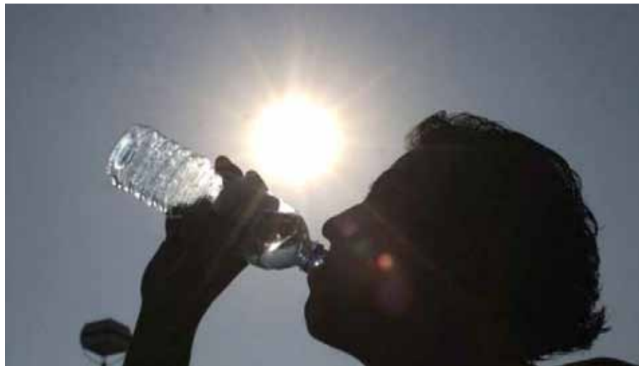
Las mayores temperaturas se podrían alcanzar en la zona que se extiende entre Talca y Los Ángeles.

La investigación realizada por un agroclimatólogo de la Universidad de Talca proyectó que, en algunas zonas, las temperaturas máximas esperadas podrían llegar hasta 42°C o 43°C durante la estación estival.