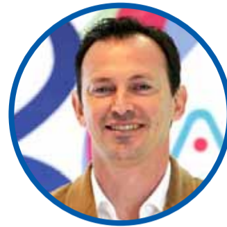
Ali Manouchehri ALCALDE DE COQUIMBO

"También importa por Coquimbo y su población, ya que extendería la tradicional fiesta de La Pampilla, celebración que se espera con tanta expectativa dada las suspensiones de años anteriores"