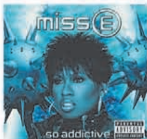
7 Missy Elliott, 'Miss E... So Addictive' 2001 16 57:07