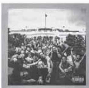
5 Kendrick Lamar, 'To Pimp a Butterfly' 2015 16 78:51