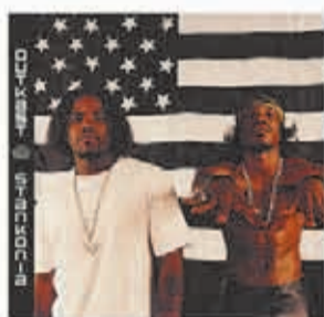
2 Outkast, 'Stankonia' 2000 24 73:07