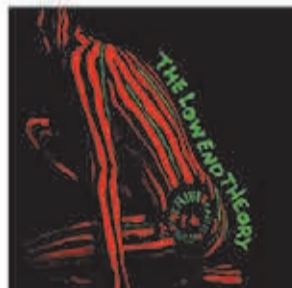
9 A Tribe Called Quest, 'The Low End Theory' 1991 14 48:03