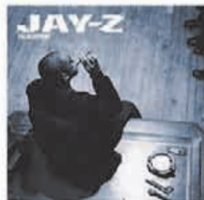
3 Jay-Z, 'The Blueprint' 2001 14 55:44