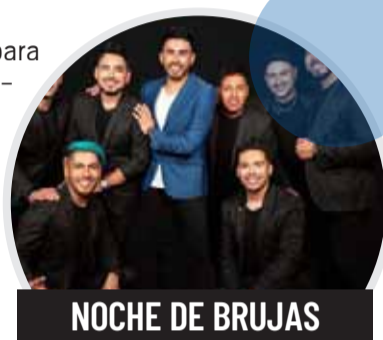
NOCHE DE BRUJAS

Fecha: 17 de septiembre Costo: $34 millones Íconos de la música andina.