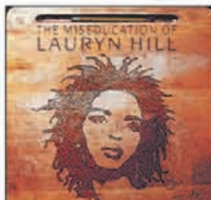
10 Lauryn Hill, 'The Miseducation of Lauryn Hill' 1998 16 77:39