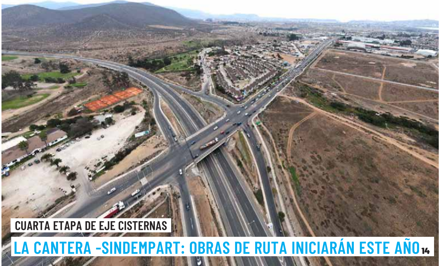
CUARTA ETAPA DE EJE CISTERNAS

LA CANTERA -SINDEMPART: OBRAS DE RUTA INICIARÁN ESTE AÑO 14