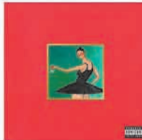
6 Kanye West, 'My Beautiful Dark Twisted Fantasy' 2010 13 68:36