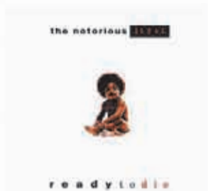
1 The Notorious B.I.G., 'Ready to Die' 1994 17 69:05