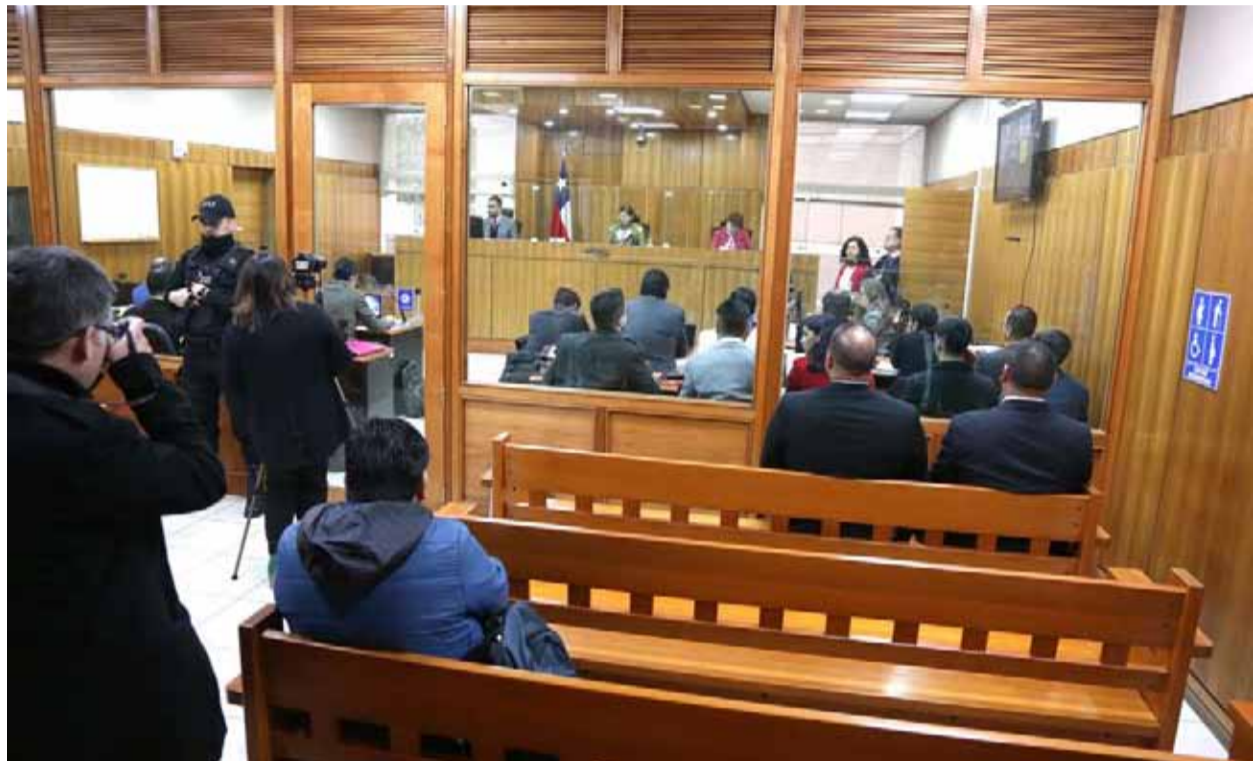
Este miércoles se continuará con los testimonios de nuevos peritos por parte de la Fiscalía.