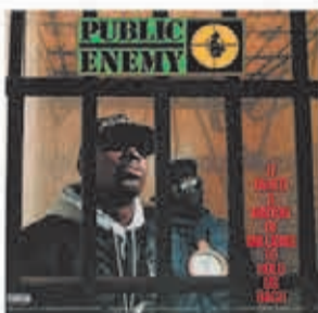
4 Public Enemy, 'It Takes a Nation of Millions to Hold Us Back' 1988 16 57:51