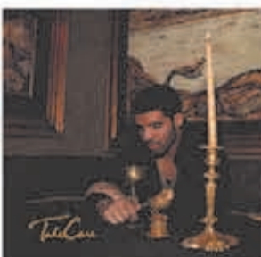
11 Drake, 'Take Care' 2011 18 80:18