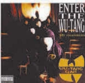
8 Wu-Tang Clan, 'Enter the Wu-Tang (36 Chambers)' 1993 13 58:26