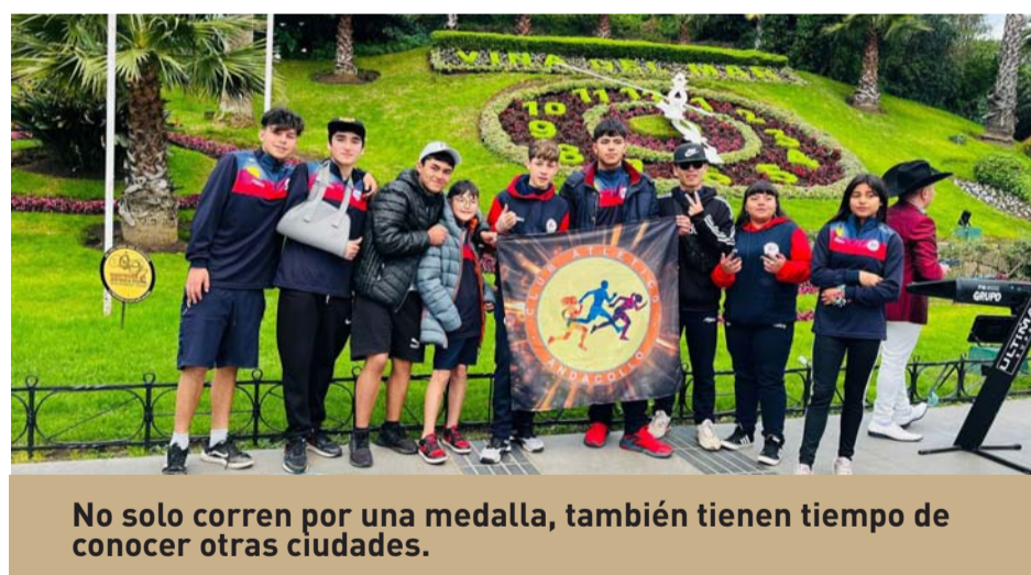
No solo corren por una medalla, también tienen tiempo de conocer otras ciudades.

La práctica de deportes es difícil y más si se trata del atletismo. Pero los niños de la comuna se sobreponen a todas las limitaciones de infraestructuras y también la de competir contra colegios particulares. Lo hacen porque tienen sueños de volar y subir al podio y las herramientas se las está dando el Club Social y Deportivo Atlético Andacollo.