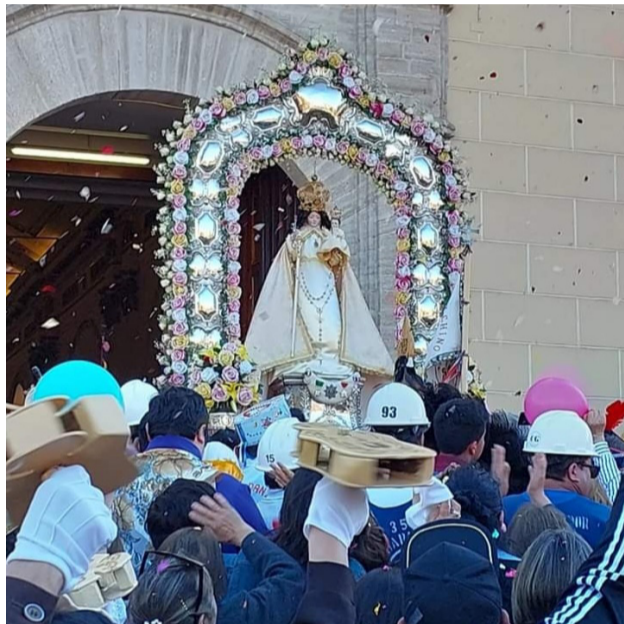
La tradicional procesión con la imagen de la Virgen Nuestra Señora del Rosario.