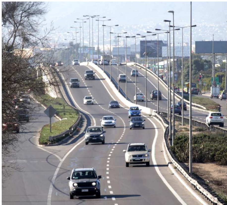
La propuesta considera un túnel en el Cerro Grande y un cuarto puente hacia Las Compañías.

La mayoría de los consultados por El Día consideran que una circunvalación