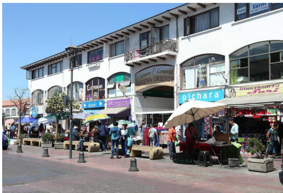
El gremio pide una mayor intervención y apoyo de las autoridades.

Recordemos que a los efectos del llamado “octubrismo”, también se sumaron los coletazos de la pandemia que afectaron duramente al gremio, que vio mermada su actividad durante varios años. Hoy, intentan salir adelante, pero enfrentando una serie de dificultades, principalmente el aumento de la delincuencia.