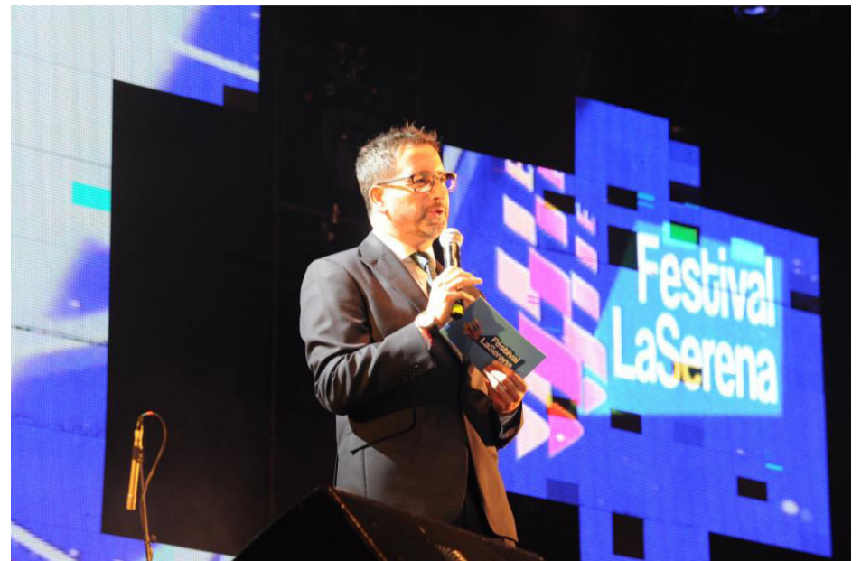
La última edición del evento se vivió el mes de febrero del 2019.