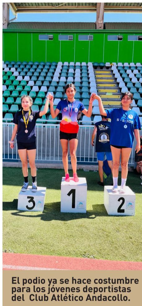
El podio ya se hace costumbre para los jóvenes deportistas del Club Atlético Andacollo.