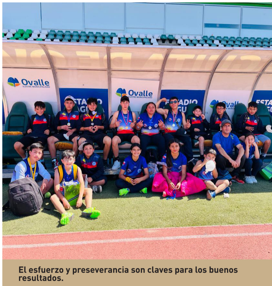
El esfuerzo y perseverancia son claves para los buenos resultados.

Si bien cuentan con la indumentaria deportiva y una sala multiuso, esperan concretar una pista atlética.