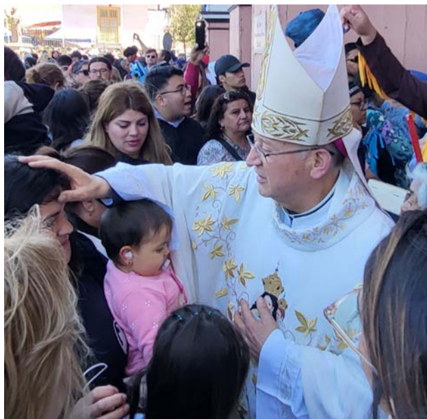
El arzobispo de La Serena, René Rebolledo, y los fieles a la Virgen del Rosario de Andacollo.