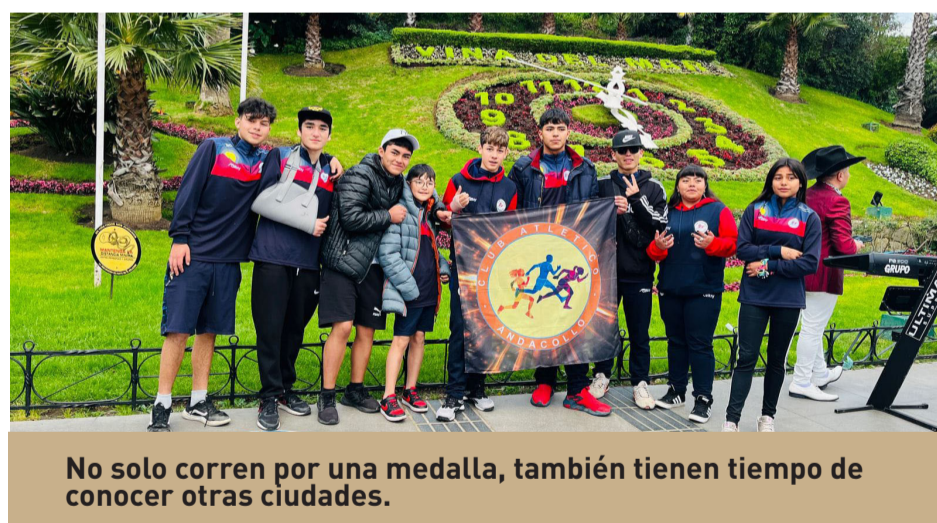
No solo corren por una medalla, también tienen tiempo de conocer otras ciudades.

La práctica de deportes es difícil y más si se trata del atletismo. Pero los niños de la comuna se sobreponen a todas las limitaciones de infraestructuras y también la de competir contra colegios particulares. Lo hacen porque tienen sueños de volar y subir al podio y las herramientas se las está dando el Club Social y Deportivo Atlético Andacollo.