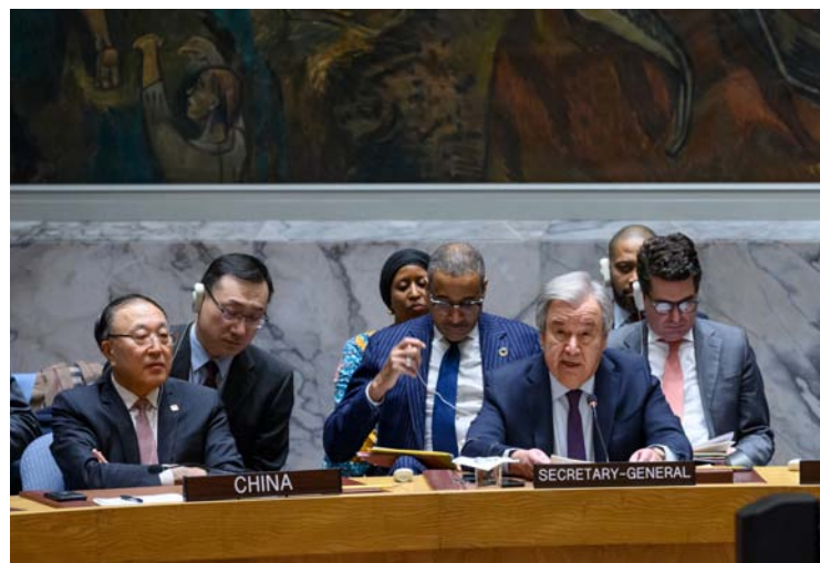
La guerra de Gaza ha dejado ya 17.000 palestinos muertos y 1.200 israelíes.

Es la segunda vez desde que comenzó la guerra de Gaza en que Estados Unidos veta una resolución en este mismo sentido -lo hizo el 18 de octubre-, alineándose así con Israel.