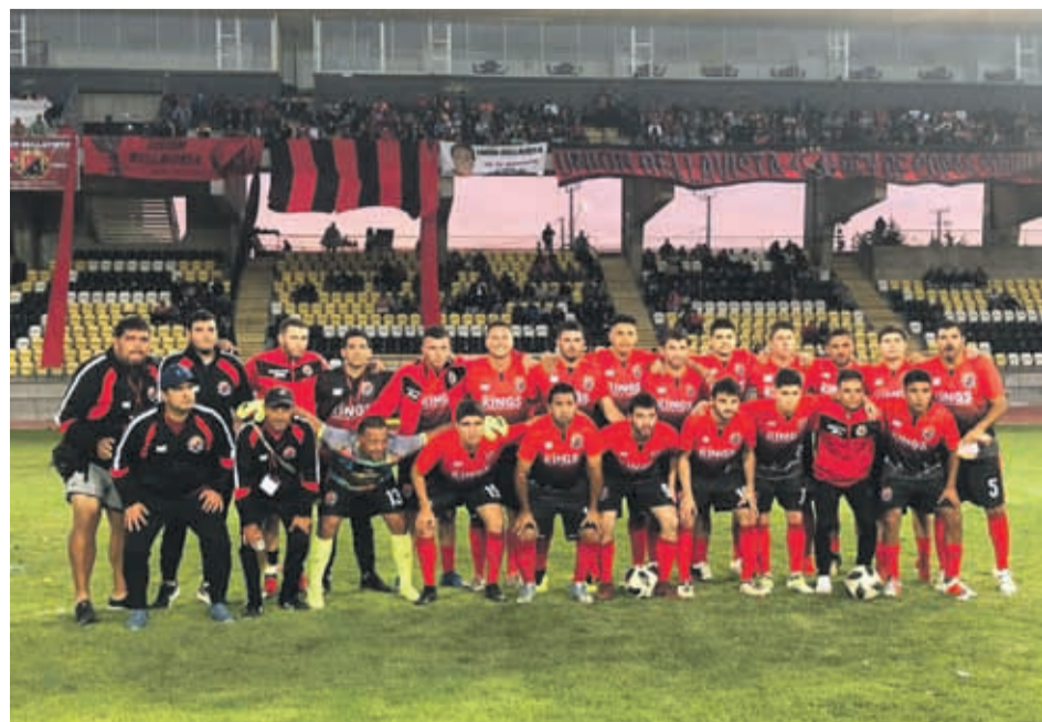
Unión Bellavista ganó sus dos primeros duelos y se ilusiona con llegar a la gran final. SURRANDANDO VV