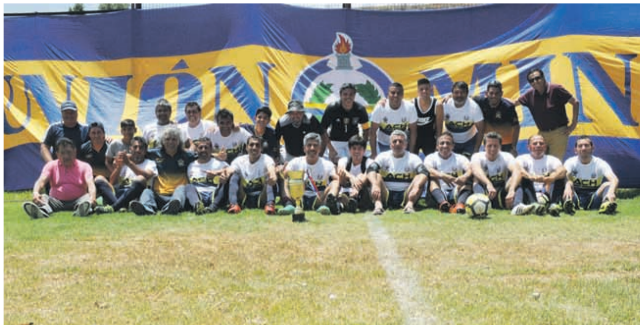
Una imagen tradicional para el club: el equipo y la copa. Ahora, esperan seguir festejando, esta vez, en el regional Sub 45. (SURRANDANDO VW)

-¿Qué destaca del grupo humano de la institución?