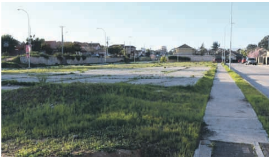
Konard Zuse con Rodolfo Wagenknecht es la intersección dónde se ubica el terreno cedido por el municipio para la construcción del nuevo retén de Carabineros, el que fue evaluado por personal técnico de la institución policial

Tras ello no se han conocido mayores antecedentes al respecto, generando la preocupación en la comunidad, que por meses luchó por este proyecto y actualmente se encuentran en