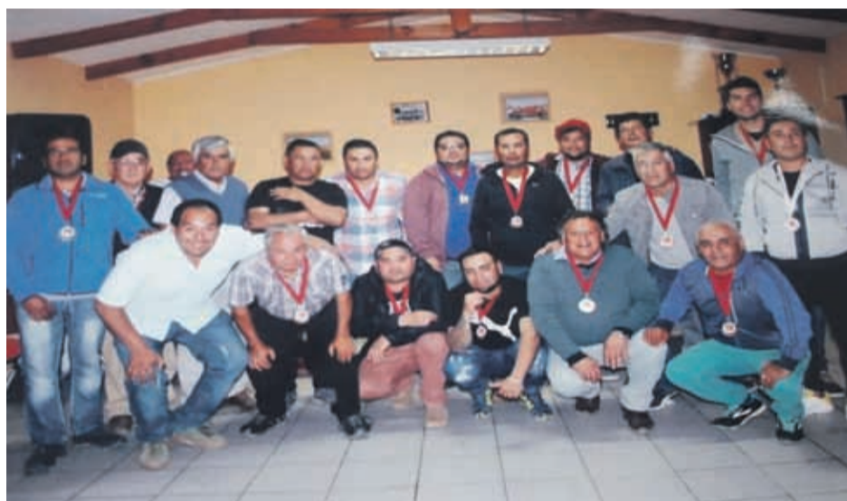
Con sus medallas de reconocimiento los presidentes de los clubes de la Asociación Serena Norte.