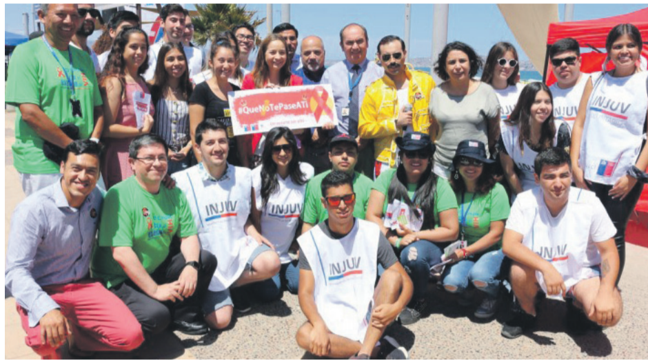
Muchos jóvenes respaldan la iniciativa que esperan sea replicada en otras zonas concurridas de la región

"Durante los últimos cinco años, en personas entre los 15 y 29 años ha aumentado más del 55% el contagio de VIH, por eso hacemos un llamado a todos los jóvenes para que