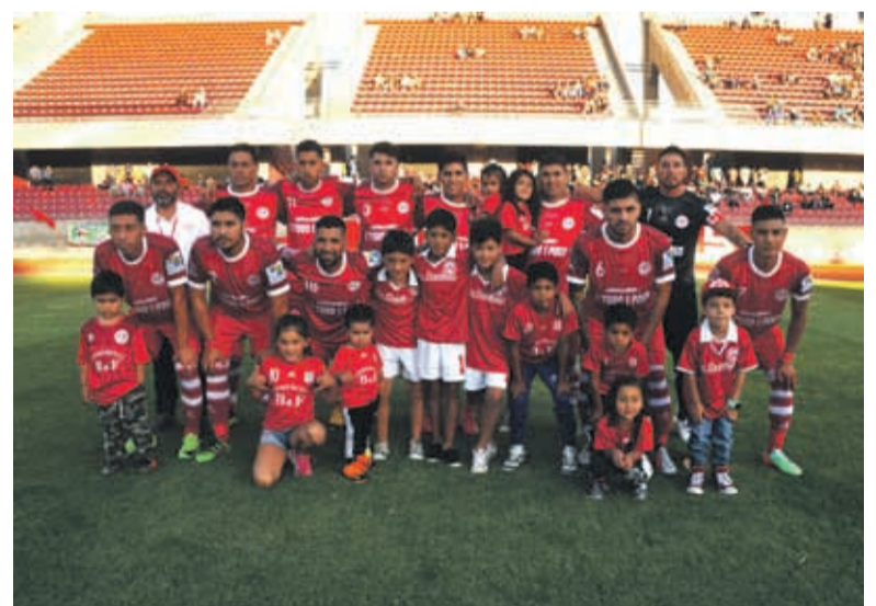
Los locales, el Club Deportivo Los Copihues se quedó con un importante triunfo en su estreno.