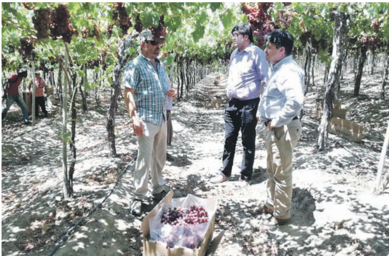
En la localidad de Mostazal, ubicada al interior de Monte Patria, el fundo Pampa Grande ha sumado más hectáreas de recambio.

“El mercado de la uva de mesa presenta un recambio varietal que en los últimos años ha avanzado en forma acelerada, esto se debe a las nuevas condiciones que este presenta, a las ventajas que tienen las nuevas variedades como Timco, Allison y Ralli entre otras, en relación a la uva Flame que poco a poco va quedando obsoleta”, dijo la autoridad, quien agregó que es relevante el trabajo que están realizando produc-