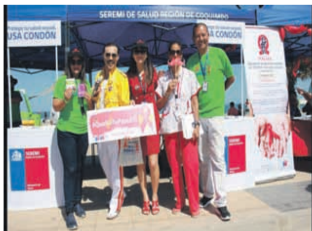
Las autoridades de salud recordaron que en todos los Cefsam se realiza el test rápido del VIH y también es gratuito

se acerquen porque vamos a estar en distintas playas con stands para realizar de forma gratuita el test de VIH. Es realmente importante prevenir debido a las últimas cifras que se manejan", acotó. Por su parte el Seremi de Salud, Alejandro García detalló que el test rápido está