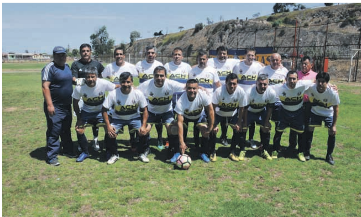
La formación inicial del pasado domingo en el Parque Coll, donde luego de ir cuatro goles a dos en desventaja, lograron dar vuelta el marcador. (SURRANDANDO VW)

"Fue una temporada muy irregular para nosotros. Nos tuvimos que adaptar a que la mayoría trabajara por turnos y eso nos impidió consolidar un equipo base. Dimos mucha ventaja. Incluso, en algunos partidos nos presentamos con siete jugadores. Pero de todas formas logramos entrar a la Liguilla Final y en dos partidos emocionantes logramos ganarla para volver a ser parte de la Copa de Campeones", comenzó diciendo.