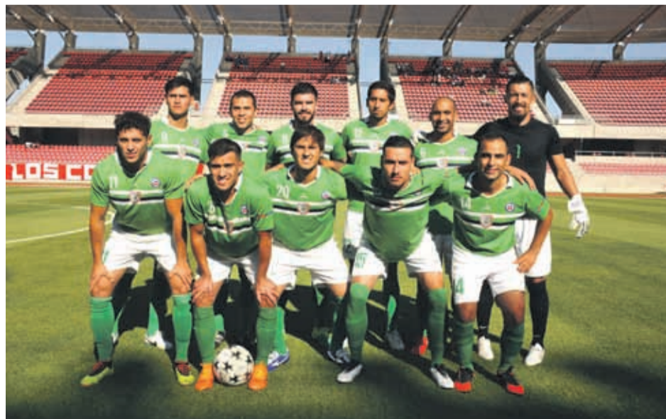
El Sauce de la Región de Valparaíso tuvo las mejores ocasiones de gol, pero no pasó del empate. SURRANDANDO VV