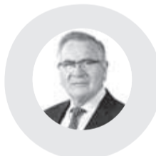
Raúl Saldivar Auger (PS)

El autor es diputado por la región de Coquimbo