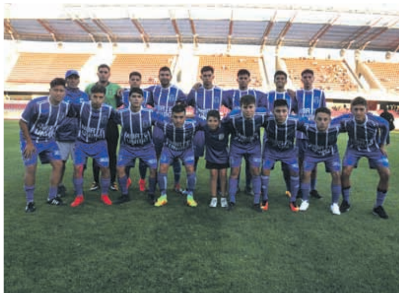
Norte Unido de Iquique luchó hasta el final y nunca bajó los brazos, pero no pudo evitar la derrota.

Los Copihues debutó con un importante triunfo 4-2 sobre Norte Unido. Por su parte, Unión Bellavista empató en la agonía 1-1 ante Juventud Norrambuena y sumó un punto de oro en su lucha por llegar a la gran final.