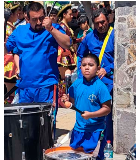
Desde muy temprana edad nace la fe hacia a la Virgen.