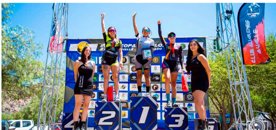
Misol siempre en el podio con los brazos al cielo.