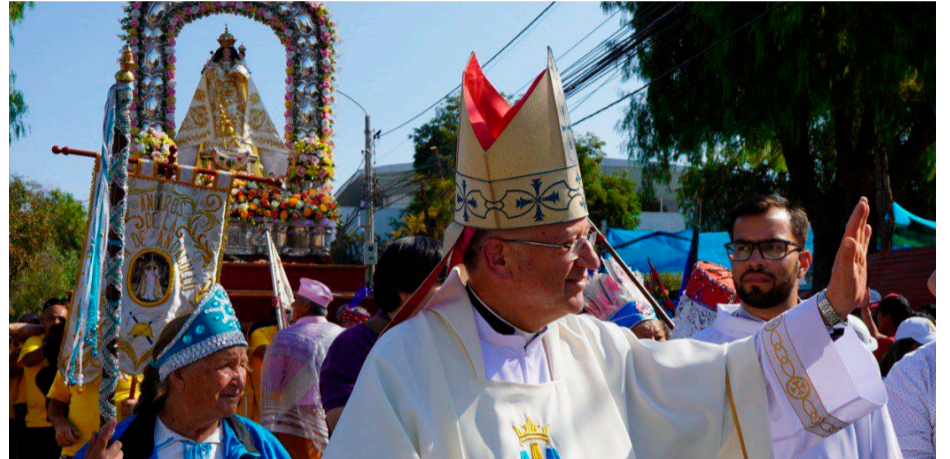
La procesión de La Chinita fue seguida con mucha pasión y fe por los peregrinos.