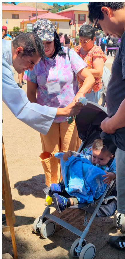
La fe de una familia recibiendo la bendición.