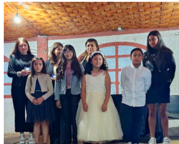
Parte de los asistentes a la Cena de Gala de la Unión Comunal del Deporte