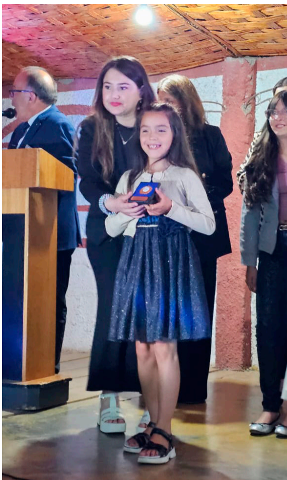
Una gala donde se reconoció el talento indistintamente de la edad.