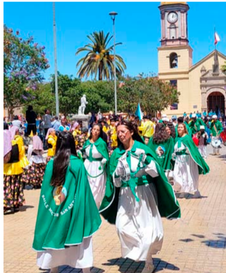
Los bailes religiosos no tuvieron inconvenientes para bailar a la Chinita.