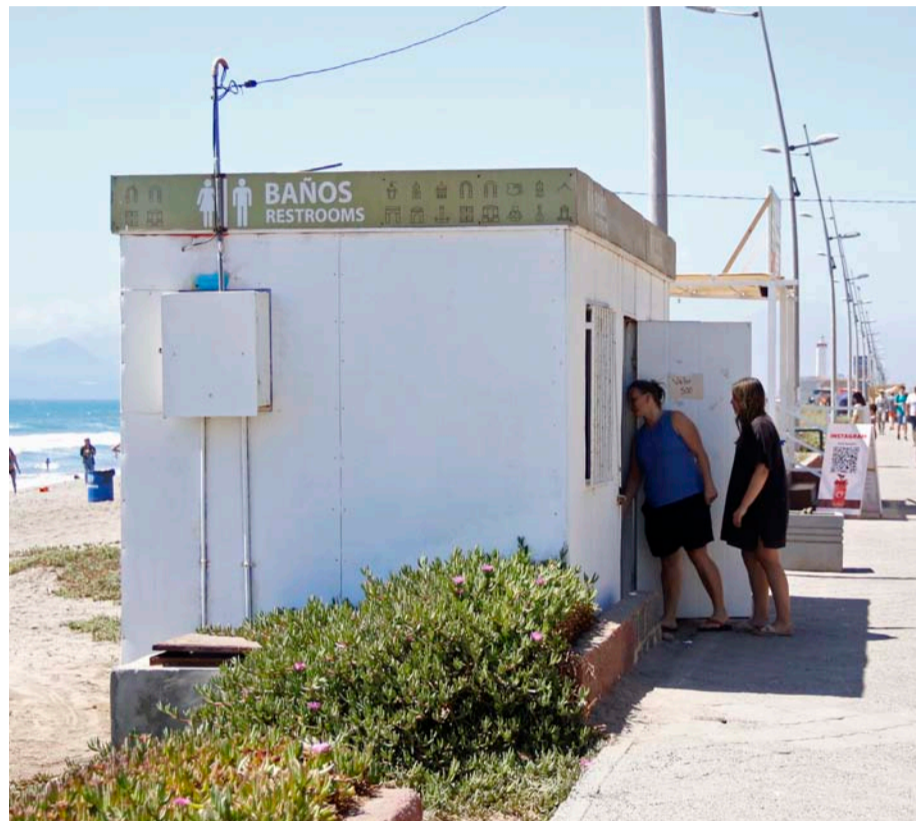
En la Avenida del Mar, si bien es posible encontrar baños públicos, no siempre están abiertos.