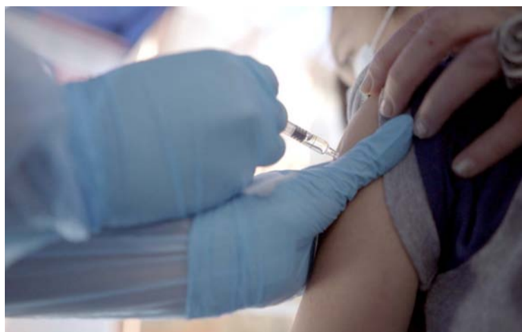
La autoridad sanitaria reiteró el llamado a la vacunación.