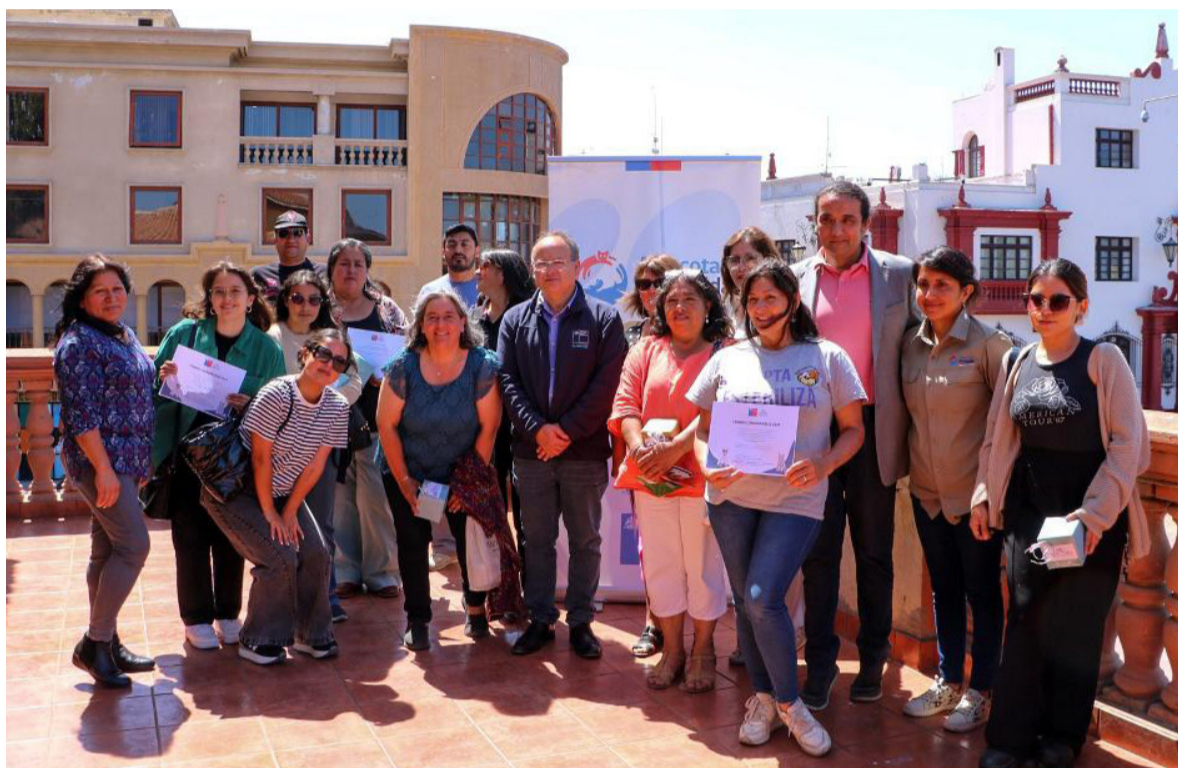
Casi 40 millones de pesos entregó la SUBDERE a organizaciones no gubernamentales en la región.

Instituciones de La Serena y Coquimbo fueron reconocidas por su aporte a la promoción del cuidado y rescate animal, tras haberse adjudicado recursos de los fondos concursables de la SUBDERE.