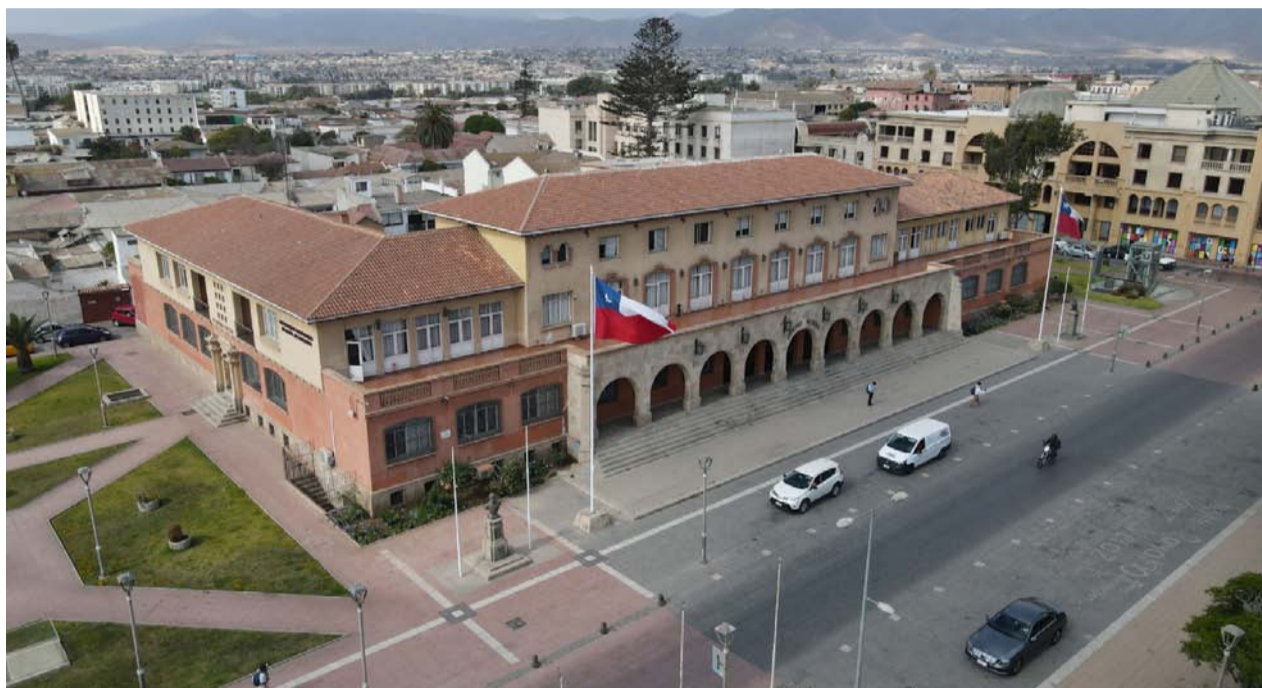
El preciado cargo de gobernador regional asoma como "la madre de todas las batallas" en las elecciones.