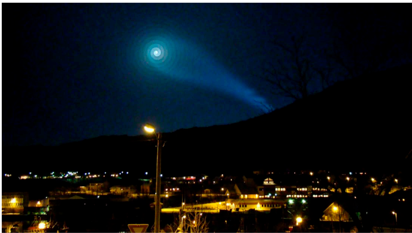
Un extraño efecto lumínico visto en 2009 sobre la base militar de Skjold, en el norte de Noruega.