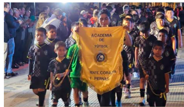
El futuro del deporte andacollino desfilando orgullosos.