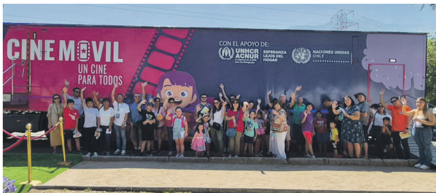
Con la intención de asegurar el éxito de la actividad, se realizaron coordinaciones con el Departamento de Cultura y Recreación.

Cada función - a las 11:00 horas "Elementos", a las 15:00, "Intocable" y a las 18:00, "Las nadadoras" - está planificada para 100 personas, que es la capacidad máxima que tiene el camión que traslada a esta flamante sala que cuenta con aire acondicionado y tecnología de punta en butacas, imagen y sonido, todo gracias a una