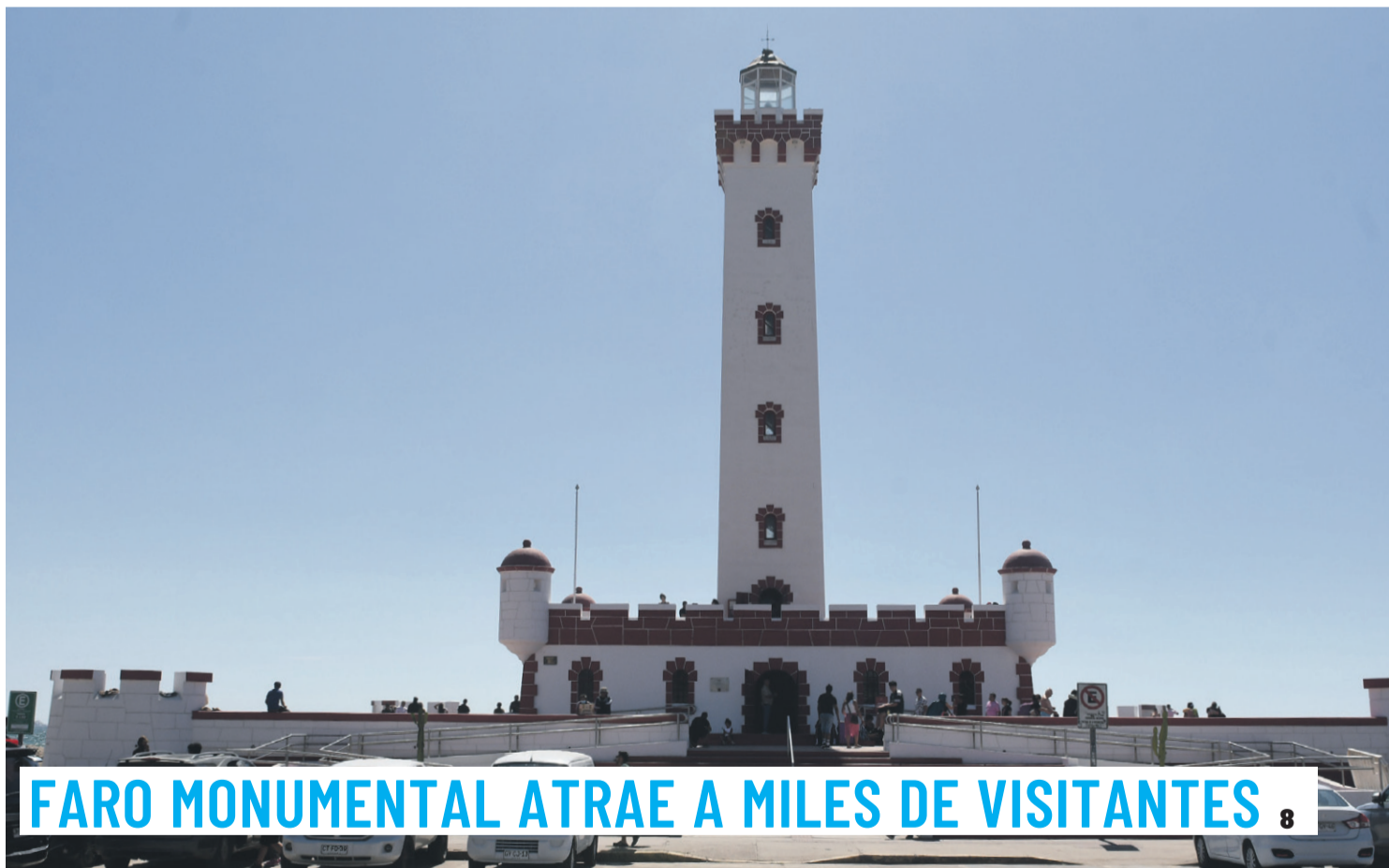
FARO MONUMENTAL ATRAE A MILES DE VISITANTES 8