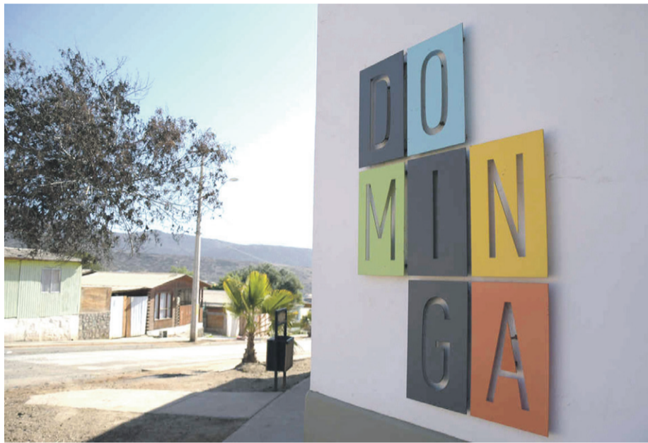
Una vez que la resolución sea despachada desde el Comité de Ministros, las partes podrán revisarla para determinar las acciones a seguir.

El pasado miércoles, la instancia ministerial -que no contó con los secretarios de Estado titulares- decidió calificar negativamente el proyecto de Andes Iron, pero lejos de ser un punto final, tanto la compañía como los terceros a favor, podrían acudir nuevamente al Tribunal Ambiental para tratar de anularlo.