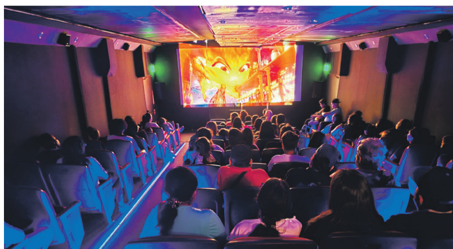
Cada función está planificada para 100 personas.

Con la intención de asegurar el éxito de la actividad, se realizaron coordinaciones con el Departamento de Cultura y Recreación, que está a cargo de la difusión y entrega de invitaciones. Quienes deseen asistir a cualquiera de las funciones deben retirar las entradas de manera presencial en Benavente 404, Barrio Inglés, Coquimbo.