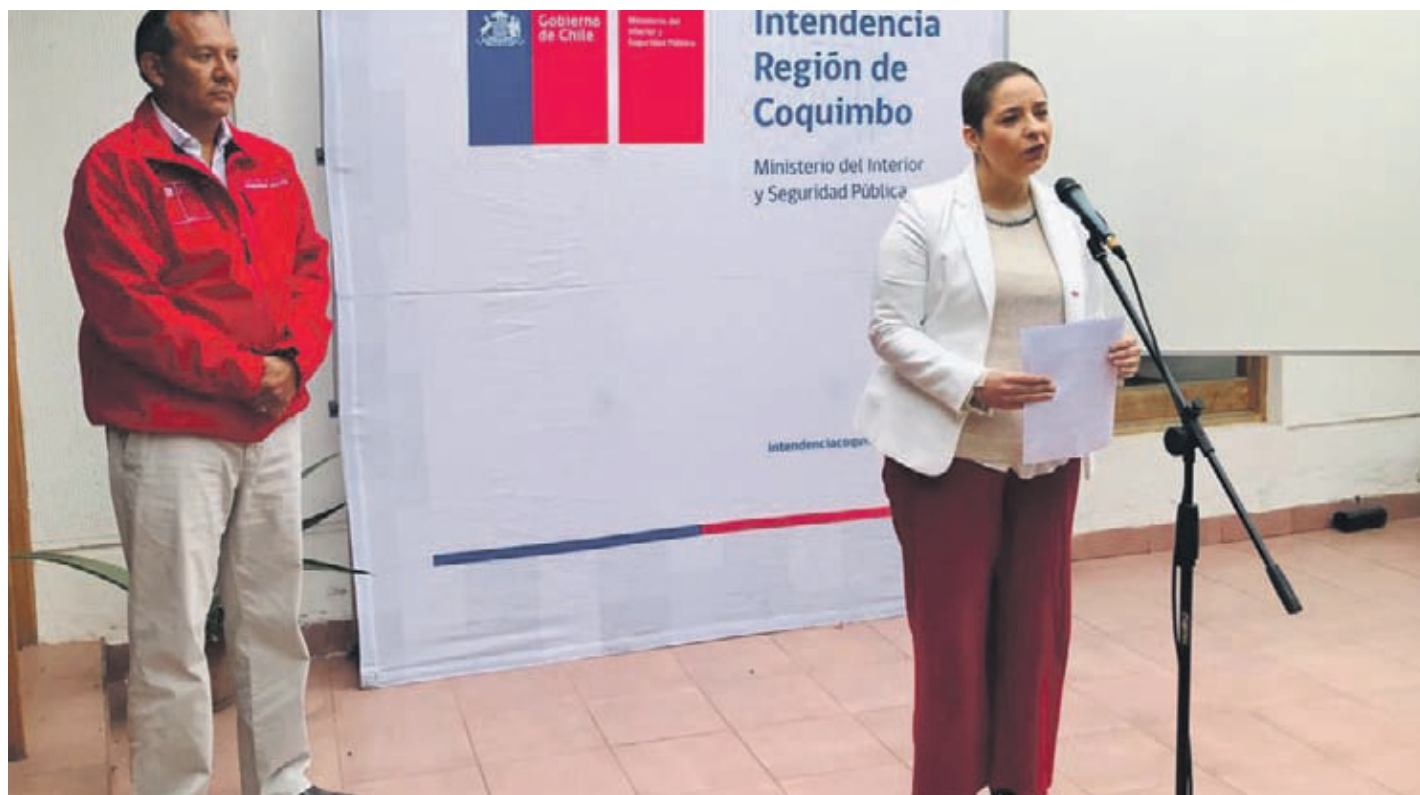
Intendenta regional Lucía Pinto junto al Seremi de Salud Alejandro García entregando el informe diario de los casos regionales con COVID-19.

"Los pacientes reciben dos llamados telefónicos al día por la delegada de epidemiología para saber su estado general, si ha tenido algún síntoma, fiebre i necesidad durante los 14 días