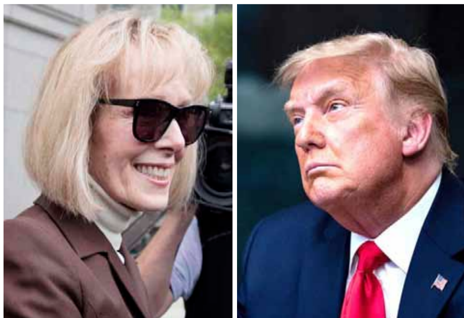
La acusación de la escritora E. Jean Carroll en contra de Trump data de un caso de violación ocurrido a mediados de los años 90 del siglo pasado, el cual, fue hecho público en 2019.

El juez se dirigió acto seguido a los abogados y les preguntó si tenían algo que añadir, a lo que ambos equipos, defensores y acusación, respondieron con una negativa.