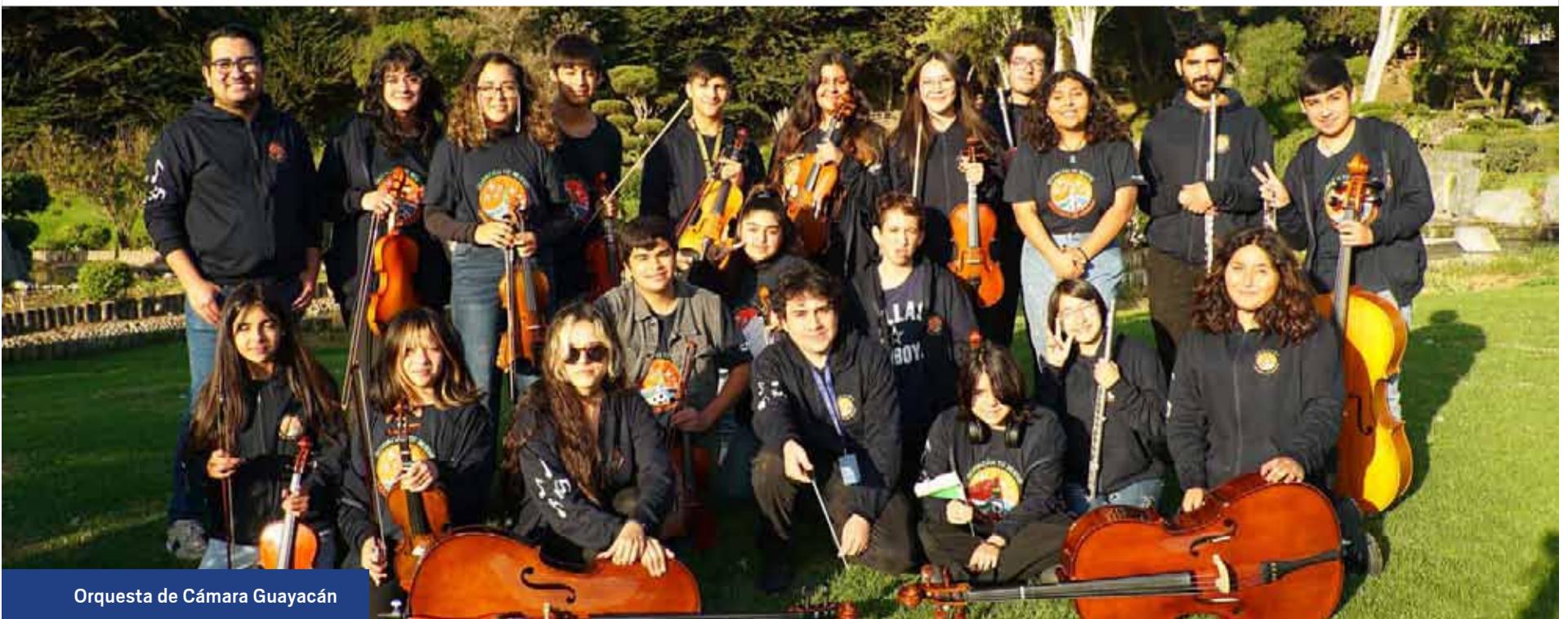
Orquesta de Cámara Guayaquén