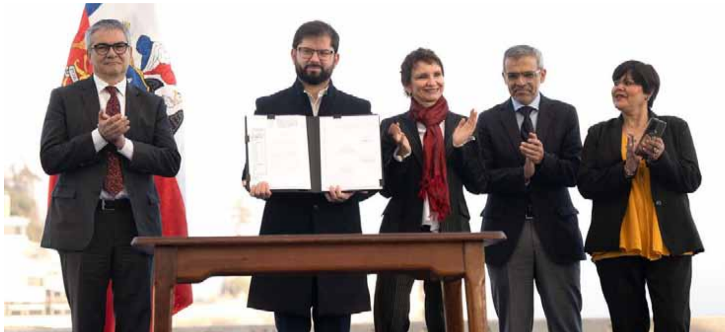
La nueva ley permitirá cortar el financiamiento de quienes se dedican al tráfico y venta de sustancias ilícitas, además de establecer, la obligación a nuevos sujetos a reportar sobre sus actividades comerciales a la Unidad de Análisis Financiero.

La nueva norma establece una serie de herramientas para agilizar y mejorar la persecución de este tipo de delitos, regula el destino de los bienes incautados en esos casos y fortalece las instituciones de rehabilitación y reinserción social.