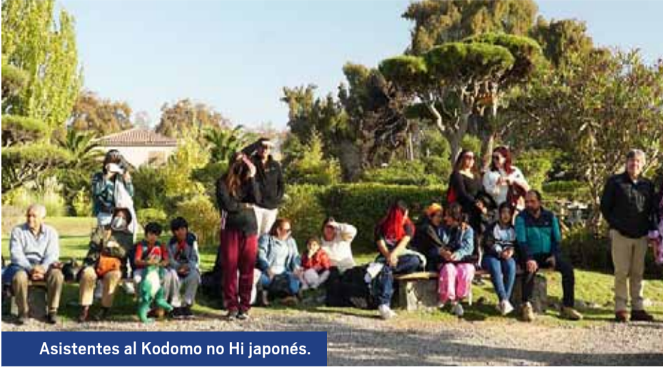
Asistentes al Kodomo no Hi japonés.