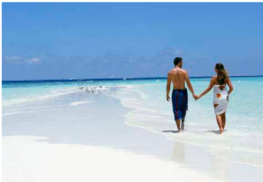
Imagen de una pareja caminando por una playa de Nika, en las Maldivas.

Esta joya insular excepcional, que forma parte del paradisíaco archipiélago de las Maldivas, en el Océano Índico, estando fuera de los circuitos habituales del turismo de masas, ha sido bautizada como la “primera Isla Gentil del mundo” debido a la gentileza de sus iniciativas sociales y culturales hacia los ecosistemas.