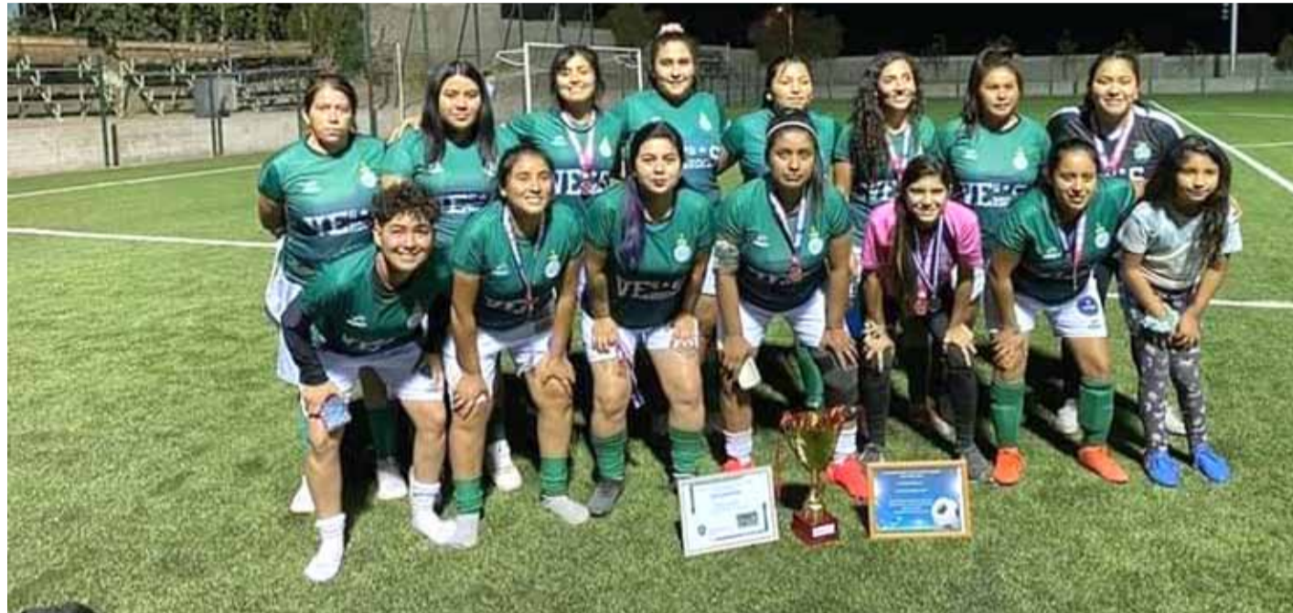
El equipo de Vegas Verdes, no podrá defender el título en la versión 2023, por lo que se conocerá a un nuevo campeón en octubre próximo.