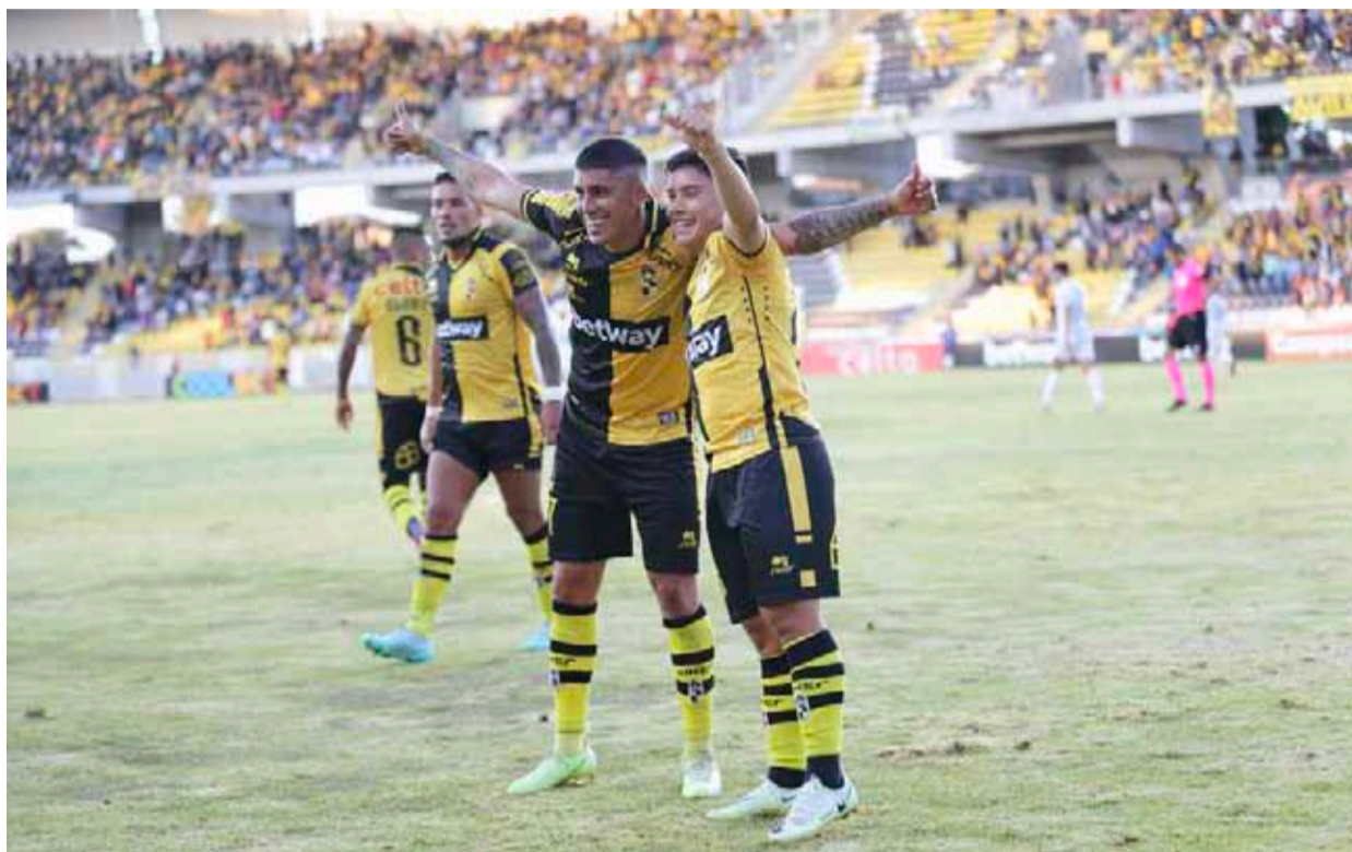
Farfán y Coquimbo Unido vuelven a casa después de cinco compromisos consecutivos actuando de visitante. El atacante en tanto, retomará la jineteta de capitán.

Para Díaz se trata de un partido donde todos deben estar bien, aplicados, despiertos y concentrados, ya que la U, es un equipo cuyo funcionamiento se ha fortalecido en las últimas fechas. "La U tiene un funcionamiento sólido, cuenta con delanteros hábiles en punta, son