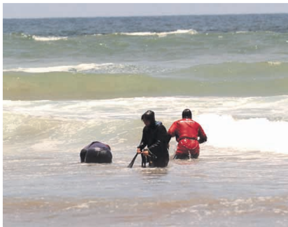
Un acto ya repetido es el robo de machas en la zona.

Mil unidades fueron recuperadas, equivalentes a 570 kilos, aproximadamente.