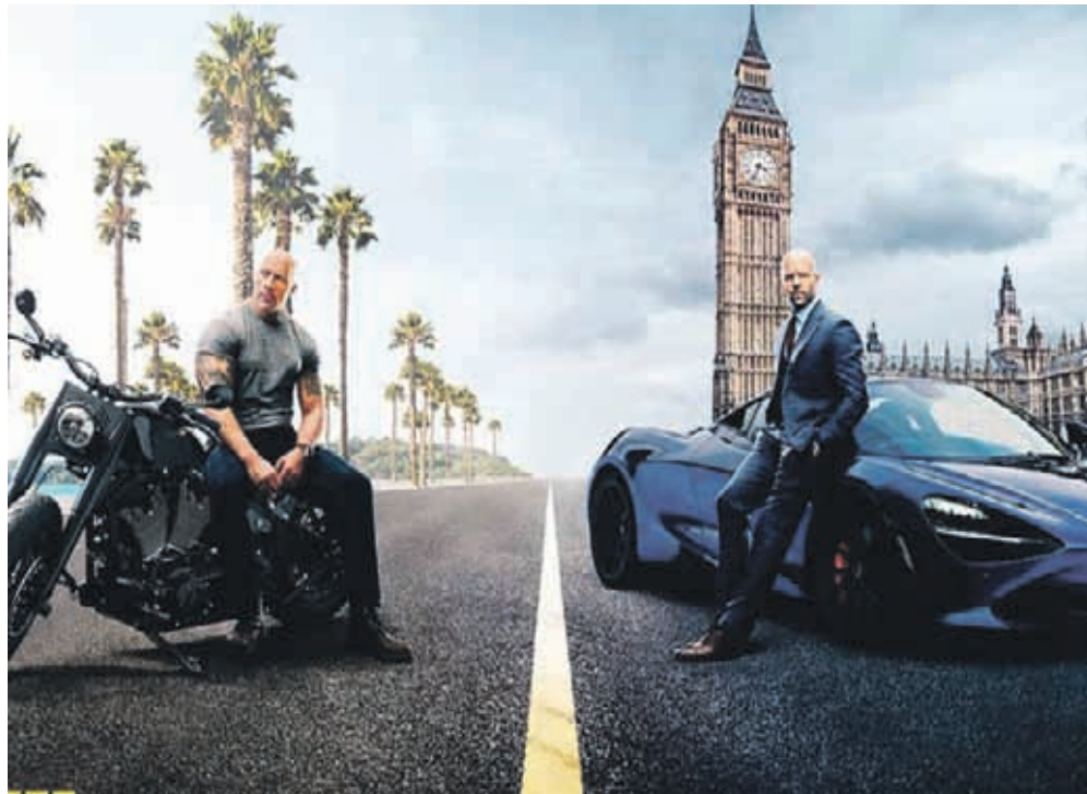
En “Hobbs & Shaw”, los intérpretes Dwayne Johnson y Jason Statham se enfrentan a Idris Elba bajo la dirección de David Leitch.

Así, la primera cinta derivada de la famosa saga de acción y automóviles se estrenó en las grandes pantallas liderando el mercado, pero con una recaudación menor que la de las películas de la trama original.