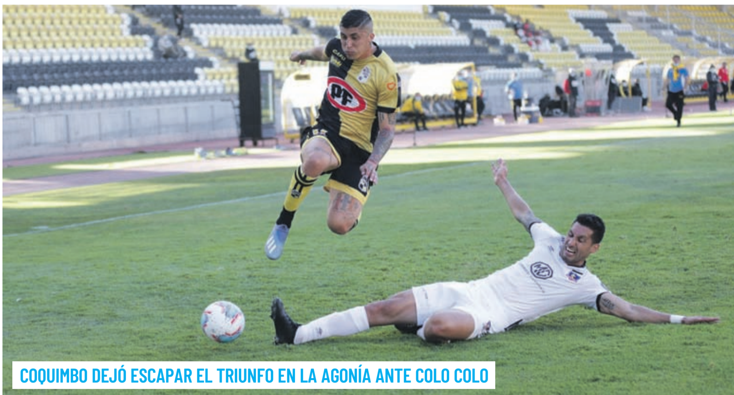
COQUIMBO DEJÓ ESCAPAR EL TRIUNFO EN LA AGONÍA ANTE COLO COLO

Los piratas estaban amargando el debut del técnico albo, Gustavo Quinteros, pero tras una jugada detenida, en el minuto 95', el juvenil Luciano Arriagada logró anotar el empate a 2 definitivo.