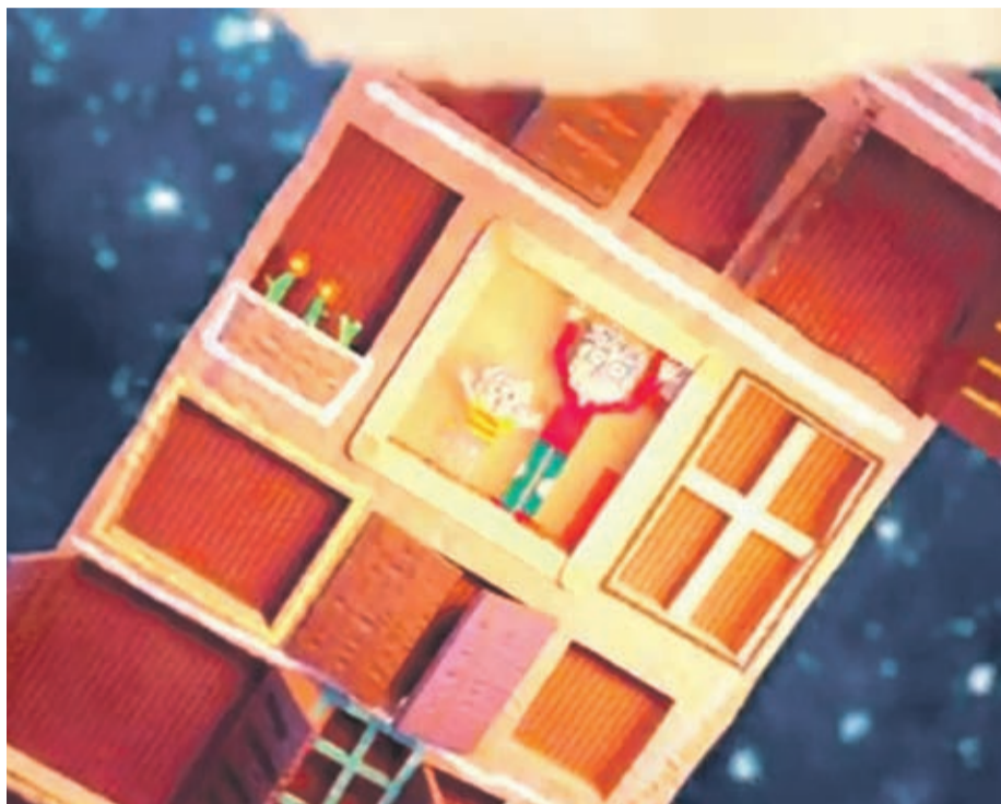
SUBSECRETARÍA DE LA NIÑEZ

La iniciativa busca promover y difundir un modelo de crianza basado en los vínculos de cercanía, afectividad y cuidado responsable. La producción gráfica estuvo a cargo de la productora audiovisual Punkrobot, ganadores del Oscar con "Historia de un oso".