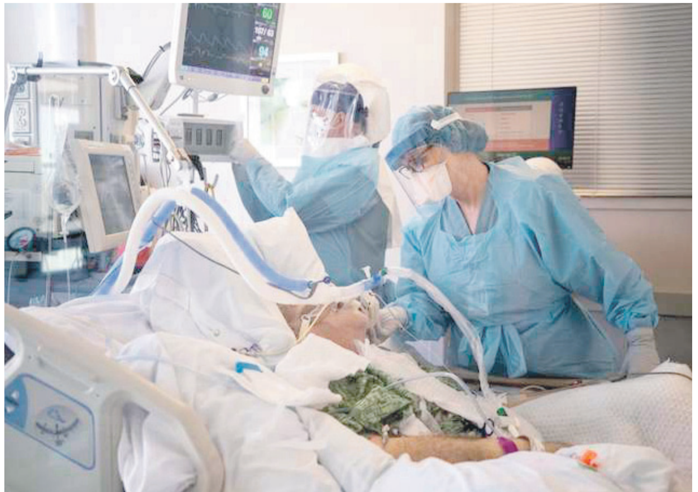
Sin la certeza de que podrá recibir las cenizas de su madre en Mendoza, la despedida familiar se mantiene en expectativa