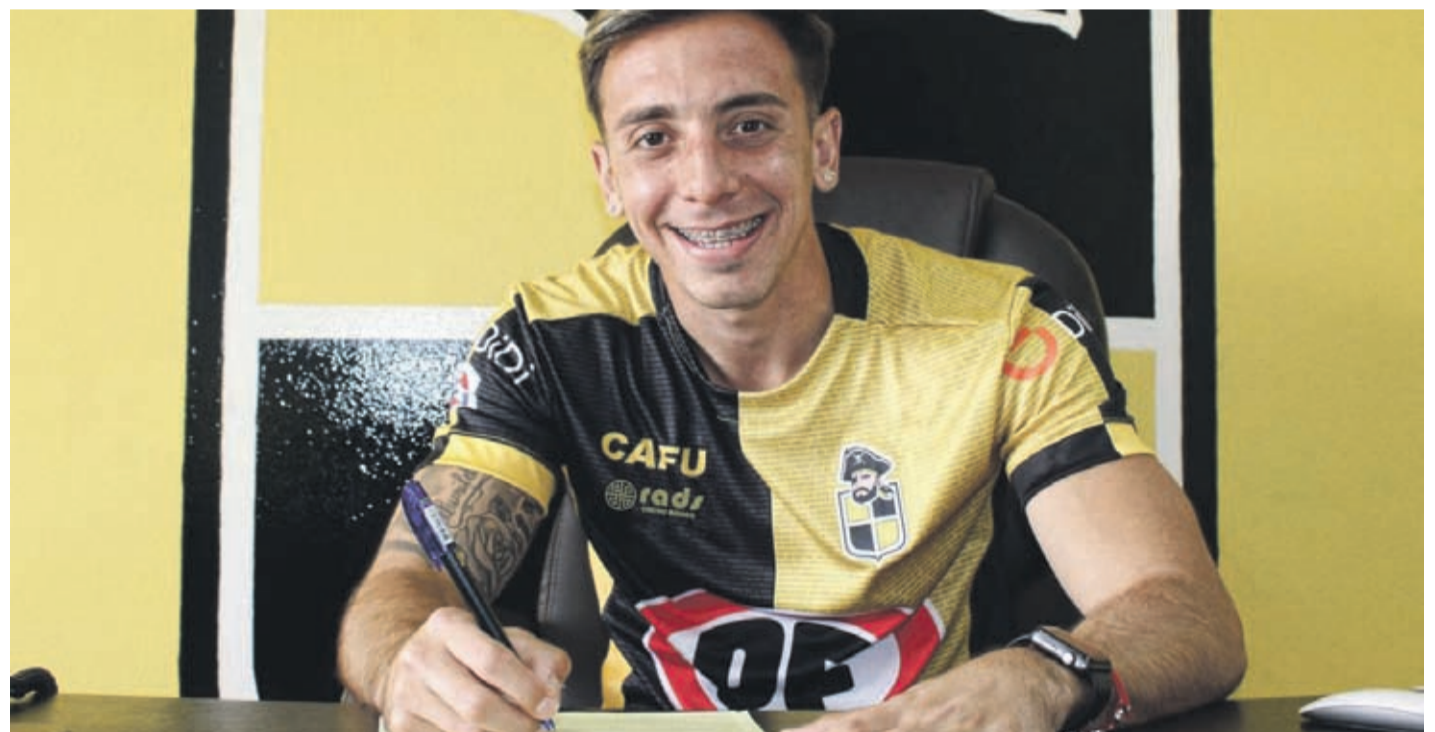
COMUNICACIONES COQUIMBO UNIDO