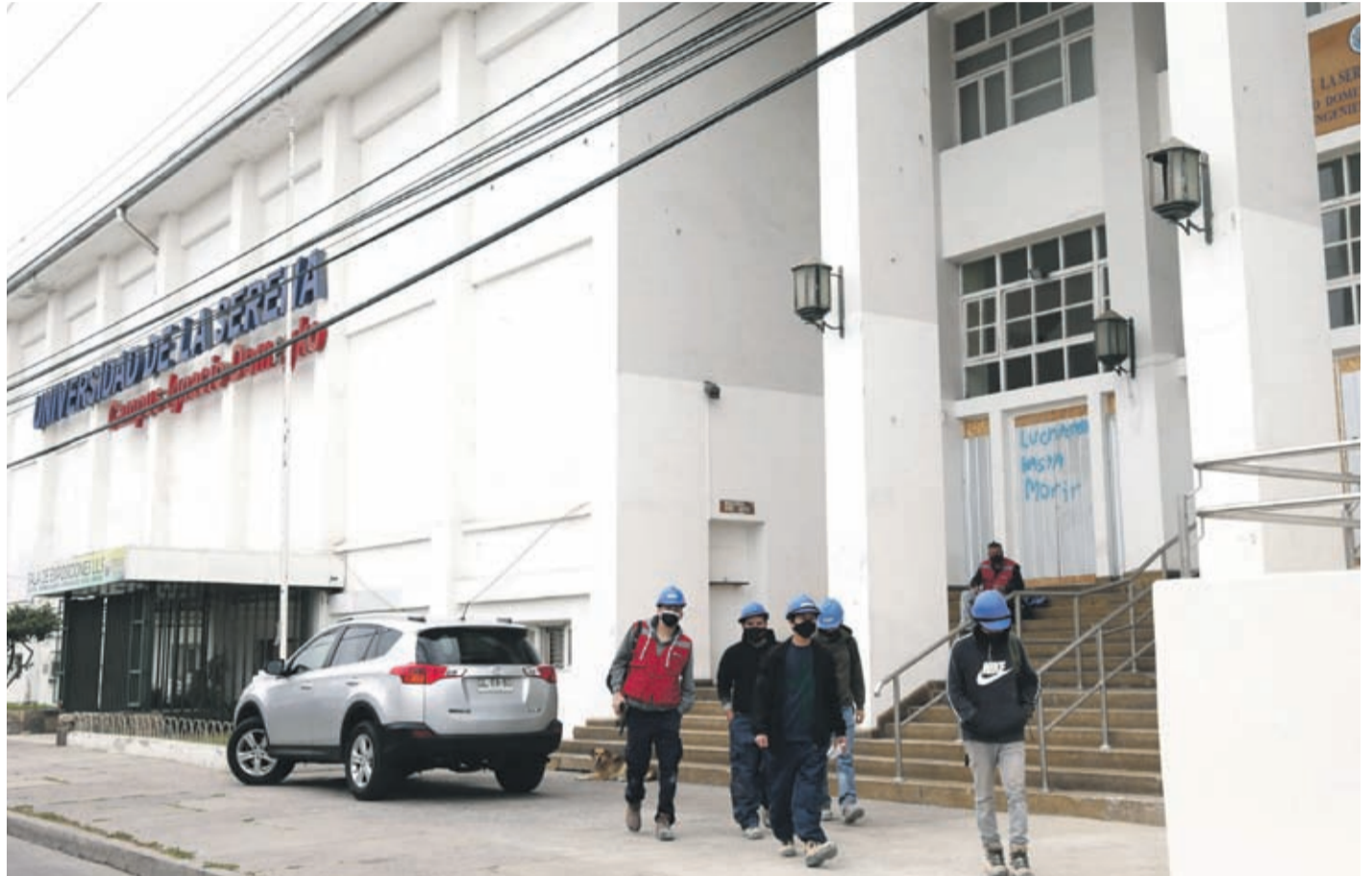
La Universidad de La Serena evalúa la modalidad híbrida para el primer semestre 2021.