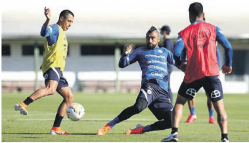
La selección necesita de un triunfo para no enredarse en la clasificación y así silenciar las críticas.

Será el segundo partido que disputará en calidad de local, ya que en la cuarta fecha deberá trasladar-