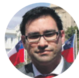
CARLOS LILLO SEREMI DE ECONOMÍA

“Cabe destacar que ya llevamos más de 3 mil beneficiados, lo que no es poco, pero debido a la situación que estamos enfrentando de pandemia siempre los recursos se hacen pocos y cada vez las exigencias son mayores y también las brechas que se van generando”.