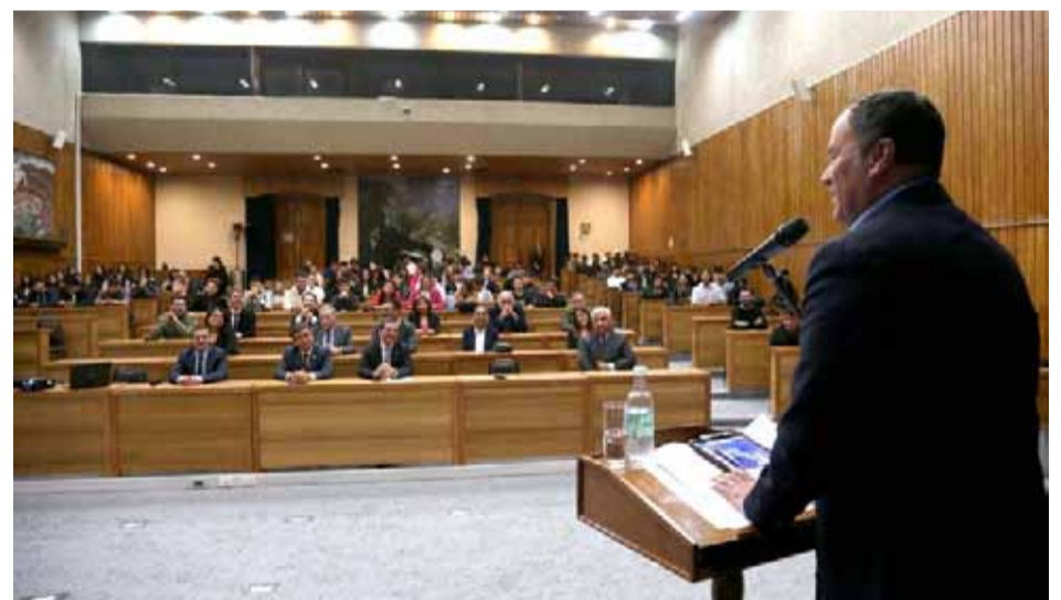
Decenas de estudiantes asistieron a la actividad llevada a cabo en las dependencias del gobierno regional de Coquimbo.

DIRECTOR DE LA CARRERA DE INGENIERÍA COMERCIAL DE LA U. CENTRAL