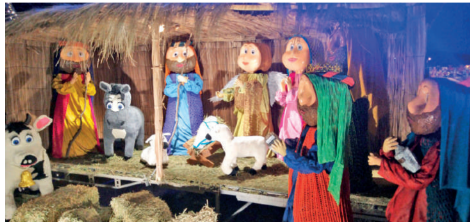
Un hermoso pesebre le regalaron a la comunidad los artistas de la agrupación Alarte.

Para esta bella iniciativa, la agrupación artística generó vínculos con la Asociación de Contratistas y Minera Teck.