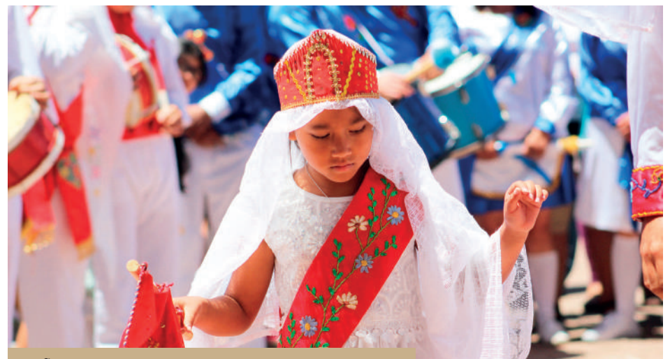
NIÑA INTEGRANTE BAILE TURBANTE LA SERENA