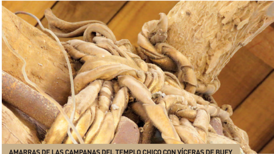
AMARRAS DE LAS CAMPANAS DEL TEMPLO CHICO CON VÍCERAS DE BUEY