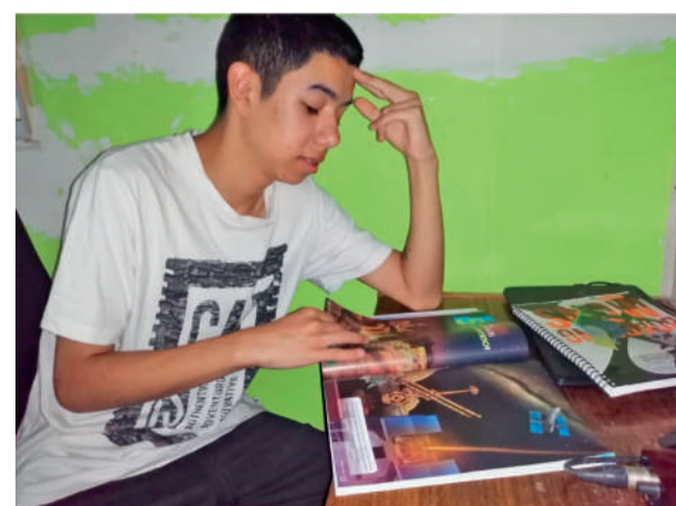
El trompetista en uno de sus pocos ratos de descanso.

Muchas veces los sueños chocan con una cruda realidad y no es otra que la falta de recursos, pero este joven andacollino dice que ha tenido suerte, puesto que ha recibido ayuda de Teck Carmen de Andacollo. "Eso es impagable. Me hicieron un aporte en dinero y el primer proyecto lo invertí en una trompeta, y el segundo aporte se convirtió en un estudio: micrófono y audifono. Un tremendo impulso para continuar cultivando mi pasión".