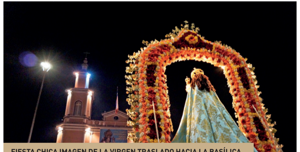
FIESTA CHICA IMAGEN DE LA VIRGEN TRASLADO HACIA LA BASÍLICA