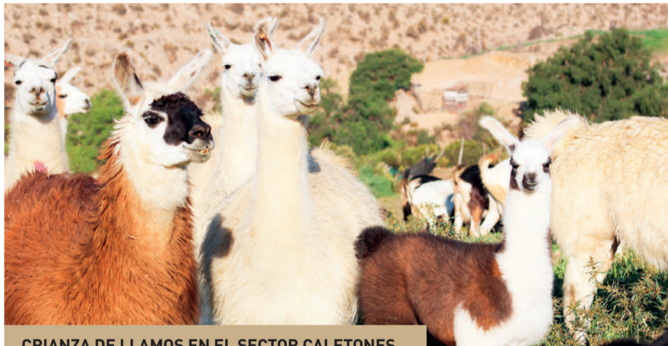
CRianza DE LLAMOS EN EL SECTOR CALETONES