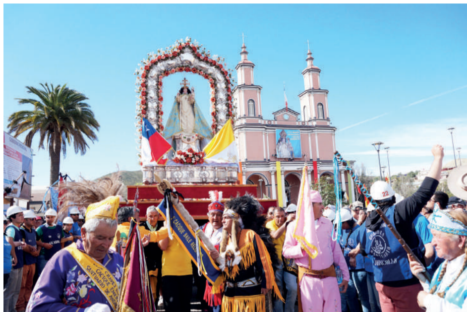
Fiesta Religiosa de Nuestra Señora del Rosario, octubre 2018.