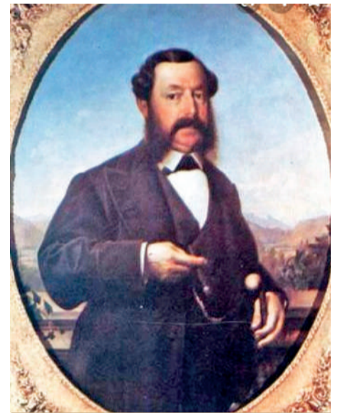
José Tomás de Urmeneta vivió en la región y amasó una gran fortuna producto del trabajo en la minería.

Según la historia, este hombre de fortuna vivió al pie del cerro con su familia y todas las tardes salía montado en un burro a recorrer en busca del filón soñado. Se dice que los vecinos lo llamaron “El loco del burro”. Esos recorridos dieron re-