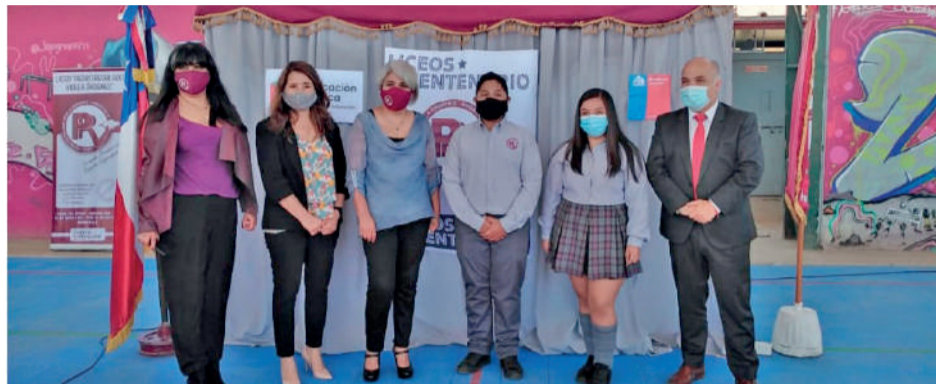
A pesar de las complejidades del 2020, el liceo concluyó el año con excelentes noticias.

Fue seleccionado como Liceo Bicentenario y obtuvo Sello de Calidad del Consejo de Competencia Mineras.