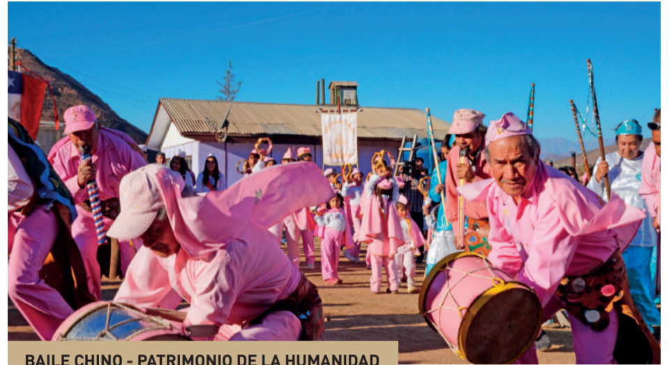
BAILE CHINO - PATRIMONIO DE LA HUMANIDAD