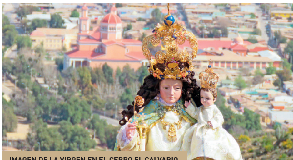
IMAGEN DE LA VIRGEN EN EL CERRO EL CALVARIO