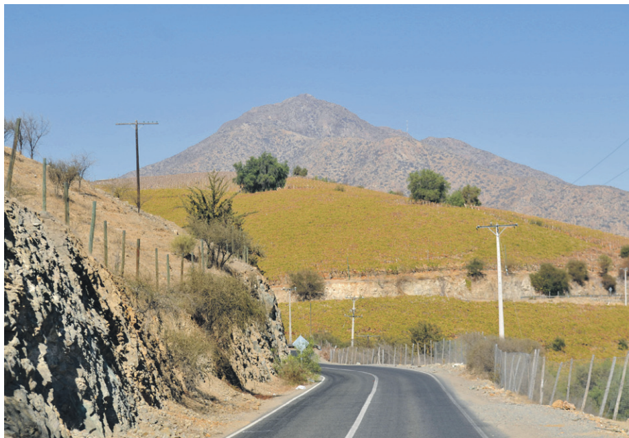
En sectores como Vicuña o Pisco Elqui, la temperatura podría superar los 30 grados durante el fin de semana.

Sin bien, el evento no será tan intenso como en la zona central, autoridades llamaron al autocuidado y a prevenir los dañinos efectos del Sol en las personas. Por otro lado, desde el SENAPRED recalcaron en que está vigente una alerta temprana preventiva por marejadas anormales en todo el borde costero.