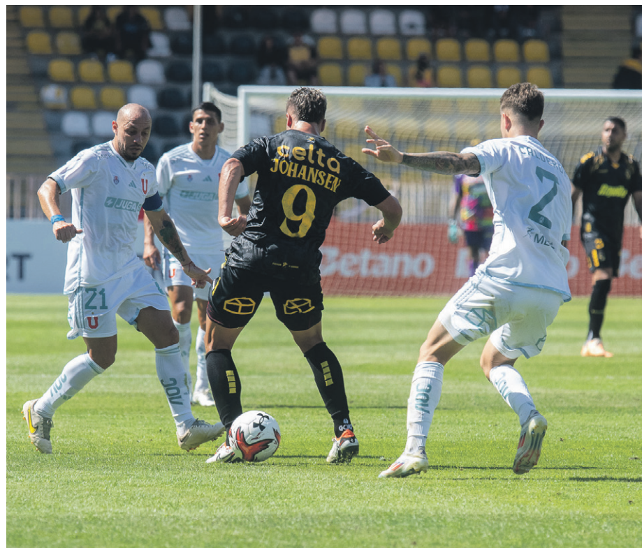
Los azules dejaron una pobre imagen en su primer compromiso ante el cuadro aurinegro, por lo que hoy irán por su primer triunfo.

En concreto, el miércoles 8 de enero, las autoridades regionales sostuvieron