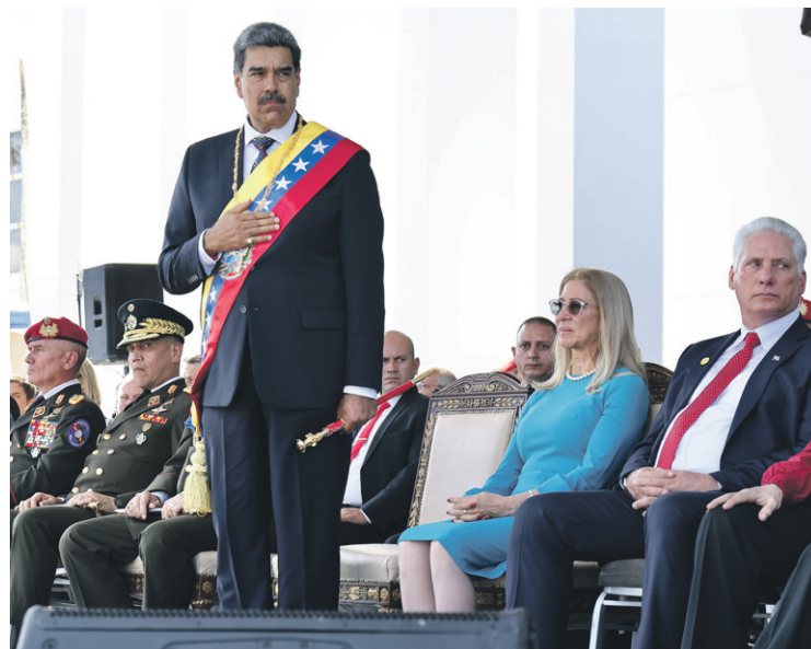
Imagen de Nicolás Maduro, su esposa Cilia Flores y el presidente de Cuba, Miguel Díaz-Canel, durante el acto de ayer viernes en Caracas.

“Hemos logrado lo que sabíamos que íbamos a lograr”, agregó Maduro, que asumió el poder en 2013, primero