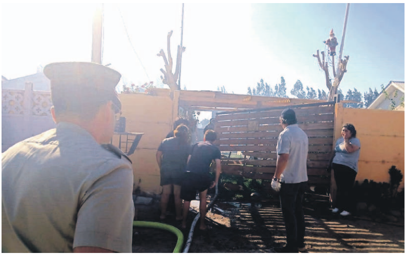
Una víctima fatal y dos casas con graves daños estructurales fue el resultado de un incendio en la localidad de Gabriela Mistral.

Ante la emergencia, se activó un rápido y coordinado operativo de respuesta, con cuatro carros de Bomberos, los que se trasladaron inmediatamente al lugar, junto con efectivos de Carabineros y personal del Servicio de Atención Médica de Urgencia (SAMU).