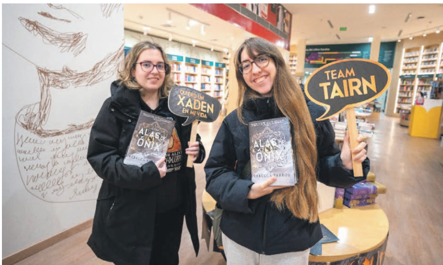
Dos jóvenes muestran su alegría tras adquirir el último libro de la estadounidense Rebecca Yarros, "Alas de Onix".

San Valentín se celebra todo el año gracias a una próspera literatura romántica juvenil perfectamente etiquetada para su comentario en redes sociales, en especial en TikTok, en categorías como "romantasy" (amor en reinos fantásticos), "hea" (final feliz), "sport romance" (romance con deportista) o "solo había una cama".