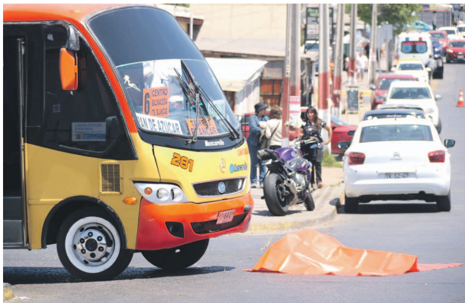
Una mujer de 57 años fue atropellada al mediodía de este lunes por un microbús de la empresa Lincosur.

La víctima, de 57 años, murió en el lugar tras ser impactada por una máquina de la empresa Lincosur en la intersección de calles Argentina con Canadá. Según las primeras indagaciones, el conductor no habría respetado una señal de Pare, siendo posteriormente, detenido.