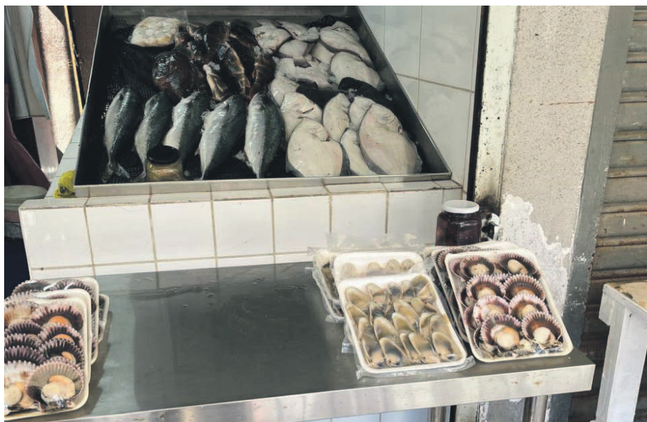
EL DÍA La autoridad sanitaria advirtió a quienes venden pescados y mariscos ser rigurosos a la hora de mantener la cadena de frío, asegurándose que los productos se expendan a una temperatura no mayor a los 5°C.

incremento del consumo de pescados y mariscos, sumado a las altas temperaturas que hemos tenido en la región desde la semana pasada a la fecha, por lo que el llamado a la población es a ser muy cuidadosos a la hora de consumir productos del mar”, indicó el seremi de Salud (s), Tomás Balaguer. Estos nuevos casos se suman así a los más de 70 que se habían registrado durante el mes de enero.