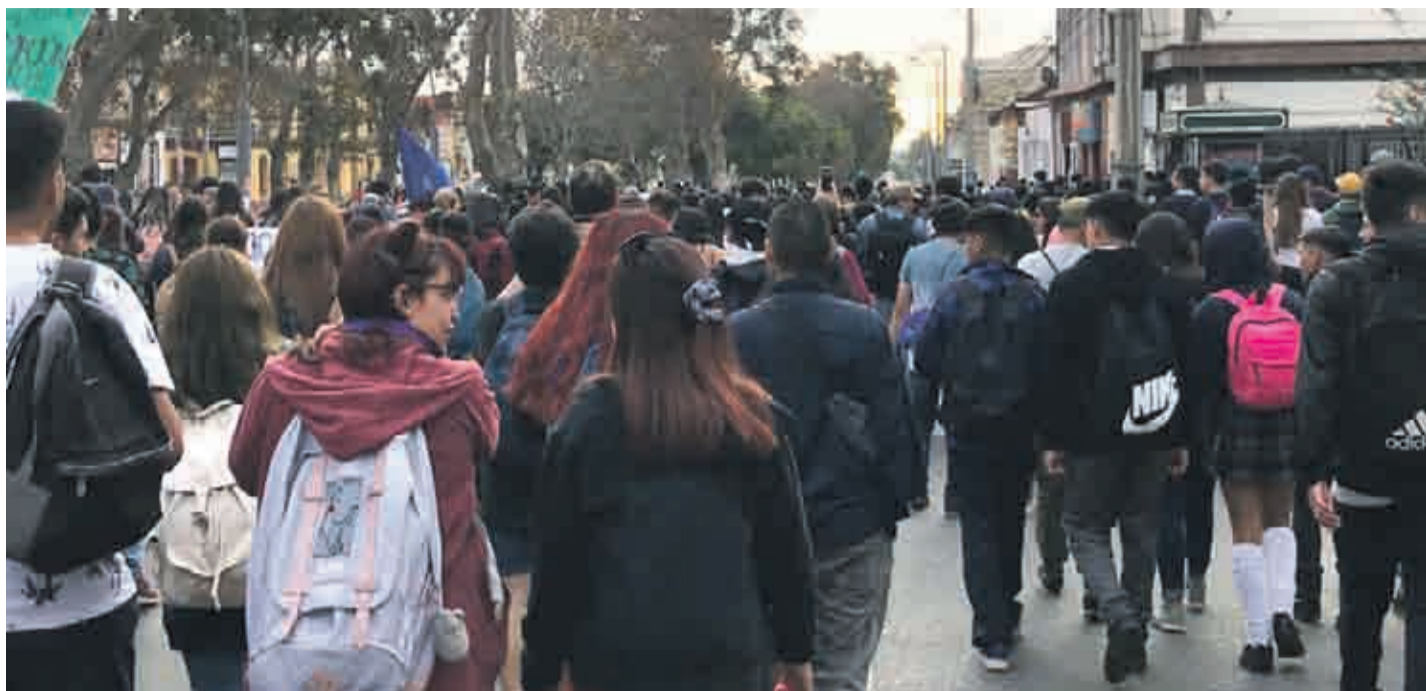
Manifestantes avanzando por la Avenida Fransico de Aguirre hasta la Ruta 5 en La Serena durante la tarde de este miércoles.