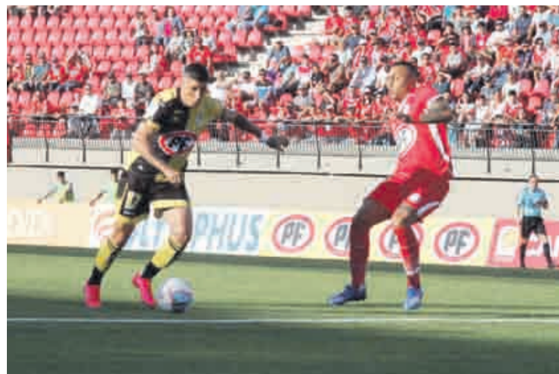
La derrota ante los cementeros no agradó a los hinchas porteños.

Incluso, el reportero acusa que el DT lo trató de "mala leche".