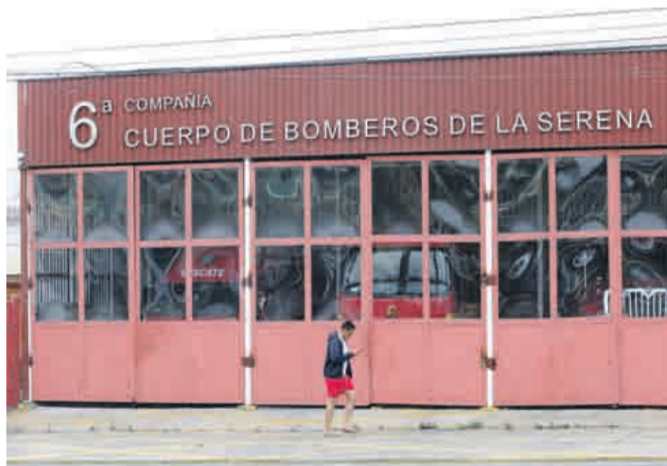
Es en la Sexta Compañía de Bomberos donde se han registrado la mayor cantidad de denuncias formales en el marco de los protocolos establecidos por la institución.

El investigador criminalista Jaime Brieba fue contactado de manera anónima por mujeres integrantes de la institución, las que, presuntamente, habrían sufrido abusos por parte del Superintendente de La Serena Ángelo Pizarro. Brieba tendría nuevos antecedentes que sostendrían la acción legal. Por su parte, la autoridad de los voluntarios insiste en su inocencia y en que ha sido él quien ha activado los protocolos cuando han existido denuncias. El fuego cruzado parece no apagarse.