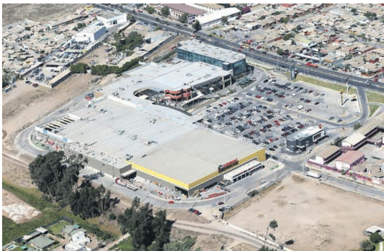
Paseo Balmaceda ha enfrentado una serie de traspies a lo largo de sus operaciones, iniciadas hace casi dos años.

En efecto, según ha trascendido, el proyecto tiene por objetivo generar una vía preferencial