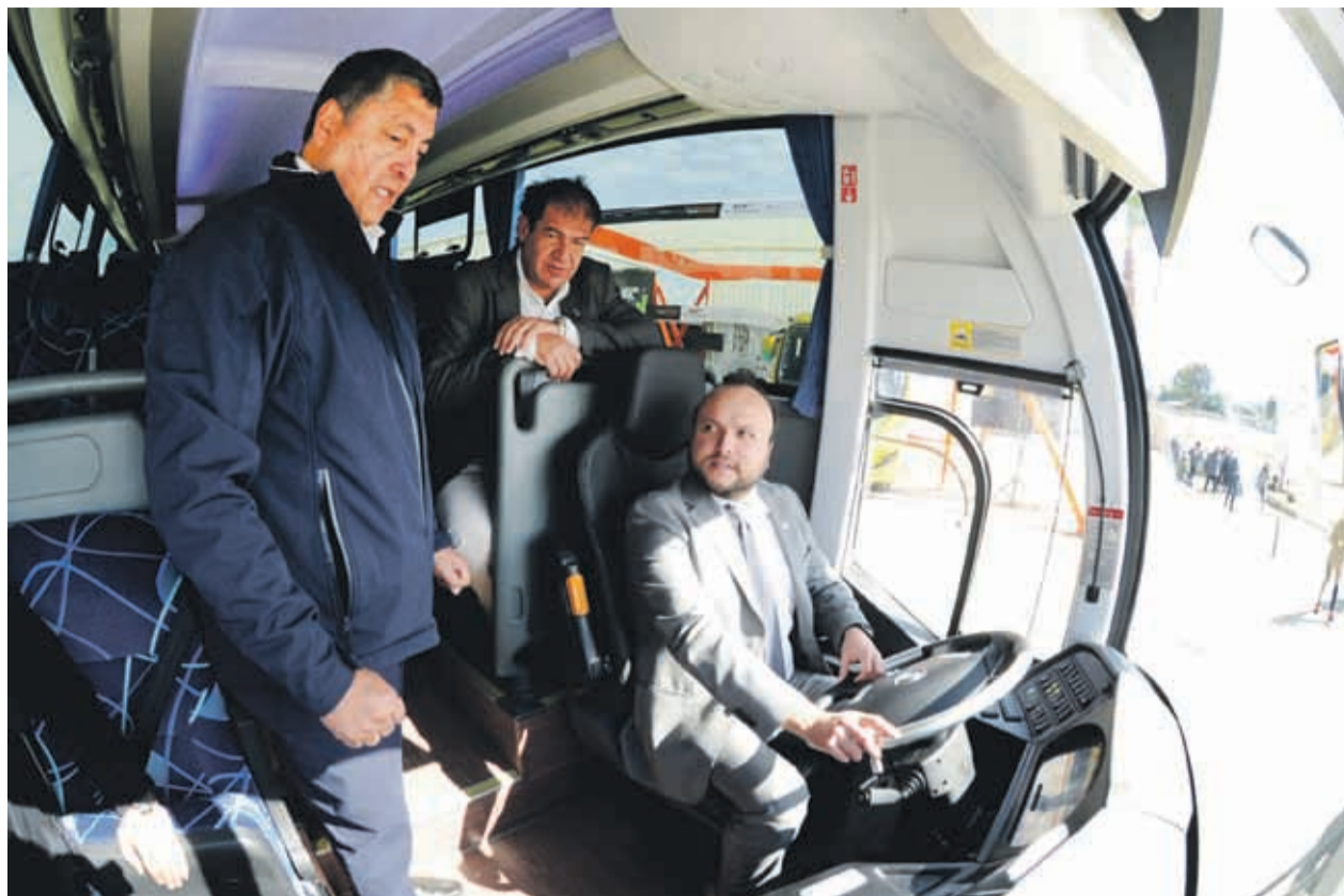
Desde TANDEM aseguraron que el uso de locomoción pública eléctrica “podría ser una realidad a corto plazo”.

buses eléctricos en funcionamiento a lo largo de Chile tiene la empresa TANDEM