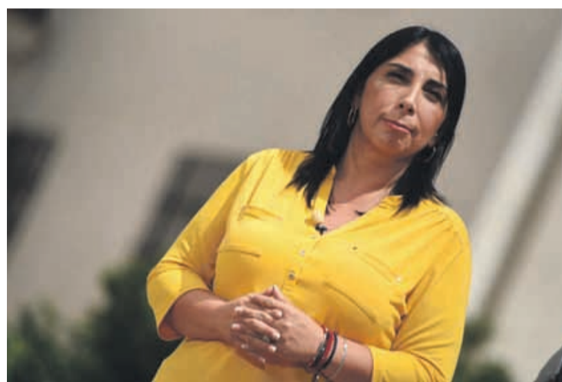
La vocera de Gobierno asumió públicamente las responsabilidades por el error desde La Moneda.

La vocera de Gobierno aseguró que el presidente no tenía conocimiento de las instrucciones del documento y tomó la responsabilidad por los hechos.