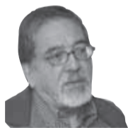
ABRAHAM SANTIBÁÑEZ SECRETARIO GENERAL DEL INSTITUTO DE CHILE. MIEMBRO DE LA ACADEMIA CHILENA DE LA LENGUA. PREMIO NACIONAL DE PERIODISMO 2015

El Consejo de Ética de la Federación de Medios -del cual fui miembro en el pasado- dio a conocer una resolución frente a las denuncias recibidas por eventuales faltas a la ética en la cobertura de la pandemia.