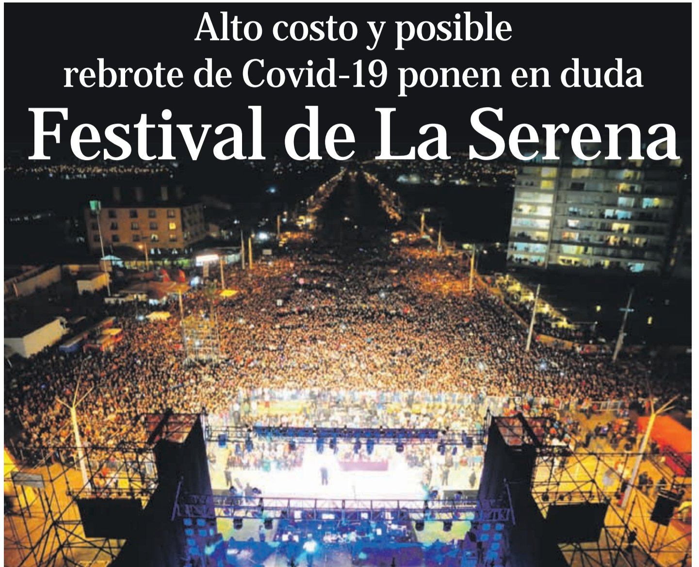
En diciembre pasado el estallido social sepultó el certamen veraniego que estaba programado para el mes de febrero 2020.