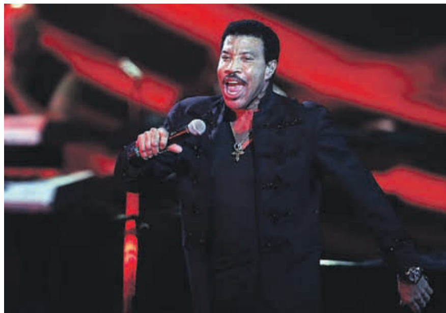
Lionel Richie participará como productor en el proyecto.