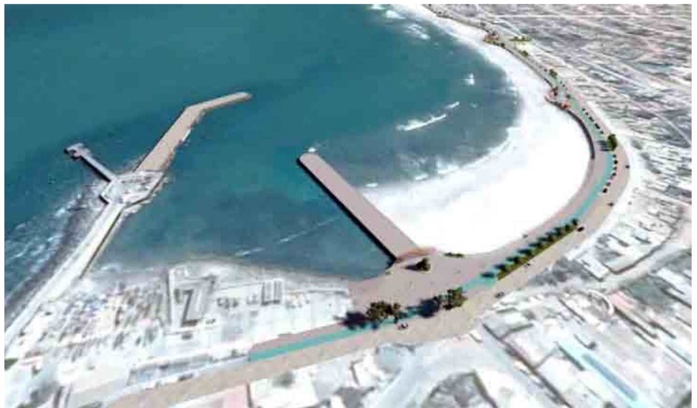
Un completo cambio de imagen es la que tendrá la costanera de Los Vilos.

Así, el proyecto, que parte desde el diagnóstico de que la playa presenta indicios de erosión costera que se acentúa con las marejadas y tormentas, se basará en tres ejes principales: defensa costera, respetar y habilitar el hábitat para la flora y fauna silvestre, y generar zonas de esparcimiento y uso social.