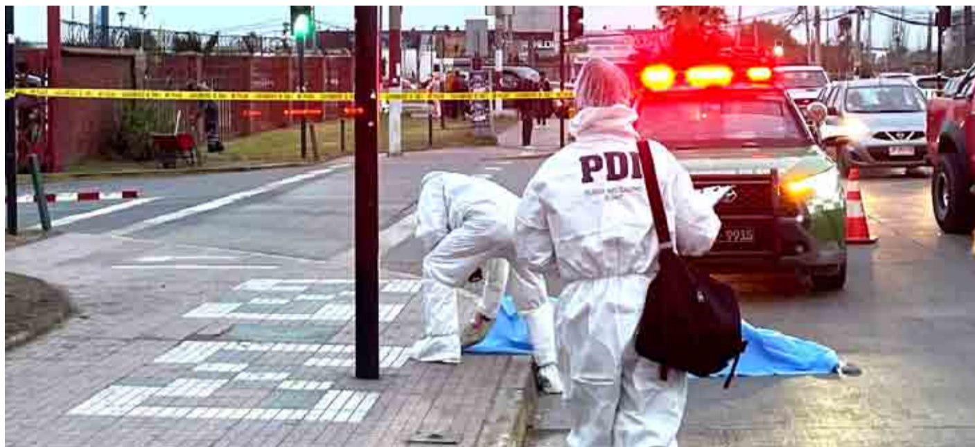
El último homicidio ocurrido en la zona correspondió al de un hombre apuñalado frente al terminal de buses de La Serena. LAUTARO CARMONA

Días después, el viernes 31 se registró una brutal golpiza en Ovalle, aunque de acuerdo a las informaciones del caso, por una discusión a raíz de un choque entre dos conductores. Uno de los hombres involucrados agredió al otro con golpes de pies y puños,