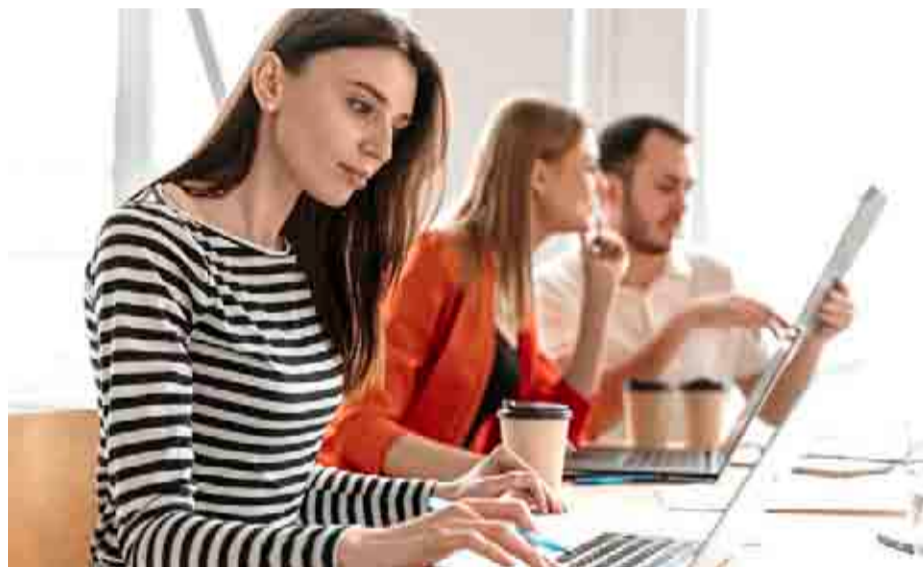
Imagen de tres trabajadores en un ambiente laboral agradable y dinámico.

En las empresas y organizaciones trabajan siete tipos distintos de personas: desde aquellas con una actitud positiva ante los nuevos retos que se les plantean hasta aquellas que de entrada se resisten a probar las propuestas que parten de sus superiores jerárquicos. ¿En cuál de esos perfiles laborales se siente más reflejado?