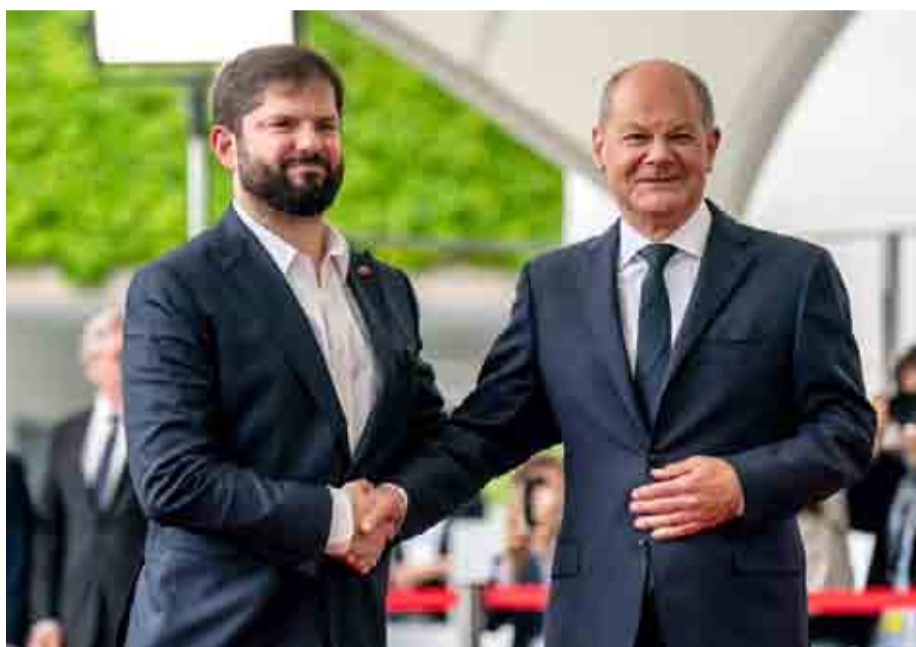
Imagen del saludo entre el Presidente Gabriel Boric y el canciller alemán, Olaf Scholz.

Tras la entrada en vigor del acuerdo comercial UE-Chile, el comercio entre Alemania y Chile se ha intensificado