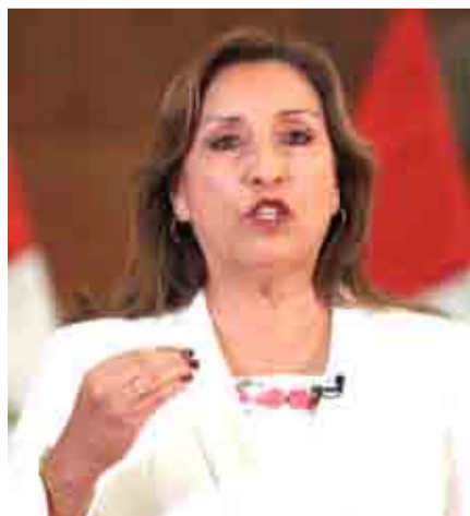
Este lunes, la polémica ley fue promulgada por la presidenta de ese país, Dina Boluarte.

En el artículo referido a las medidas aplicables a las personas jurídicas establece que a las organizaciones políticas sólo se aplica el régimen