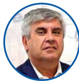
Rafael Vera ALCALDE DE VICUÑA