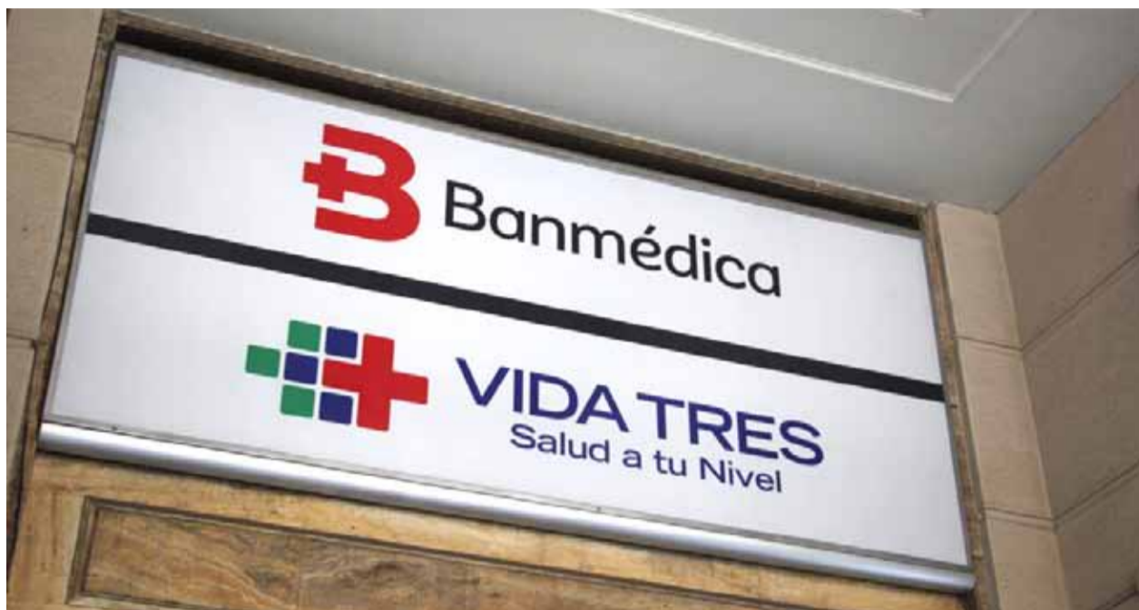
Banmédica y Vida Tres son dos isapres que pertenecen a un mismo holding: Empresas Banmédica.

VidaTres y Banmédica, ambas pertenecientes a un mismo holding, decidieron suspender sus ventas de planes hasta nuevo aviso, específicamente, hasta que se tenga claridad en cómo se procederá con el nuevo fallo que emitió la Corte Suprema, esta vez ligado a los cobros de la prima GES.