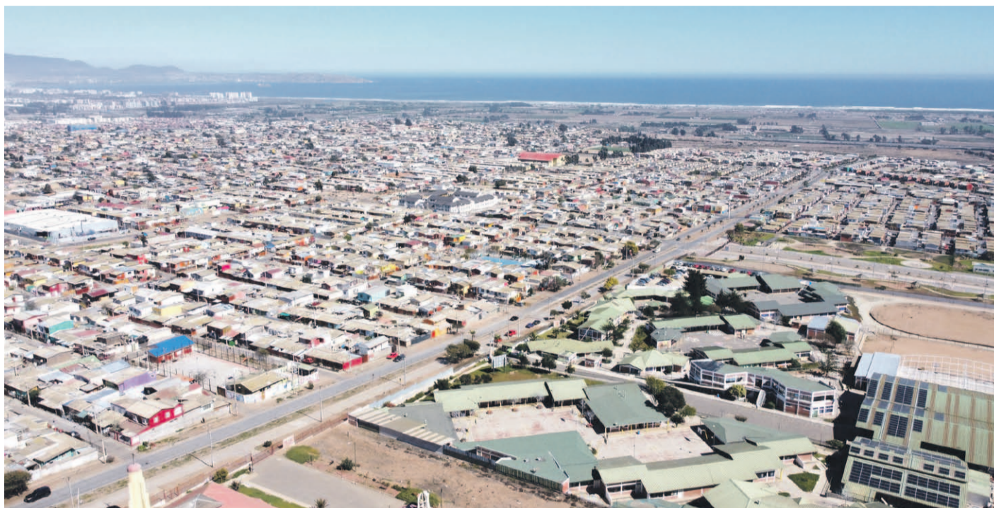
Vecinos de Las Compañías afirman que la actual dotación de carabineros en ese sector no alcanza para cubrir las demandas de la población.

“Hay distintos factores que nosotros se los hemos advertido a las autoridades. Por ejemplo, la dotación es tan poca que los planes cuadrantes tienen que cubrir la parte rural y la parte urbana. Entonces eso hace que las distancias sean muy grandes. Además, cuando ocurre algún incidente o asalto, los carabineros deben ir a constatar lesiones en el hospital y se demoran entre una y dos horas, y teniendo poca dotación quiere decir que una hora es demasiado, así que no se alcanza a atender a la comunidad. Entonces la gente se queja de que Carabineros no llega nunca, pero ignoran en qué proceso están, que tienen que seguir un conducto regular, un protocolo, y no pueden cubrir la demanda de la ciudadanía”, afirmó el dirigente.