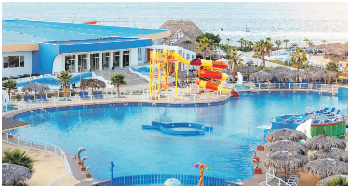
En unos 5 días se tendrán los resultados de las nuevas muestras tomadas a las piscinas del Rosa Agustina Resort y, dependiendo del resultado, se podrá levantar - o no - su clausura.

De hecho, según expresan estas fuentes las relaciones con la auto-