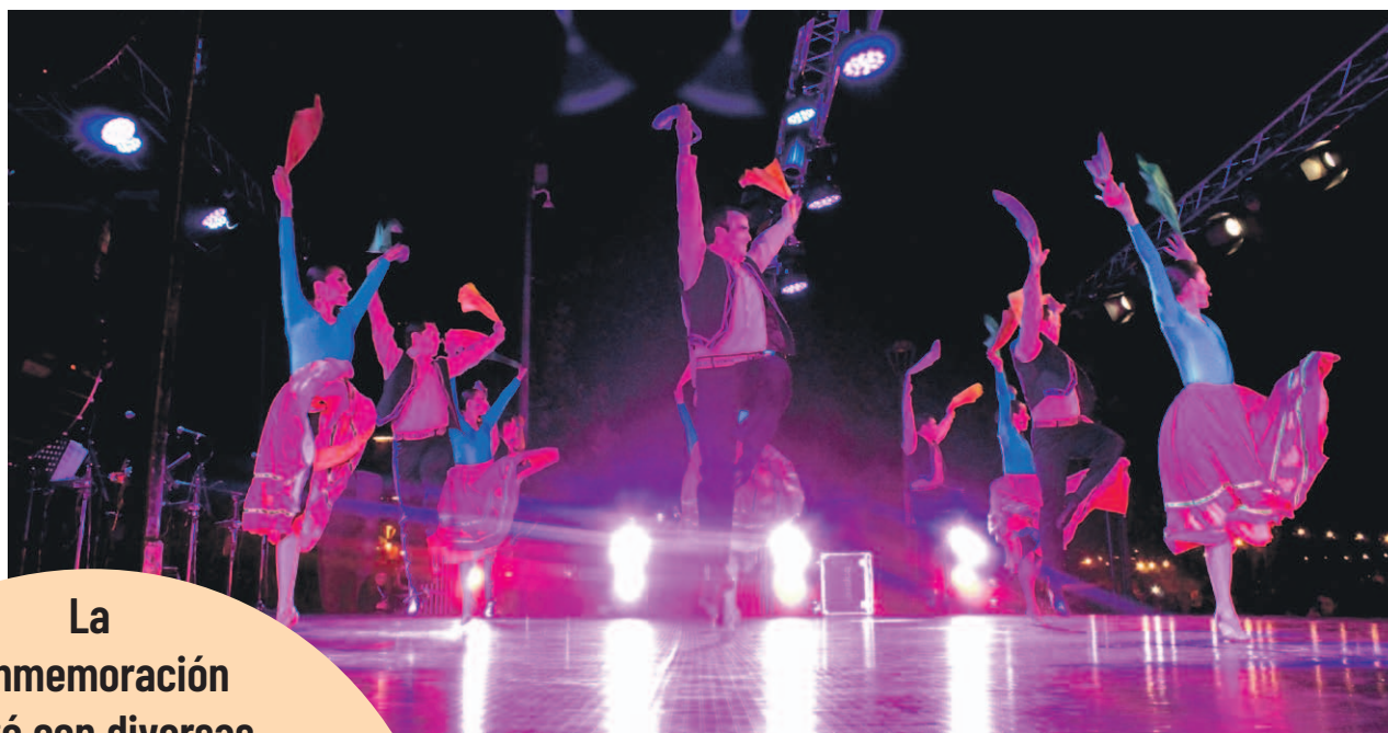
Sobre el escenario, el Ballet Folklórico Nacional interpretó la obra “Gabriela”.