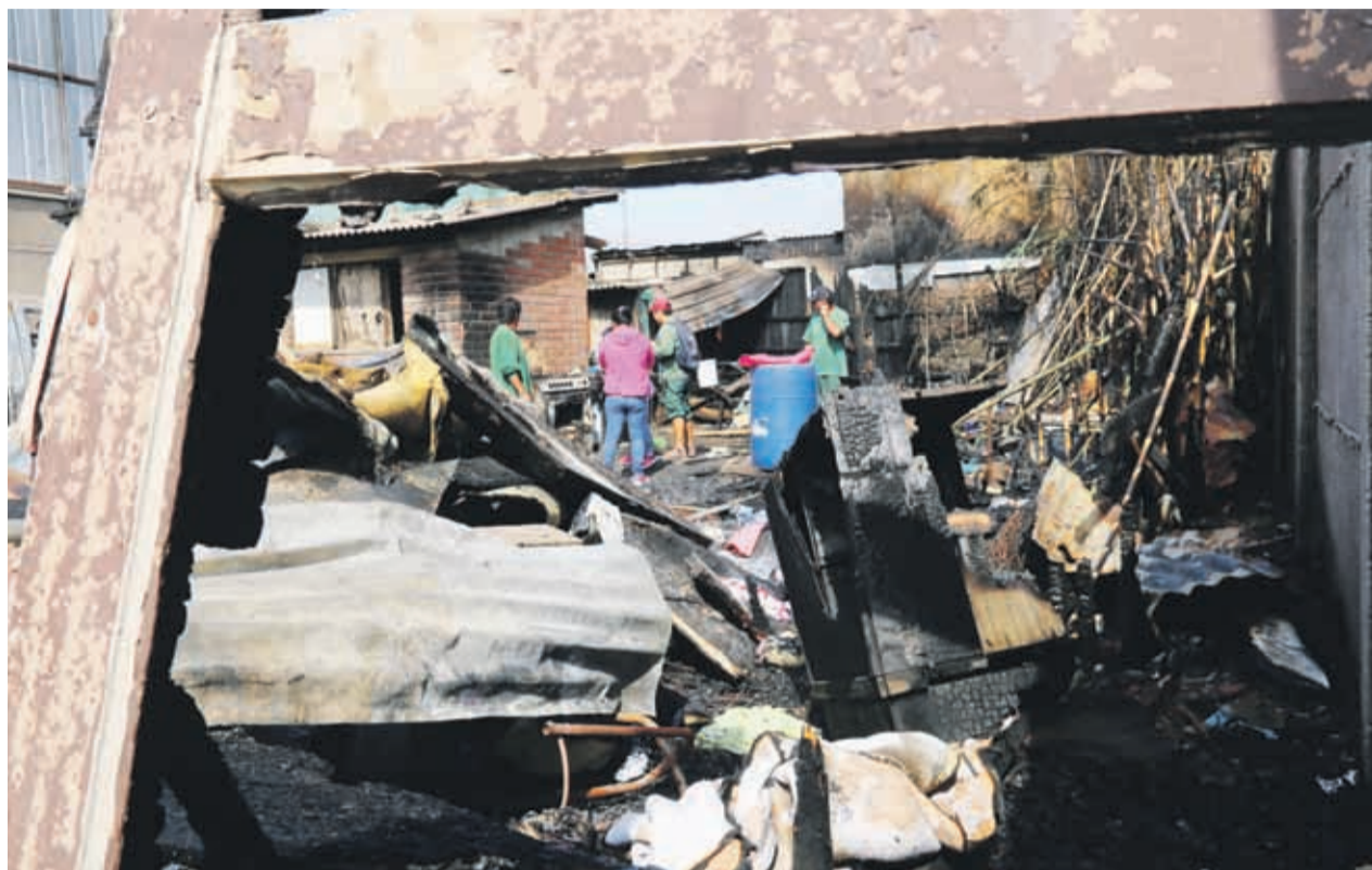
Con la ayuda de vecinos, la familia afectada realiza la limpieza del terreno donde hasta este día domingo, estaba su casa. JENNI CASTILLO

Fue el propio alcalde de Coquimbo, Marcelo Pereira,