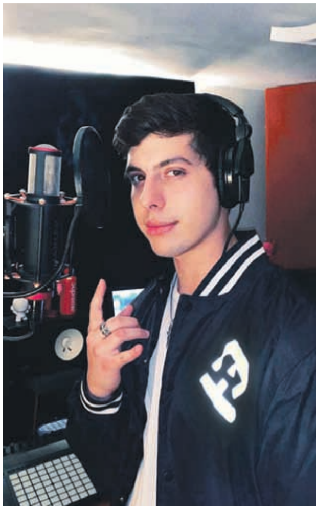
FACEBOOK MATT HUNTER

“Tengo toda la fuerza de seguir haciendo música, hasta el momento tengo cuatro featuring (colabo-