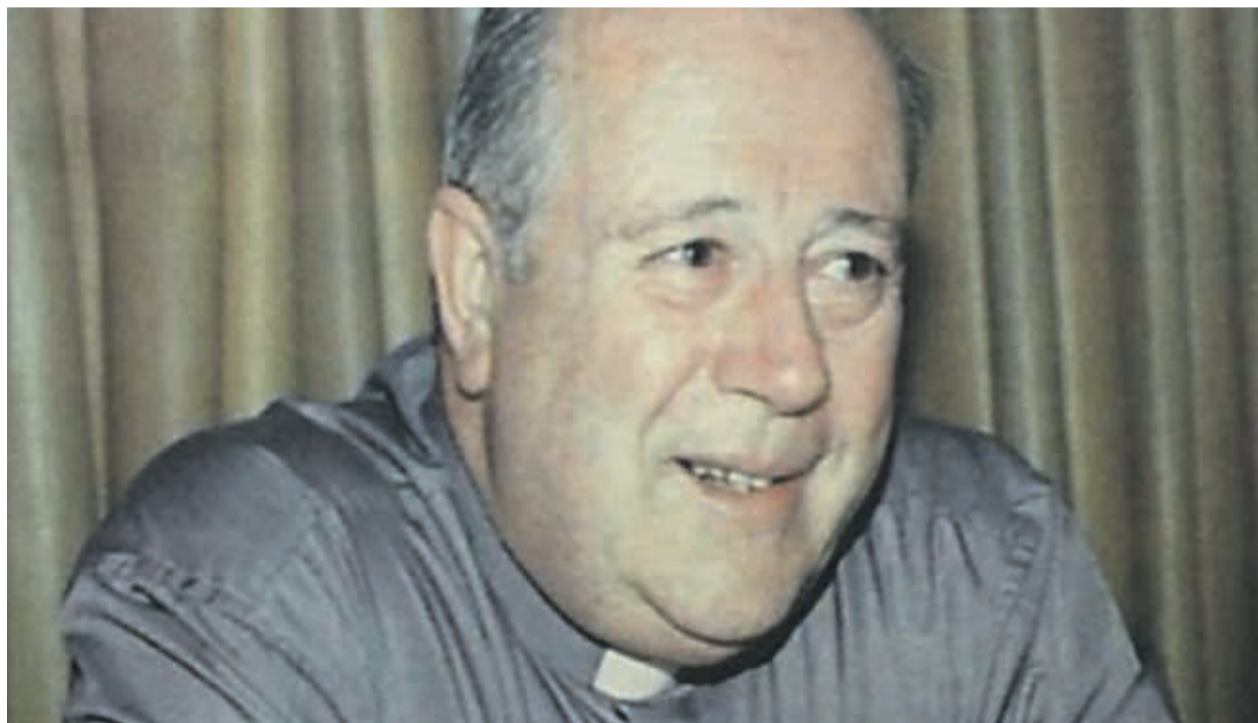
Francisco José Cox desempeñó cargos de alta jerarquía en la iglesia chilena, entre ellos el de Arzobispo en La Serena

"Son sentimientos encontrados porque mi cabeza se vuelve loca. Quiero tocar piso firme, tratando de aceptar todo esto con un corazón humilde, ponerlo en manos de la justicia y