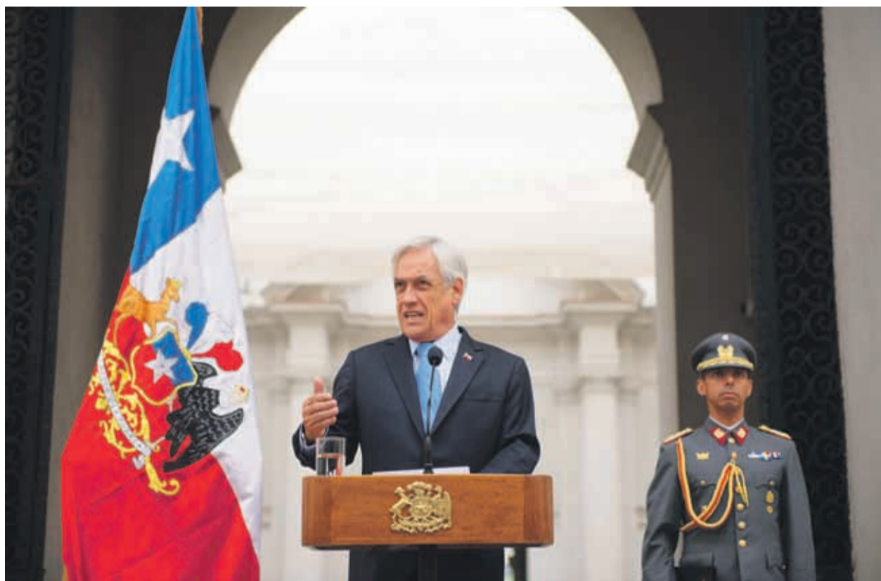
El Mandatario ya ha destinado $128 mil millones para contener las emergencias en el norte, centro y sur del país.

El Jefe de Estado lamentó la muerte de 10 personas en los desastres mencionados y reiteró que la primera prioridad ha sido proteger las vidas de las personas, además de reponer los servicios de utilidad pública como electricidad y agua, instalar albergues y sistemas de alerta temprana. Otro esfuerzo fundamental