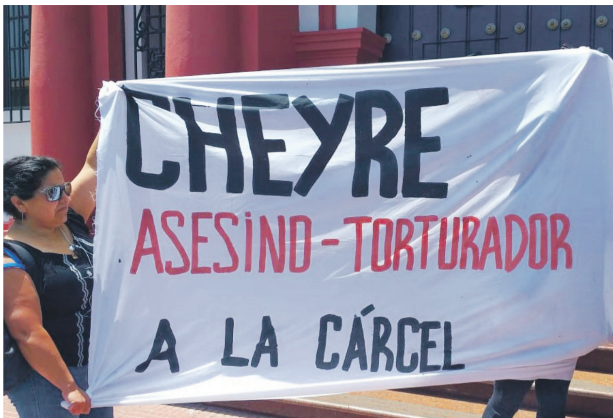
Víctimas y familiares se manifestaron frente a los Tribunales de Justicia en rechazo a la decisión de la Corte.