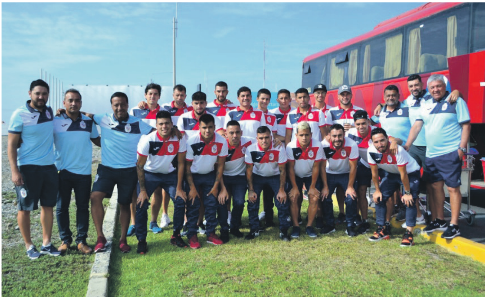
La delegación granate pocos minutos después de su llegada hasta Trujillo, donde vivieron una enriquecedora experiencia y un empate del que se pueden sacar lecciones.