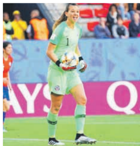
Suecia estableció una enorme diferencia con Chile en el debut mundialista del elenco femenino. Tras el receso por la lluvia, el elenco europeo definió el partido a su favor. Abajo la portera chilena tuvo un buen desempeño pese a los goles al cierre del partido.