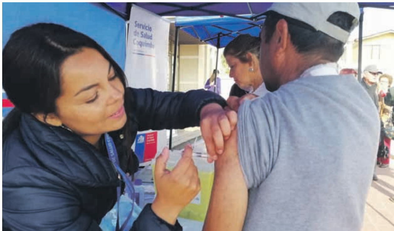
Con el plan de invierno los horarios de los SAPU se extenderán hasta las 23:00 horas.

Según cifras aportadas por la Seremía de Salud, de los virus respiratorios que están