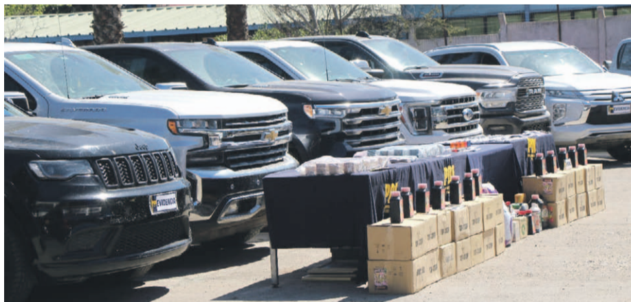
La Policía de Investigaciones logró capturar a dos más de los implicados en el mediático caso de tráfico de drogas.

Con las últimas dos nuevas detenciones llevadas a cabo el día de ayer, once integrantes de la organización criminal han sido detenidos y encarcelados hasta el momento: una mujer bajo arresto domiciliario, dos por personal de la PDI, uno por Carabineros, mientras que otros siete se entregaron voluntariamente. Entre ellos, dos jóvenes profesionales que prestaban asesoría legal y contable al grupo delictual.