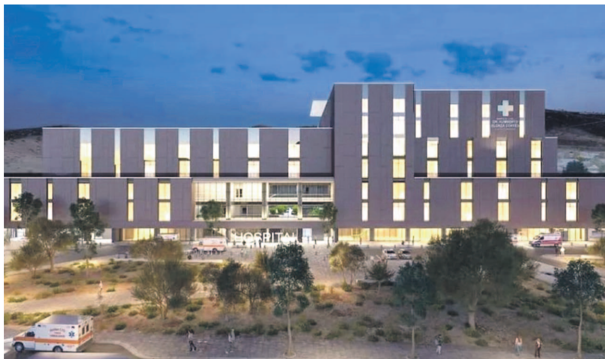
Quando se detectaron las falencias del proyecto, desde el Servicio de Salud indicaron que era un escenario esperado, por lo que procedieron a subsanarlas.

Cabe recordar que cuando se confirmaron dichas falencias, distintos actores, tales como el alcalde de la comuna y parlamentarios, salieron a pedir que dicho proyecto tuviera la misma celeridad que se le dio al nuevo hospital de La Serena, considerando que el recinto de Illapel es largamente esperado por los habitantes de la