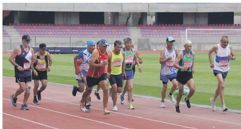
En el Estadio La Portada se desarrollaron las pruebas de pista del Máster Nacional.