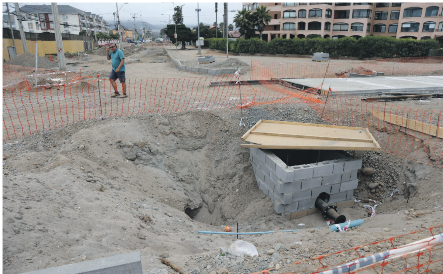
Vecinos del sector acusan abandono de las obras de pavimentación en sector de Cuatro Esquinas y la Avenida del Mar.