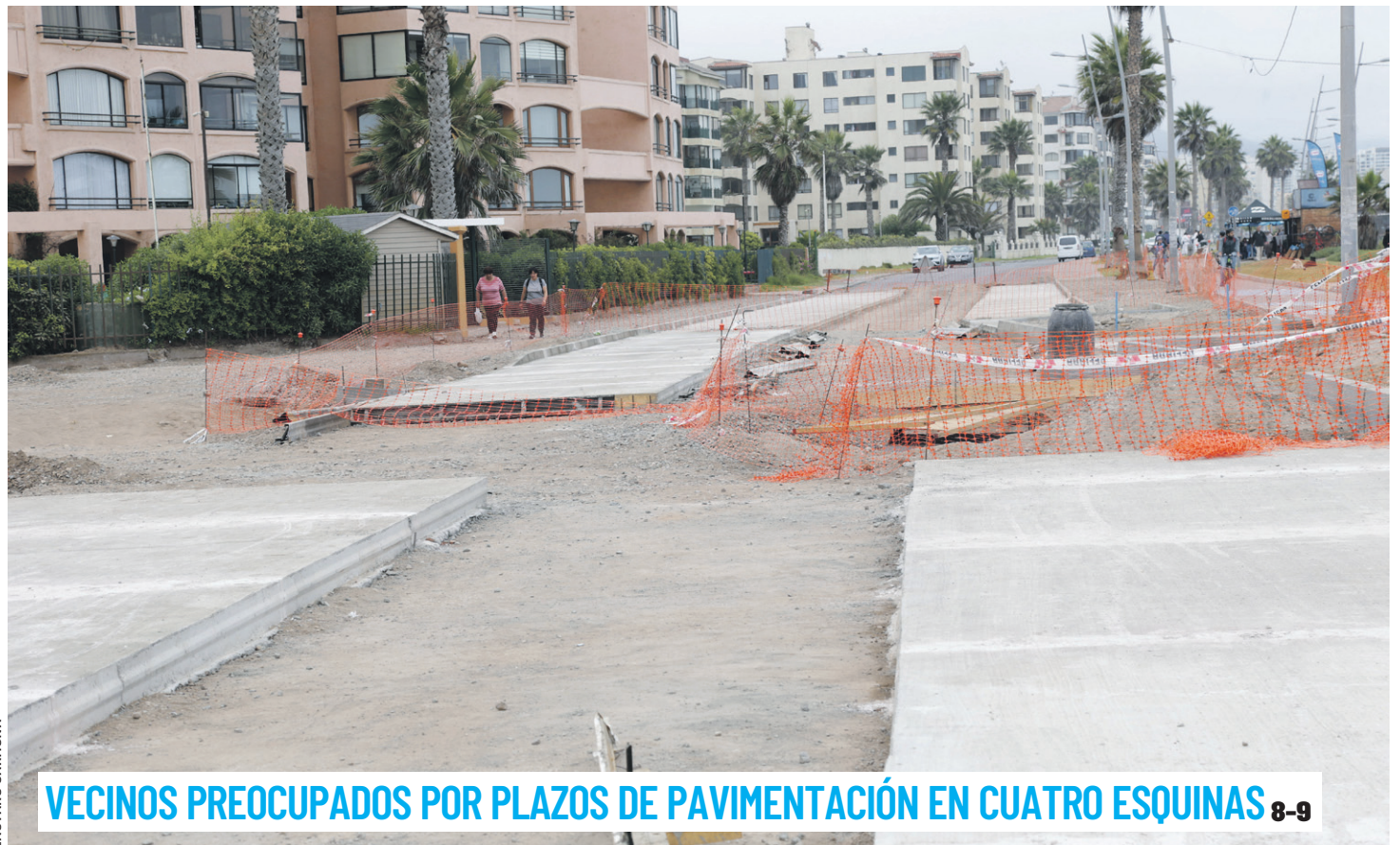
VECINOS PREOCUPADOS POR PLAZOS DE PAVIMENTACIÓN EN CUATRO ESQUINAS 8-9