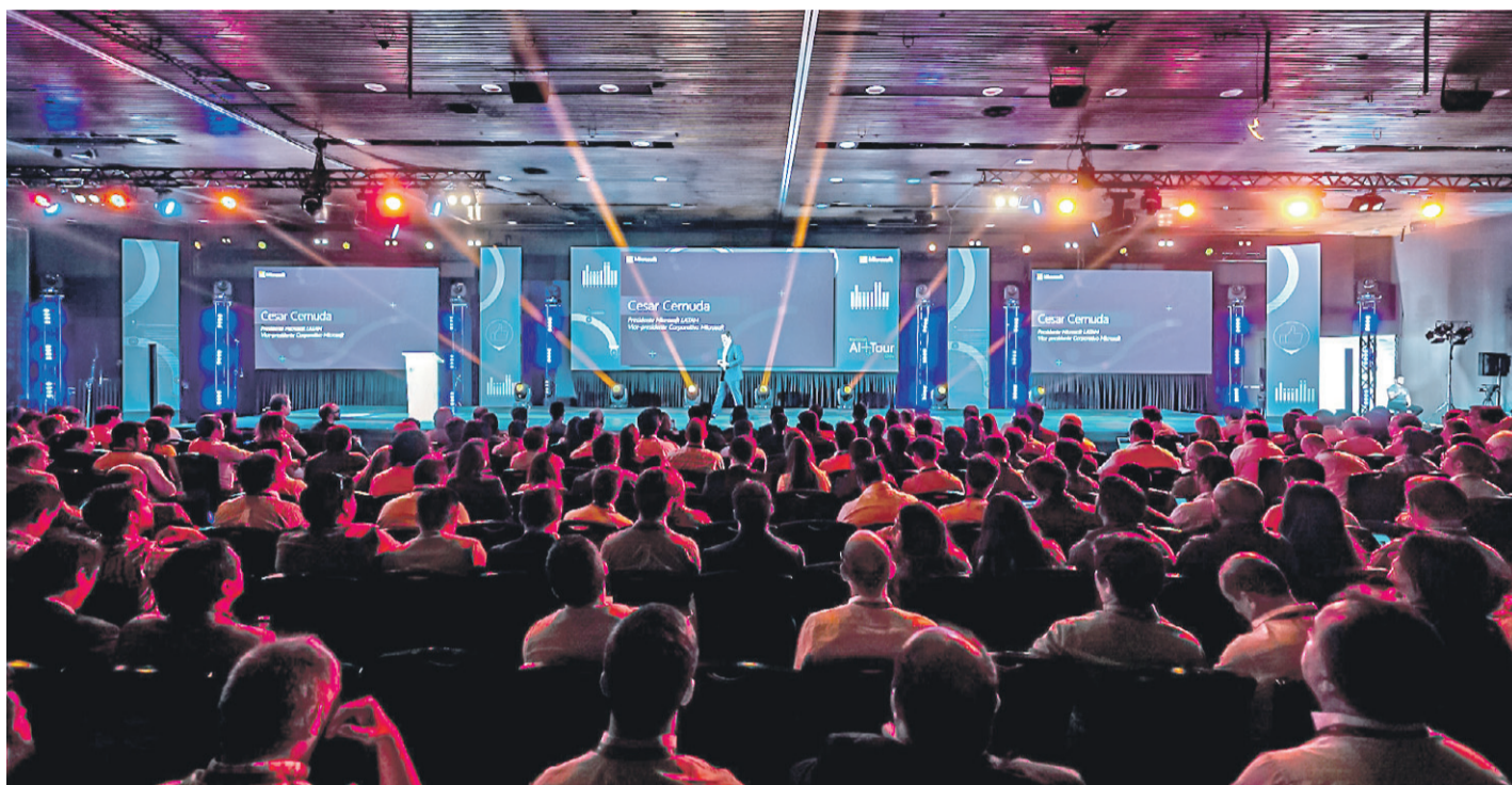
El "AI+Tour" de Microsoft se desarrolló este 7 y 8 de enero en Santiago.