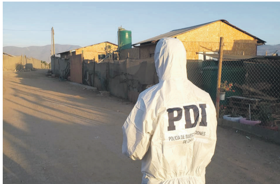
En el Sector San Rafael, Pan de Azúcar se produjo el ataque con arma cortante

El hombre habría sido agredido con un arma cortante falleciendo en el hospital San Pablo. La PDI investiga otro caso similar ocurrido en La Serena.