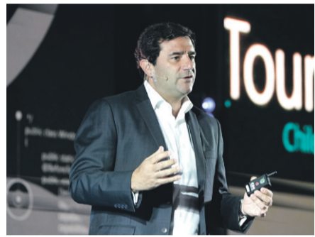
César Cernuda , presidente de Microsoft Latinoamérica y vicepresidente corporativo de Microsoft, durante su presentación en el AI+Tour

También se está trabajando con los observatorios, para predecir anomalías