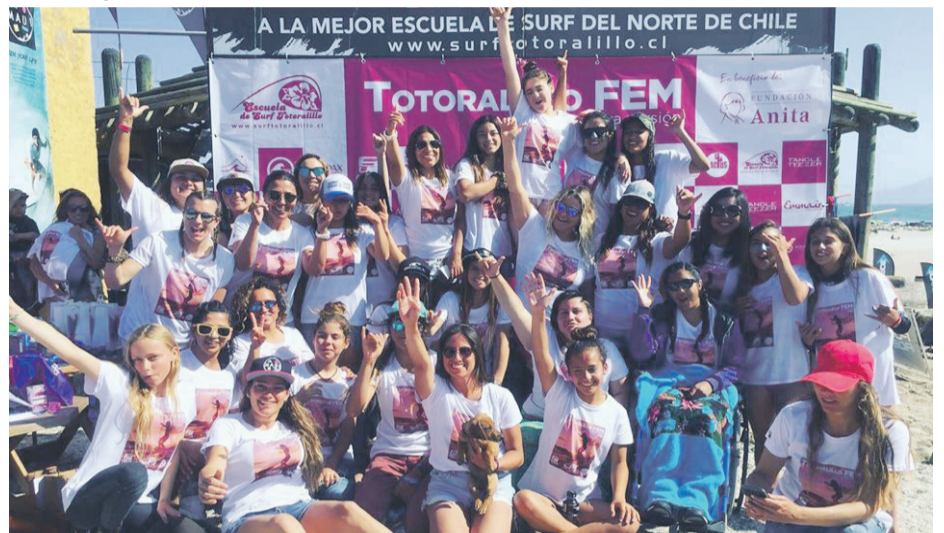
ESCUELA DE SURF