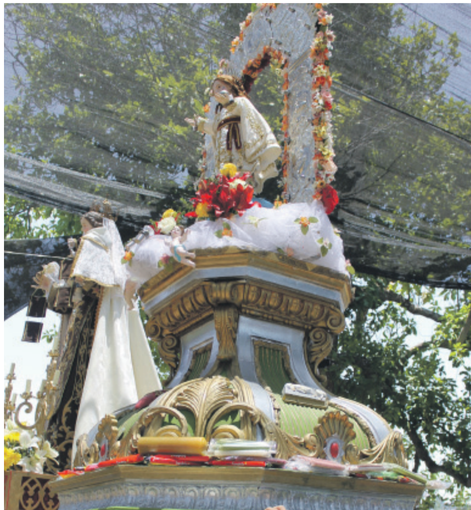
Miles de fieles llegaron al Santuario de Sotaquí a venerar al Niño Dios