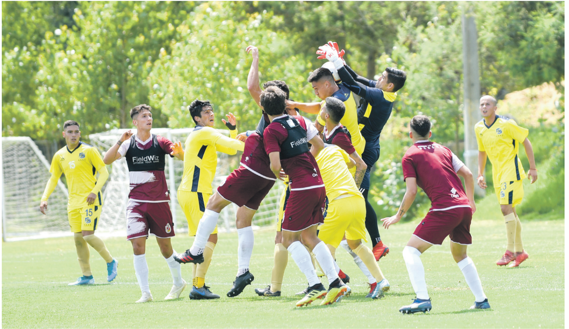
A través del juego aéreo La Serena presionó el arco ruletero en el primer amistoso de ambos elencos celebrado en Viña del Mar.