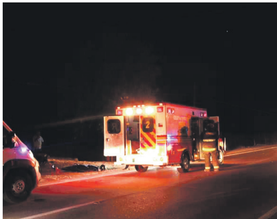
Sitio del suceso del accidente protagonizado por un motorista en la ruta D41.

Consultados, en las agrupaciones de motoqueros de la región indican que no era conocido en el ambiente motor, sin embargo lamentaron la muerte y