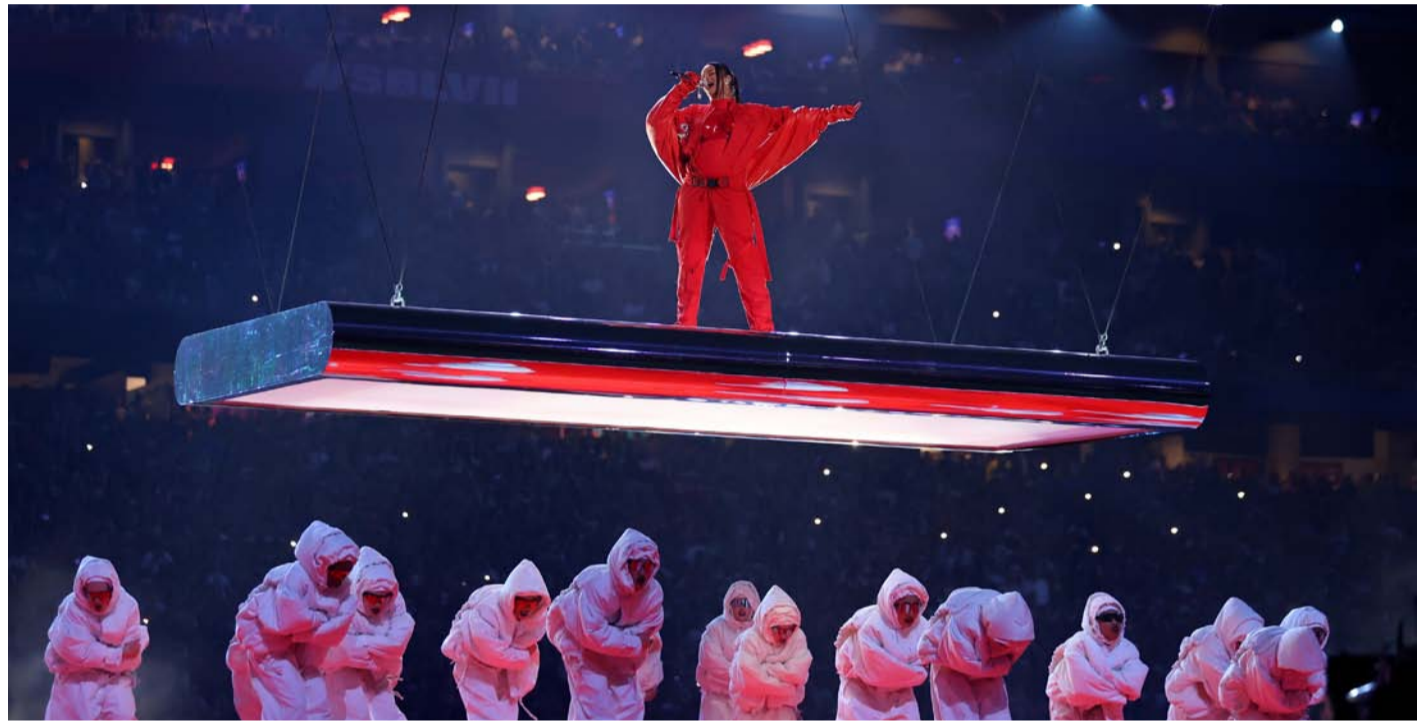
Rihanna devolvió la música pop al descanso del Super Bowl tomando el relevo de los raperos Dr. Dre, Snoop Dogg, Eminem, Mary J. Blige y Kendrick Lamar.