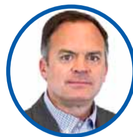
Matías Walker SENADOR DEMÓCRATAS

“Sebastián Piñera era una figura súper potente y también podemos encontrar en otros liderazgos dentro de la derecha, especialmente el de Evelyn Matthei”