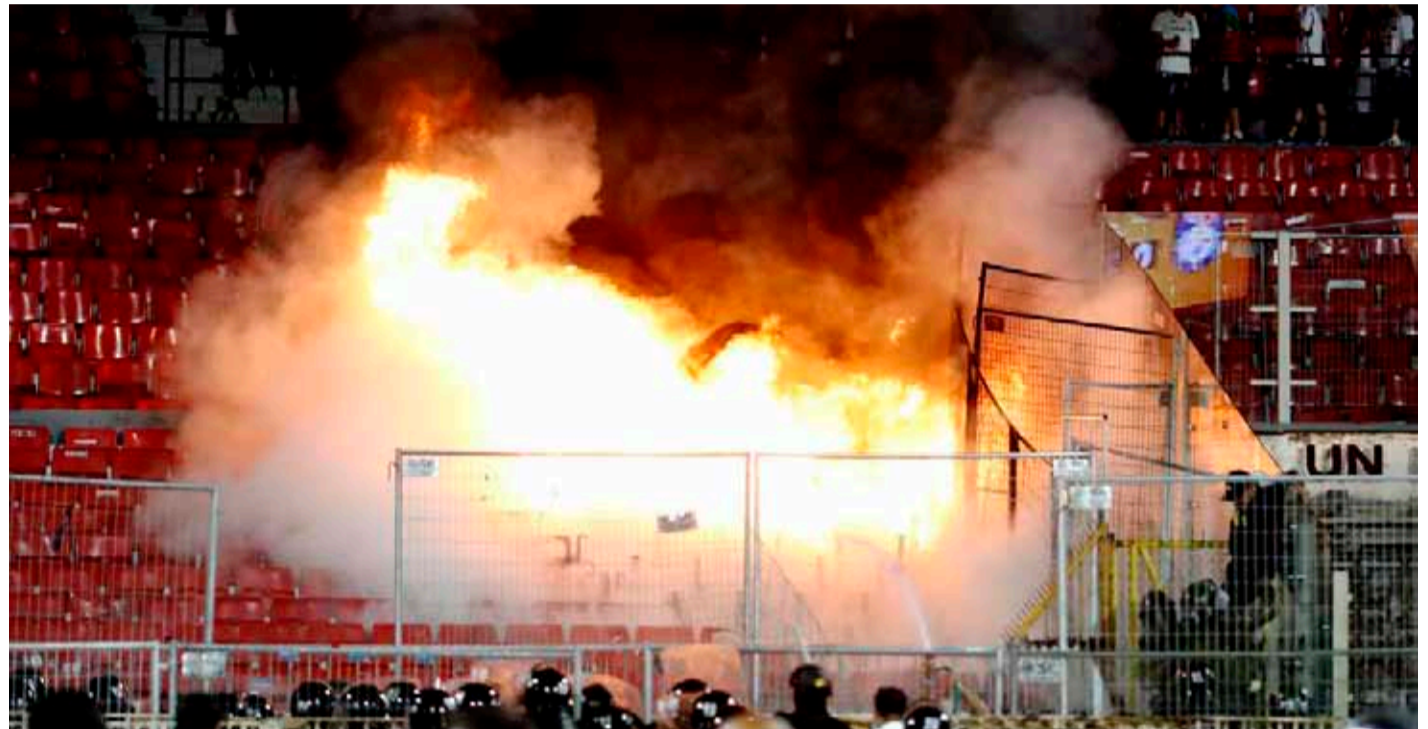
Imagen del incendio en una de las tribunas, donde hinchas de Colo Colo provocaron incidentes, durante la final de la Supercopa 2024 entre Huachipato y Colo Colo.

El duelo que enfrentó a los acereros como vencedores de la temporada 2023 y al cacique, ganador de la Copa Chile, fue detenido en el minuto 79 luego de que un contingente de personas invadiera la pista de atle-