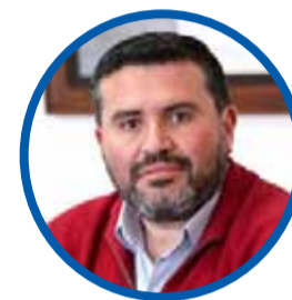
Nicolás Araya PRESIDENTE DE LA UDI

“Es lamentable la reacción del Partido Comunista porque ellos viven y se alimentan del odio, y fueron los únicos que no se sumaron al homenaje de Estado”