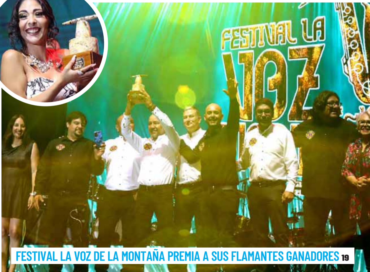
FESTIVAL LA VOZ DE LA MONTAÑA PREMIA A SUS FLAMANTES GANADORES 19

EN PRODUCTOS Y SERVICIOS TURÍSTICOS CAMPAÑA DE ALARGUE DEL VERANO INCLUYE PREMIOS Y DESCUENTOS