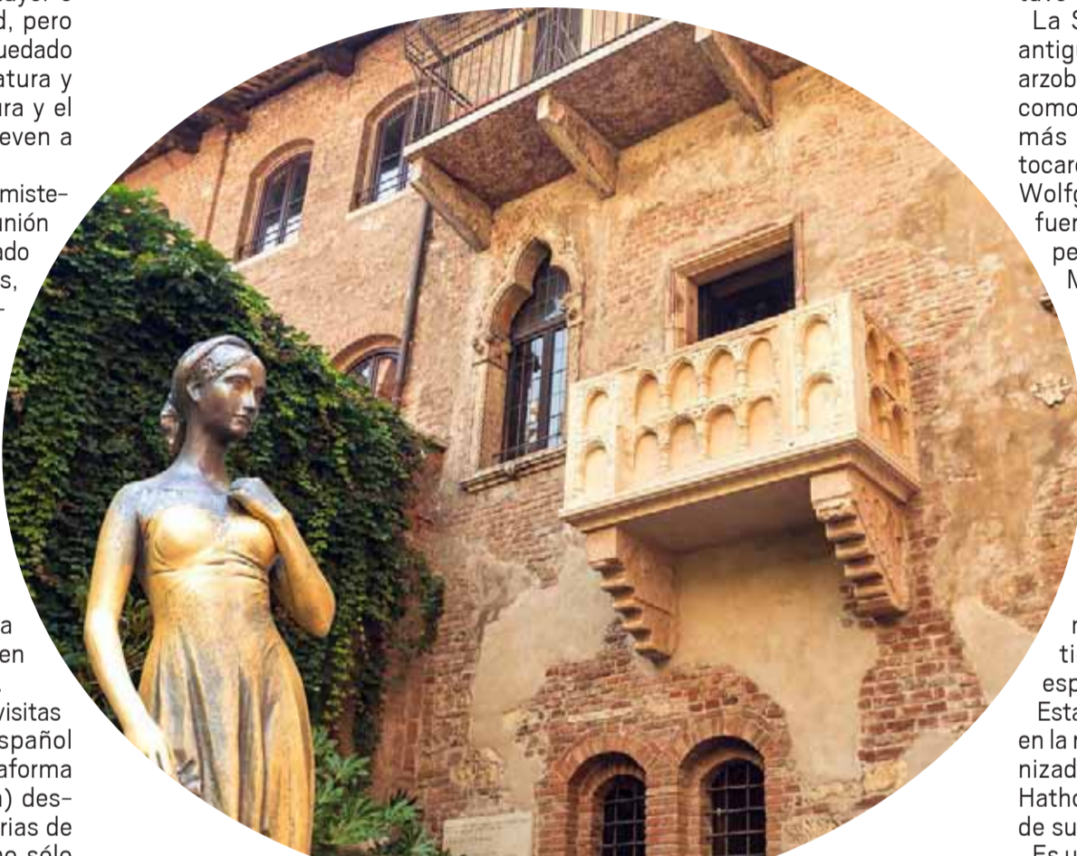
Balcón de Julieta, y estatua en bronce de esta joven, en Verona, Italia.

En el balcón de Julieta (Italia); el palacio de Mirabell (Austria); el templo de Nefertari (Egipto) y en otros monumentos históricos palpitan romances legendarios, tanto reales como literarios.