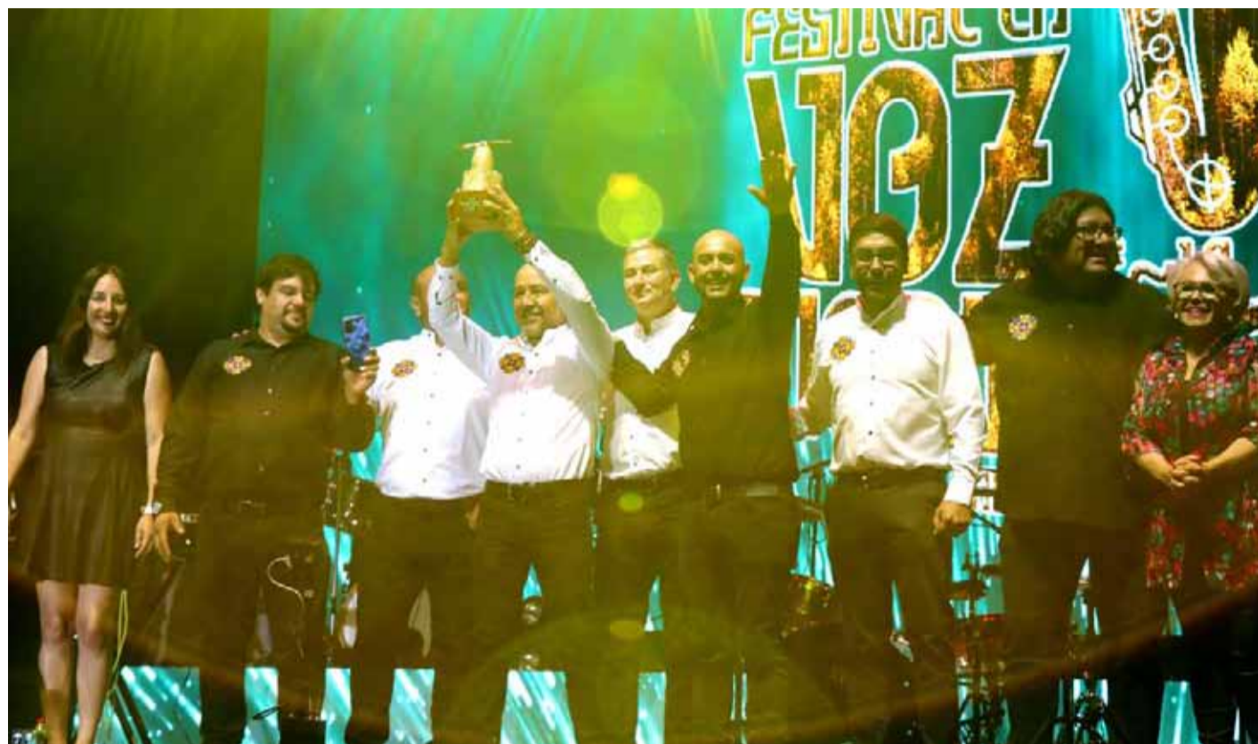
Grupo Jilatas fue uno de los grandes ganadores de la noche.