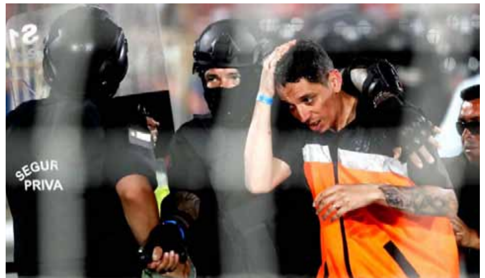
Agentes de seguridad protegen a un hombre herido en su cabeza durante los incidentes provocados por hinchas de Colo Colo durante la final de la Supercopa.

Uno de los conflictos dentro de la violencia cometida por los barristas contra las fuerzas del orden fue la retirada de mantos y banderas con