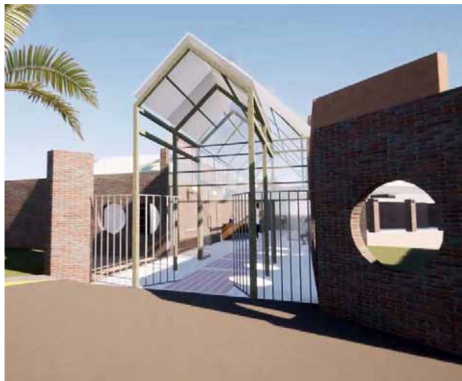
Imagen de como será uno de los accesos del futuro recinto.

El recinto, además de ofrecer servicios de atención de salud y terapias varias, contará con cine, piscina temperada y otras novedades para la tercera edad.