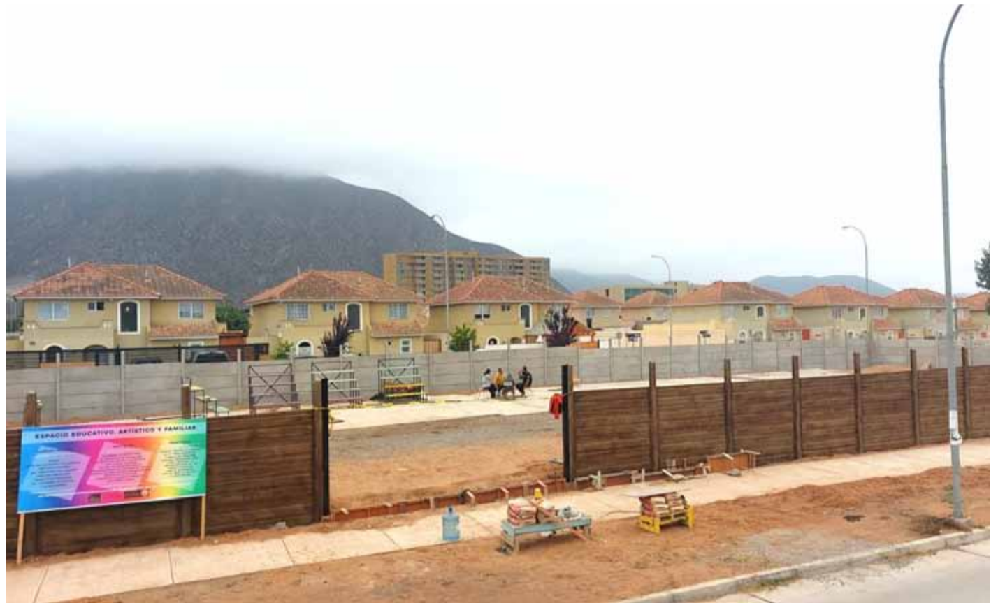
El terreno entregado en comodato a fundaciones culturales ya se encuentra cercado.