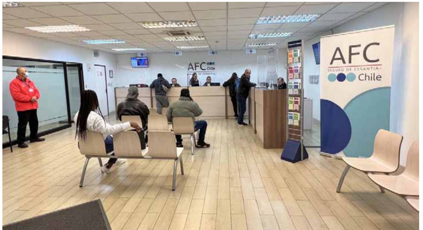
Las empresas y sus trabajadores han sido uno de los ámbitos más afectados por la actual crisis económica.

“Eso significa que la producción además de ventas de las empresas