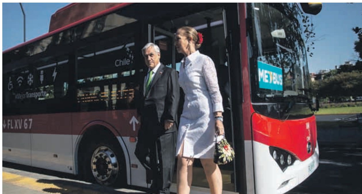
El mandatario, junto a la Ministra de Transportes, recorrieron en estos nuevos vehículos para el transporte público en la capital.

El Metro será considerado como un eje estructural de la movilidad capitalina. Algo en lo que ya se ha avanzado con la nueva Línea 3, que ha transportado en su primer mes de funcionamiento