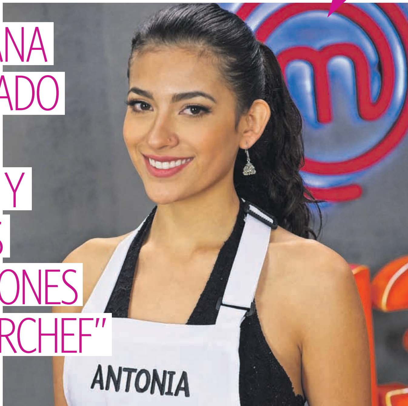
Si bien gracias al programa alcanzó mayor popularidad, nosotros la conocemos hace años por su destacada participación en certámenes de belleza.