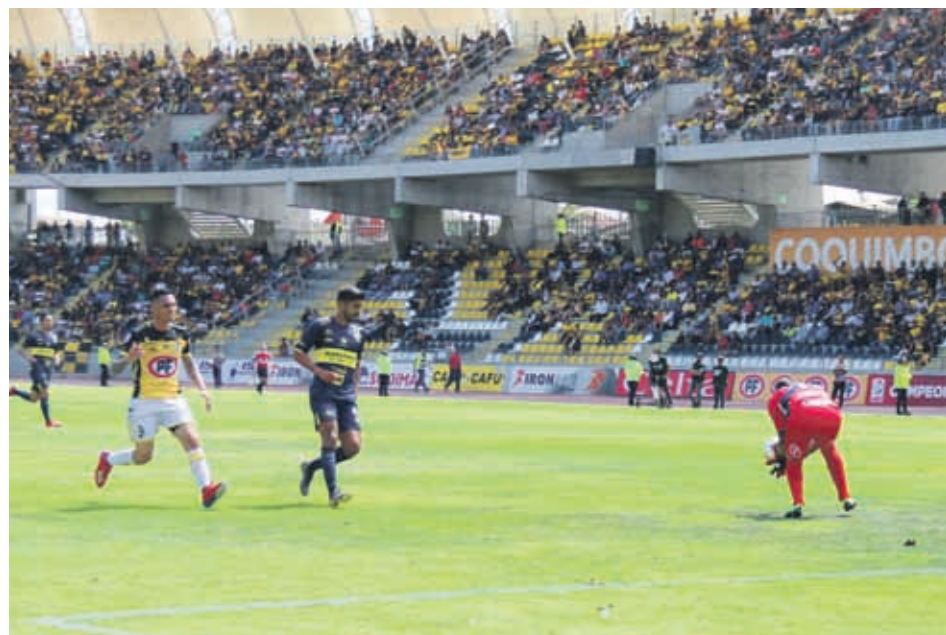
Una cancha en buenas condiciones es clave para desarrollar el fútbol que pretende Graff. En el municipio comienzan a mejorarla.

Con todo, no es sencillo que converjan los intereses deportivos de una institución con personas ligadas desde la cuna con los emblemas de un club, lo cual termina por disolver esta "romántica" manera de concebir la gestión deportiva.