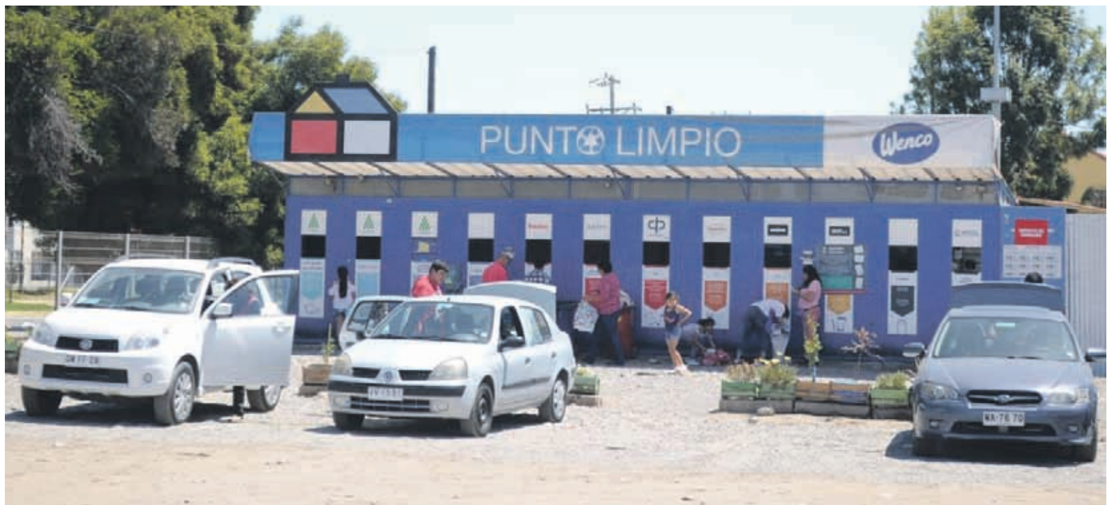
El Punto Limpio que hasta ahora se ubicaba en Mall Puertas del Mar, se trasladará al centro comercial Paseo Balmaceda el 15 de marzo.

Sodimac moverá su nuevo Punto Limpio a un espacio en Paseo Balmaceda, que recibirá desechos reciclables en el sector de La Pampa.