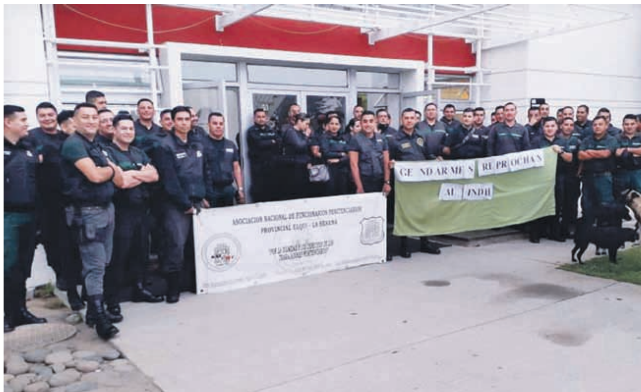
Los funcionarios del penal de La Serena extendieron sus lienzos con las consignas alusivas a sus demandas actuales.

A esta cruda realidad, durante los últimos años, se