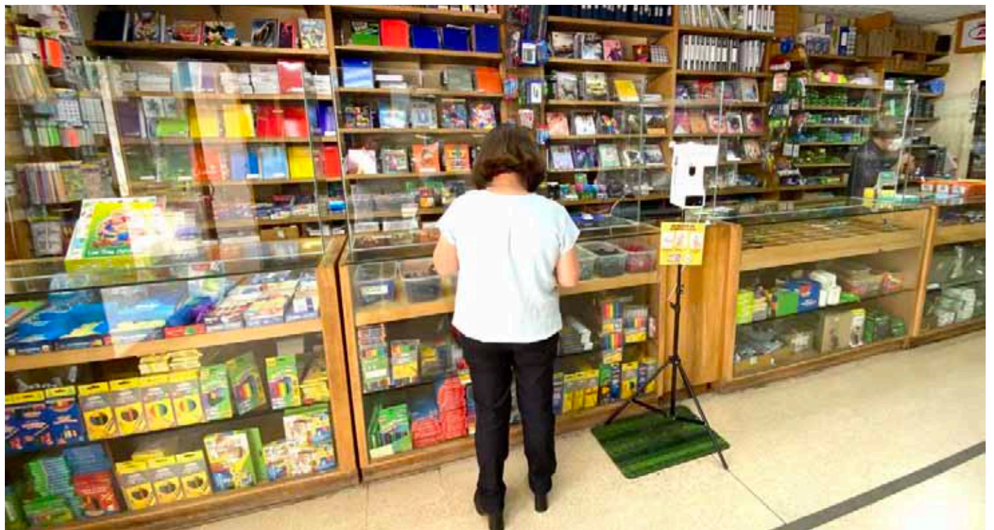
La mayoría de quienes se endeudan provienen de los estratos más vulnerables, sobretodo, desde la clase media.

Esto, entre compras de útiles escolares, uniformes, matrículas, pago de la patente del automóvil, seguro obligatorio y contribuciones. Al mismo tiempo, de acuerdo a un estudio de Chile Deudas, un 83% de la población se endeuda para sus gastos en la Región de Coquimbo. Porcentaje que no solo aumentó en comparación al análisis anterior, sino que también se ubicó por encima del promedio del resto del país.