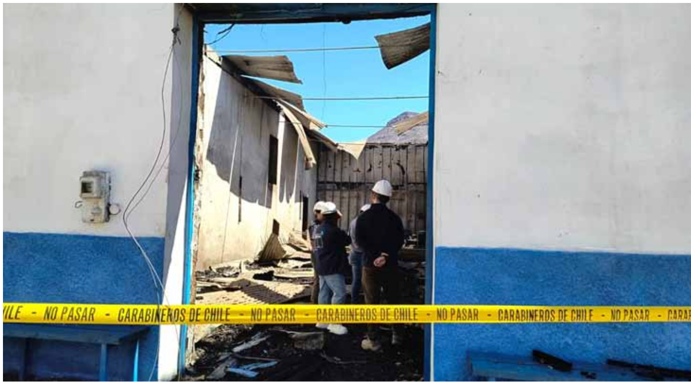
Autoridades visitaron la capilla incendiada en Pichasca, realizando una primera evaluación de los daños.