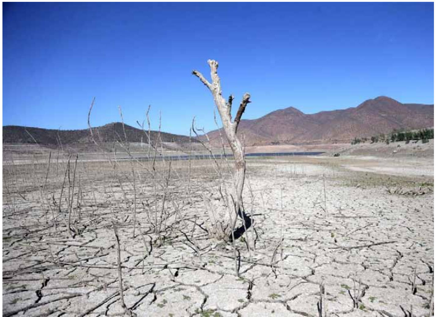
Los embalses regionales se encuentran en promedios negativos históricos.