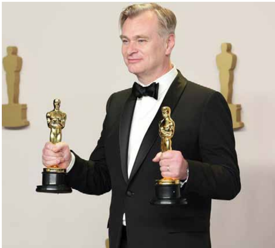
Christopher Nolan fue el gran ganador de la noche de los Óscar.

'Oppenheimer', la historia del 'padre de la bomba atómica' firmada por el británico Christopher Nolan, fue la triunfadora de la 96 edición de los Óscar, con siete premios-de 13 nominaciones-, incluido el de mejor película. Y 'Poor Things', del griego Yorgos Lanthimos, se hizo con cuatro de las once estatuillas a las que aspiraba.