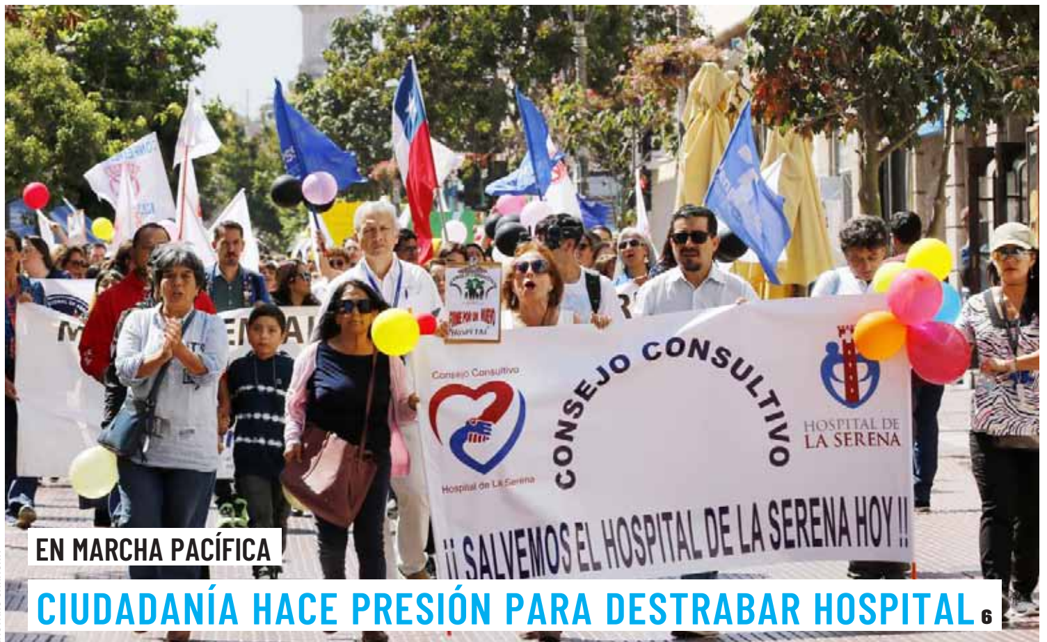
EN MARCHA PACÍFICA

DOS NUEVOS JUGADORES SE SUMARÍAN A CDLS 19