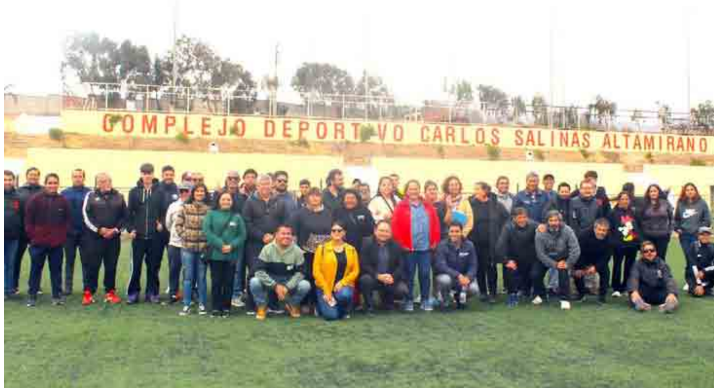
Los vecinos, dirigentes y autoridades conocieron los detalles de las obras que se desarrollarán en el recinto deportivo.

Para el alcalde de la comuna, Christian Gross, el mejoramiento