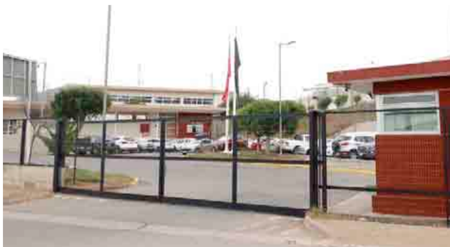
EL DÍA Durante la instalación del Gabinete Pro Seguridad dicha medida fue planteada para evitar que personas ligadas a los internos del penal se instalen en sus alrededores.

El tema fue abordado durante el desarrollo del Gabinete Pro Seguridad, además de otras medidas, como contar con una oficina receptora de drogas del Servicio de Salud para Limarí y Choapa, la creación de una sección del OS9, y aumentar los medios que dispone la región para el control y decomiso de las plantaciones de cannabis.