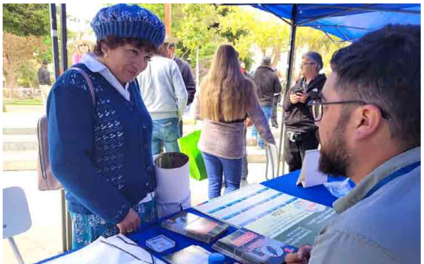
En la comuna de Illapel, equipos de la seremi de Salud y del Servicio de Salud Coquimbo realizó diversas actividades educativas y de pesquisa en torno a la enfermedad de Chagas.