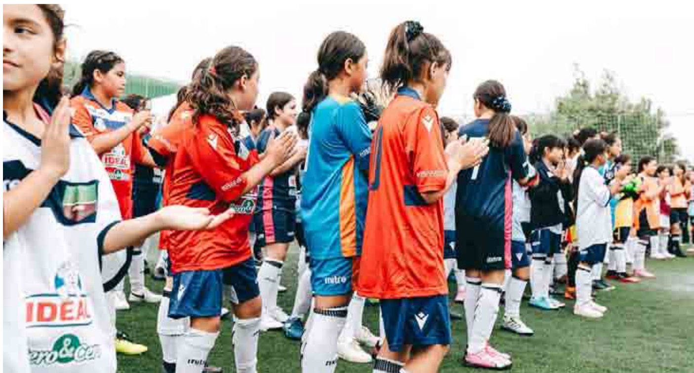
Este sábado se desarrollará la competencia del futbolito en el complejo Pingüino con 16 establecimientos de la región.