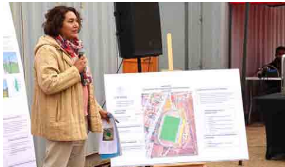
El recinto de Los Vilos será sometido a una conservación general, iniciativa que demanda una inversión de más de 650 millones de pesos.