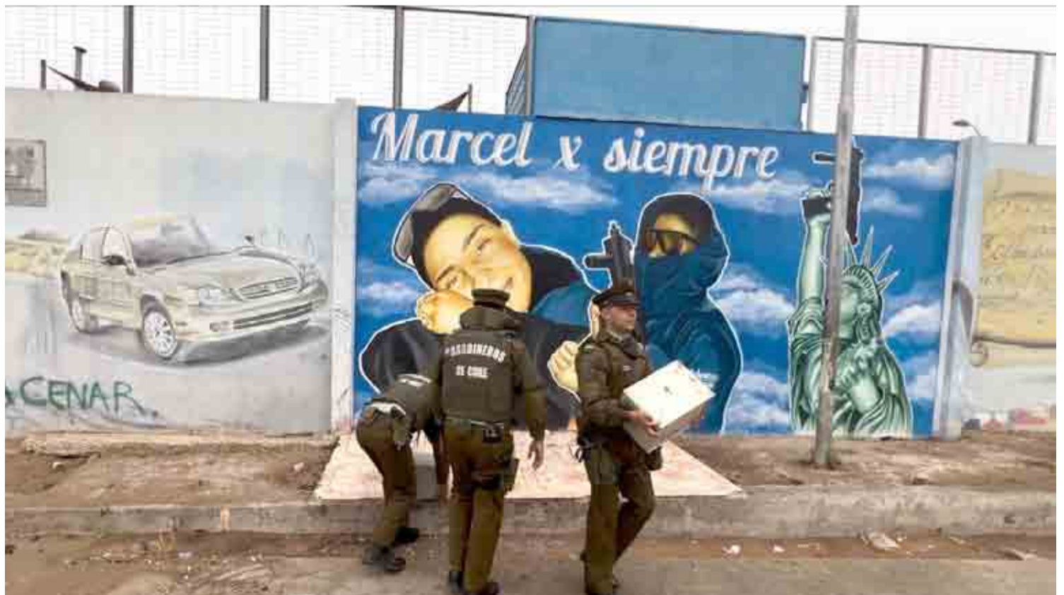
CARABINEROS RETIRA “NARCO MEMORIAL” EN TIERRAS BLANCAS 5