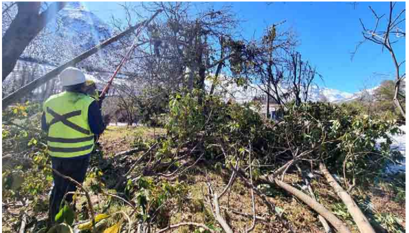
Durante la jornada de este viernes se llevaron a cabo algunos trabajos de despeje y limpieza ante la inminente llegada a la región de un núcleo frío en altura.

El ejecutivo afirmó que, dada la grave sequía que vive la zona, estas lluvias podrían representar un alivio ante la crítica situación hídrica, pero recordó que sólo un sistema frontal no resolverá la situación.