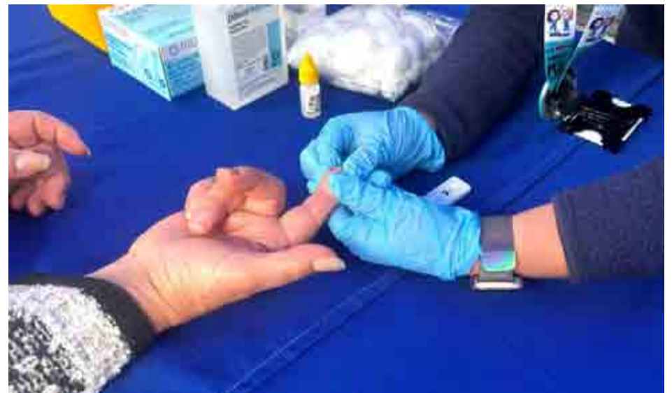
El examen para reconocer si se tiene o no, la enfermedad de Chagas, se puede realizar en cualquier centro de salud familiar.

En Chile y en la Región de Coquimbo, la ejecución sistemática de las actividades de control vectorial permitió eliminar la