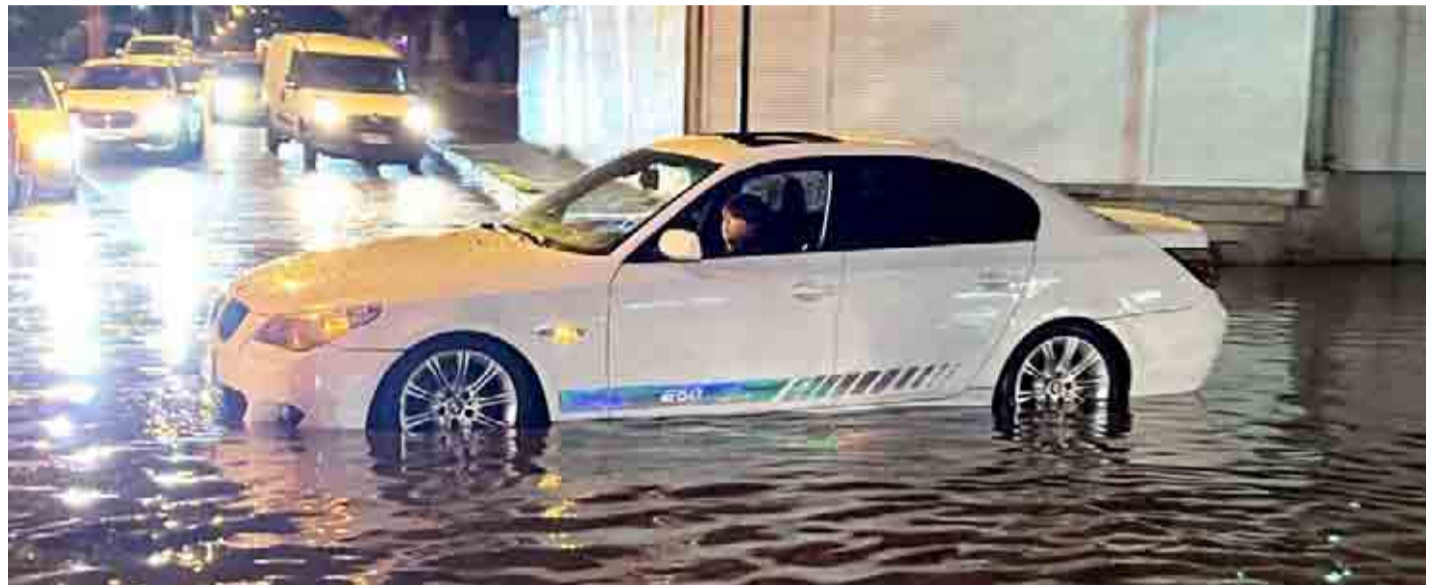
En la comuna de La Serena se esperan sobre los 50 milímetros de agua caída.

“Estas precipitaciones vienen acompañadas de fuertes vientos, y eso se conjuga con la minuta técnica de SERNAGEOMIN que señala que existe una alta probabilidad de remoción en masa de precordillera y valles precordilleranos. De acuerdo a esta serie de amenazas provocarán una serie de emergencias a lo largo de la región y se producirán cortes de