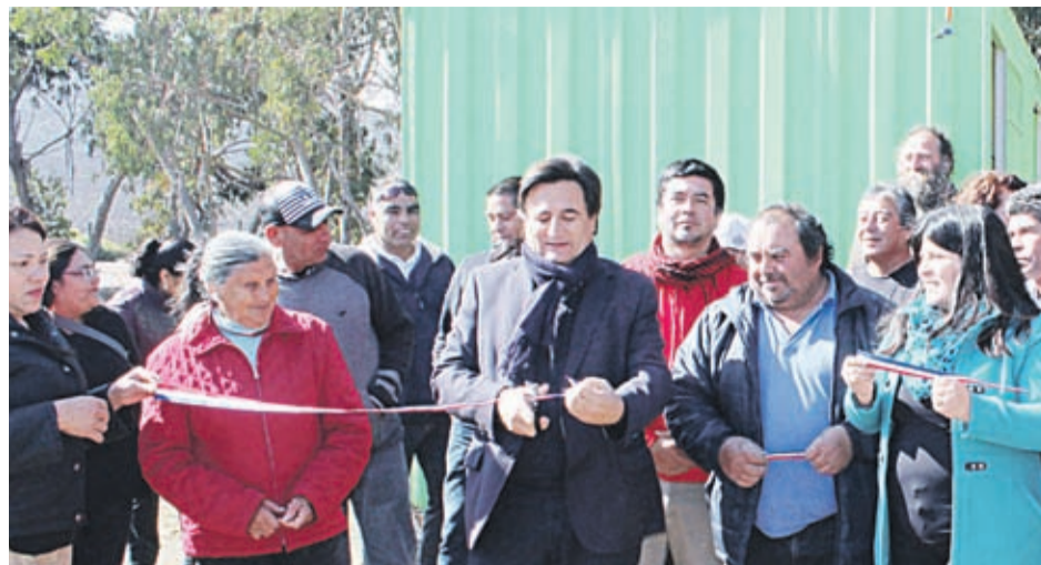
EL FOSIS, a través de su componente Fortalecimiento de la Autogestión del programa Acción, financió la iniciativa social.