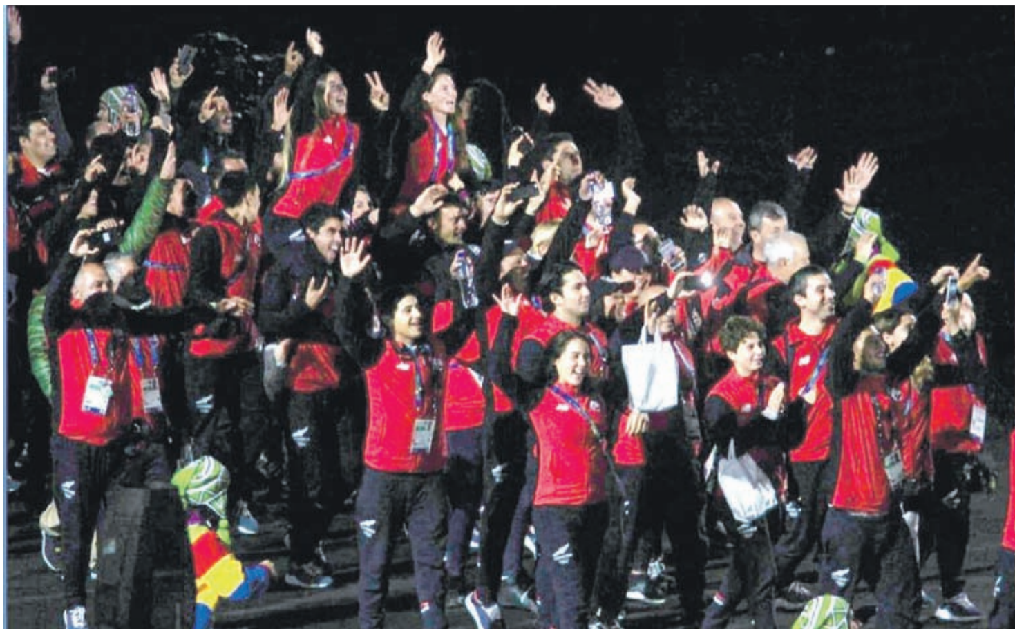
El Team Chile en la ceremonia de cierre de los Juegos Panamericanos de Lima 2019.