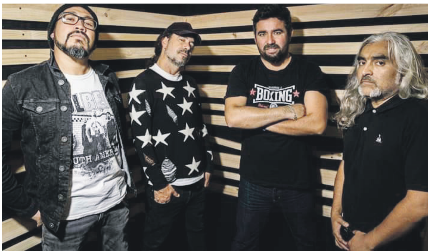
El grupo regional Caín será parte del evento que se desarrollará en el Palace.

En cuanto al certamen estudiantil, serán alrededor de 20 bandas que participarán, de las cuales se elegirán a cuatro. Las seleccionadas, que serán votadas por un selecto