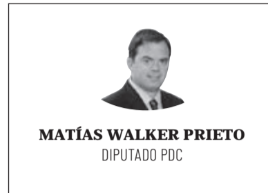
MATÍAS WALKER PRIETO DIPUTADO PDC

Poder terminar la jornada diaria de trabajo una hora antes. Así podría resumirse el efecto que tendría el proyecto de ley que estamos promoviendo en el Congreso Nacional y que busca reducir la jornada laboral de las actuales 45 a 40 horas.