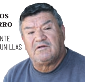
HABITANTE DE LAGUNILLAS

conectada lo que les llama profundamente la atención. “¿quién estuvo manipulando el teléfono durante ese tiempo?, ¿Lo tenía este tipo y lo está ocultando porque hay cosas que no quiere que veamos?, ¿qué tipos de mensajes le mandaba a mi hermana? Esas cosas va a tener que explicárselas al juez”, sostuvo su hermana mayor.