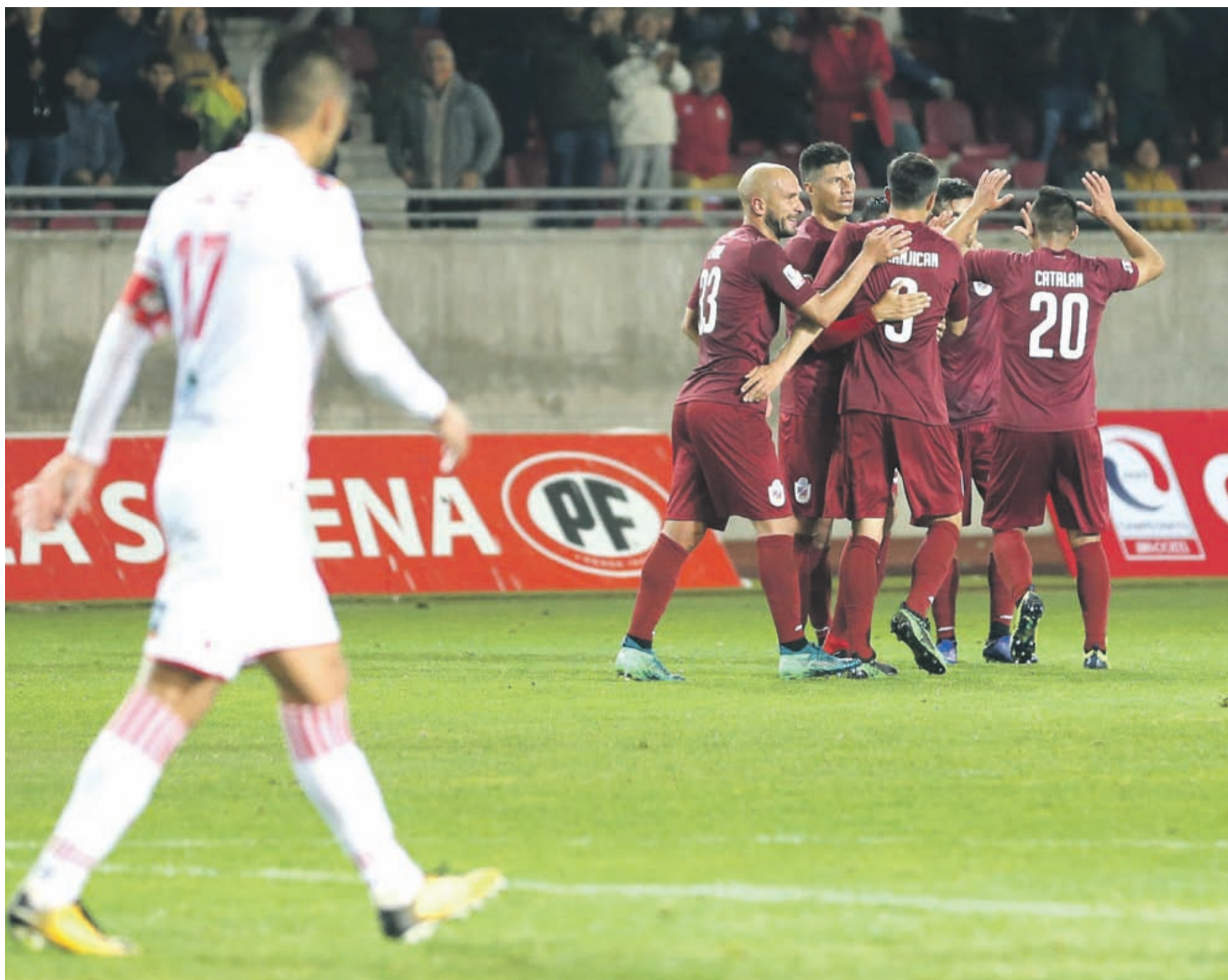
Abrazos en Deportes La Serena. Con este triunfo, quedaron a dos del líder.