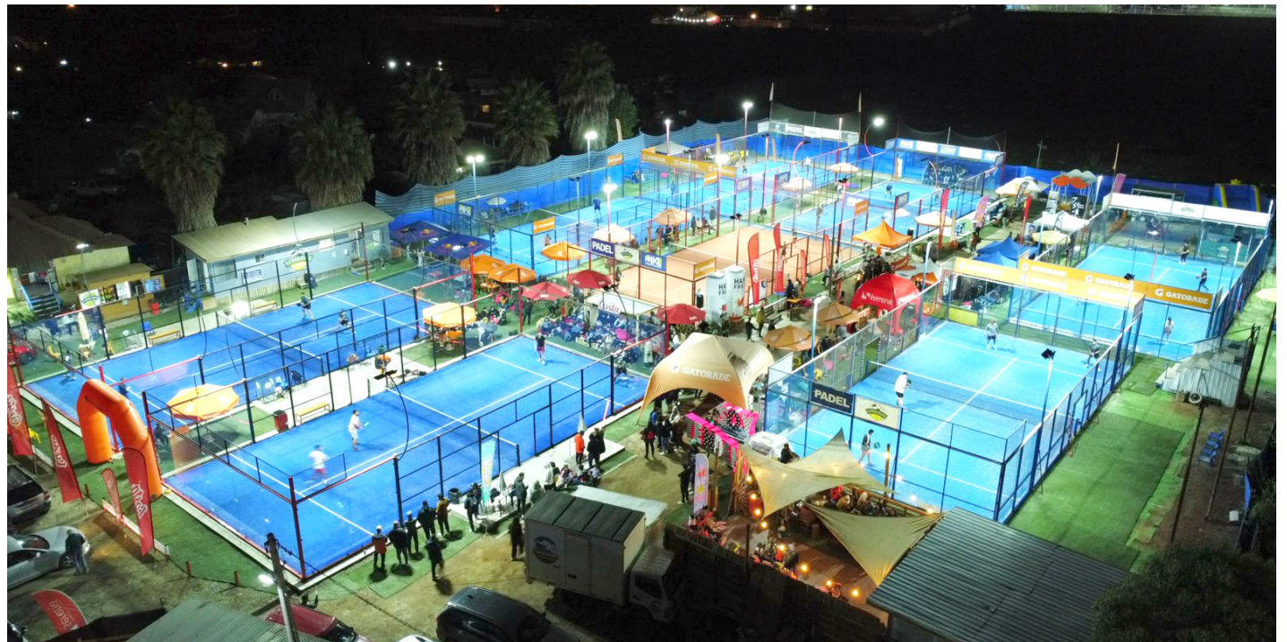
El Club 4 Esquinas, con sus ocho canchas, ha crecido con los años y hoy es uno de los más importantes de La Serena y la región.

"Es cierto que hoy hay mucha gente que juega al pádel", destaca con satisfacción. "Nosotros festejaremos los 30 años del club con un masivo torneo que se extenderá desde mañana (hoy) martes hasta el domingo, con un universo de 205 parejas que se distribuirán en seis categorías varones y cuatro damas", agregó.