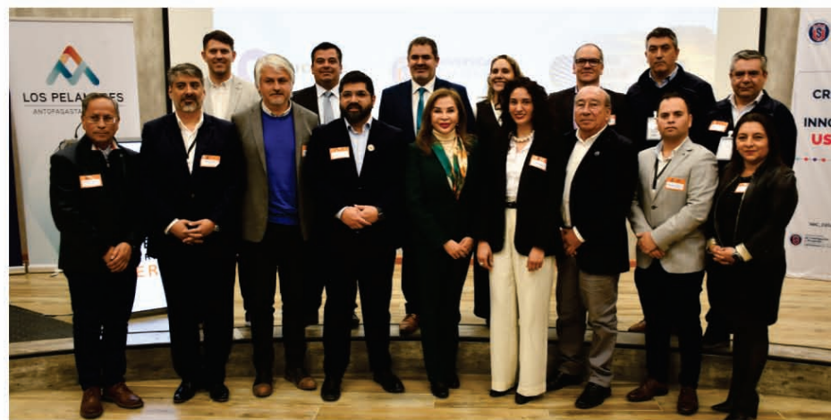
Teck CDA y proveedores andacollinos destacaron en el encuentro.

En su primera jornada, se informó sobre los resultados de un reciente estudio elaborado por la Alianza CCM-Eleva, como un complemento al Estudio de Fuerza Laboral de la Gran Minería Chilena 2023-2032, que