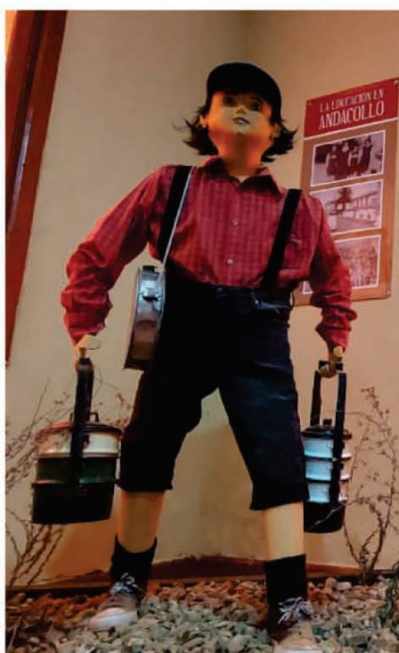
Representación del niño viandero de Andacollo.