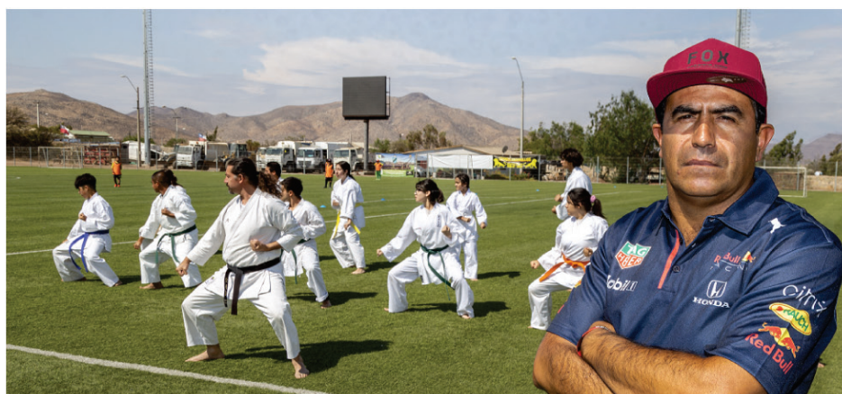
En aumento va la participación de niños y niñas en el deporte andacollino.

Andacollo no sólo compite en fútbol, ahora también lo hace en ciclismo, mountainbike y moto enduro, donde destacan a nivel nacional.