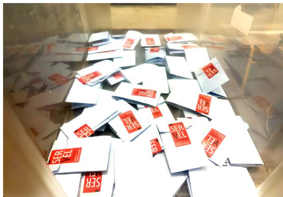
EL DÍA Acorde a lo que ha avanzado la tramitación de la reforma electoral, el proceso se realizará durante el sábado 26 y domingo 27 de octubre.