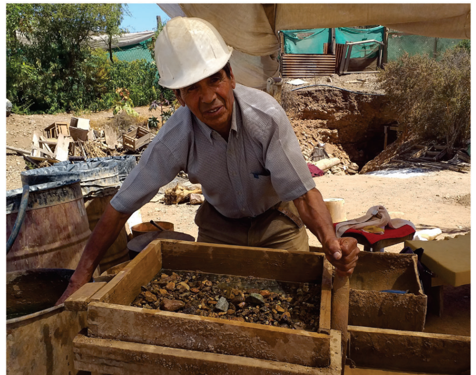
El proceso de lavar oro en bateas artesanales.

Desde aquellos tiempos los viejos pirquineros han estado escarbando en busca del preciado mineral y lo han realizado en escualidas condiciones en los profundos piques, subiendo muchos metros en frágiles escaleras cargando en sus espaldas los pesados capachos con más de 80 kilos.