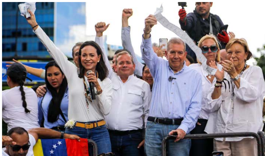
María Corina Machado y Edmundo González Urrutia han seguido llamando a la población a participar en manifestaciones contra el régimen venezolano.