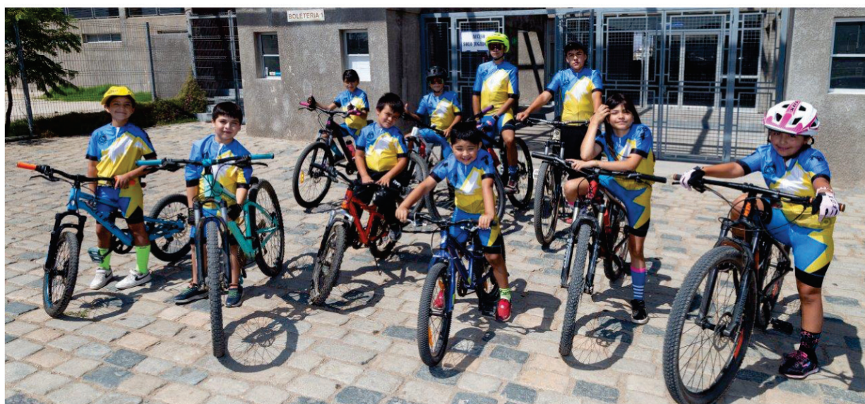
En la comuna cada día hay más deportistas y en todas las ramas.

organismo creado el 2019 con el objeto aunar criterios en el deporte de la comuna.