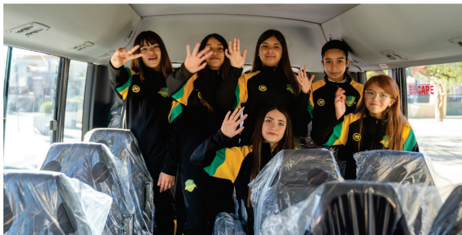
Los deportistas andacollinos cada día tienen más comodidades para viajar a sus competencias.

Los dirigentes de la Unión Comunal de Deportes tienen claro que el deporte es vida y que practicarlo es uno de los pilares para una vida saludable, además de mantener a los jóvenes alejados de los vicios. “Por lo mismo, lo importante es salir a correr, salir a caminar, jugar un encuentro de fútbol, hacer yoga, zumba o practicar algún deporte. Y eso, sin lugar a dudas, te hará estar más saludable, mantener un buen ánimo, ser feliz y con más energías, además de estar formando deportistas para la alta competencia, que también es uno de nuestros sueños”, enfatiza el timonel del