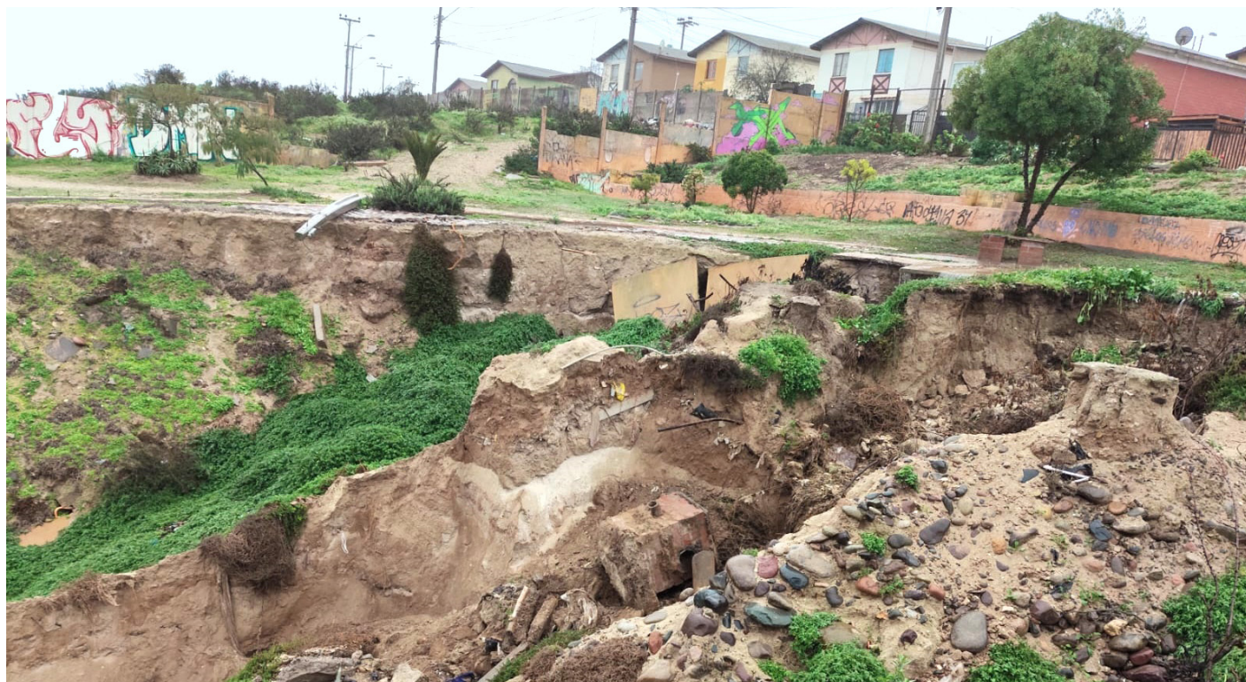
Producto de la existencia de un socavón de proporciones en el sector, los vecinos de Villa Talinay tienen temor que éste siga creciendo y afecte a sus casas.