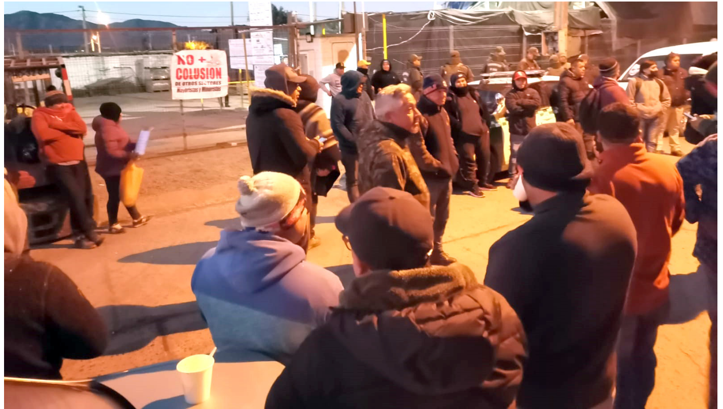
Por orden del municipio de Ovalle, ningún comerciantes del sector Postura de la Feria Modelo pudo ingresar este lunes al recinto.

"El viernes nos notificaron de un decreto, que decía que no se le permitiría entrar a la feria al posturero infractor, es decir, al que venda al por menor, lo que está prohibido en el sector Postura. Lamentablemente, este lunes cuando llegamos a las 4 de la mañana, la feria estaba con las puertas cerradas y no dejaron entrar a nadie. Eso fue lo que nos molestó, porque si bien existe una ordenanza para sancionar a las personas que no hagan caso al reglamento, no