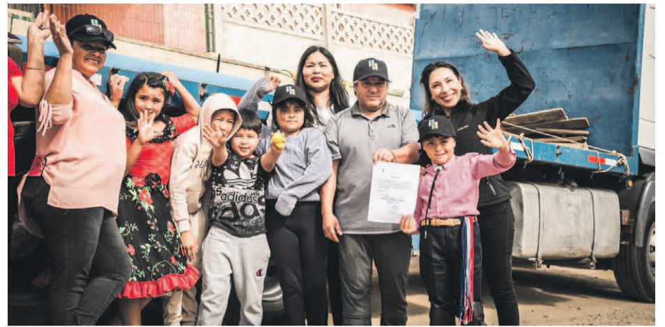
Los vecinos de La Higuera agradecieron el aporte de la empresa minera.