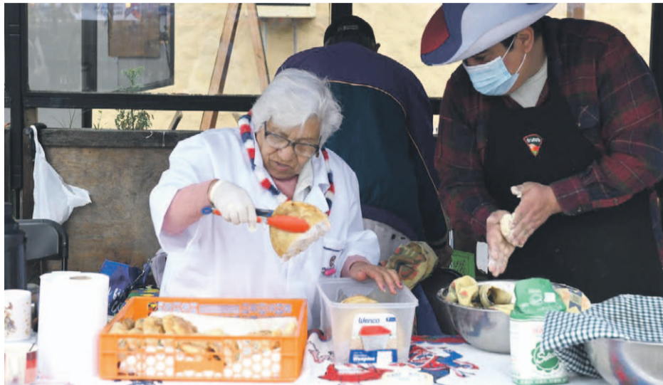
La mejor gastronomía típica pudieron disfrutar quienes participaron en la actividad.

La iniciativa, organizada por el municipio, ofreció productos típicos caseros preparados en el momento. Además se eligió la mejor empanada entre los expositores.