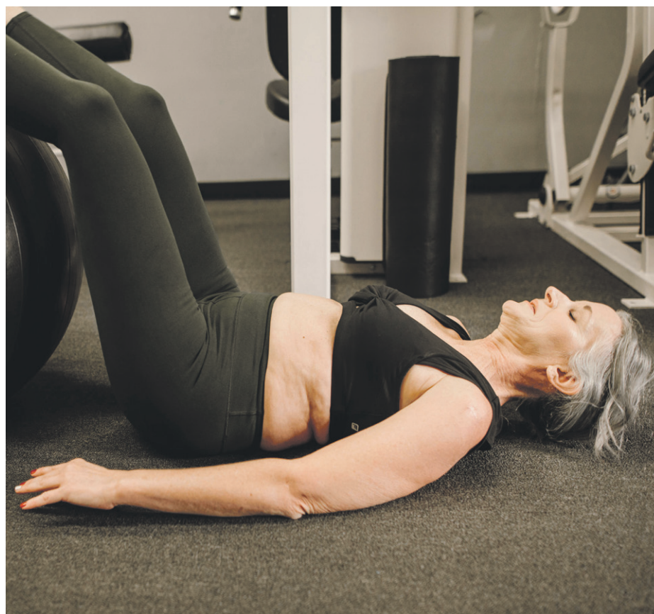
Habitualmente, el cese de las reglas ocurre entre los 45 y 55 años.

Irregularidad en los ciclos menstruales, bochornos y cambios de ánimo son señales a las que se debe prestar atención.