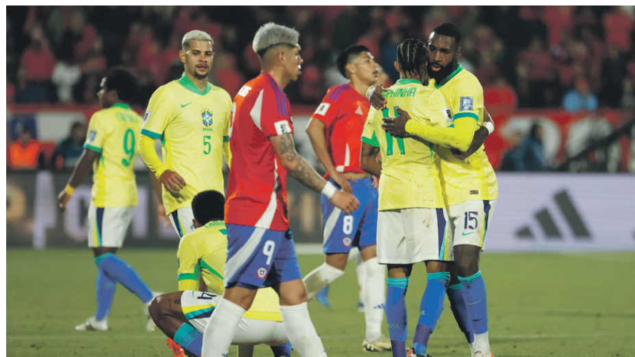
El chileno Carlos Palacios dejó a la selección en Juan Pinto Durán, no estará ante Colombia en la próxima fecha.

Muy distante de la posición de Palacios, se mostró el delantero Eduardo Vargas, quien sorprendió en redes sociales con una llamativa publicación señalando que, "¡Siempre es un orgullo querer vestir la camiseta de tu país! Independiente de los resultados, nunca me bajaré de este barco", en clara alusión a la posición del mediocampista del cacique.