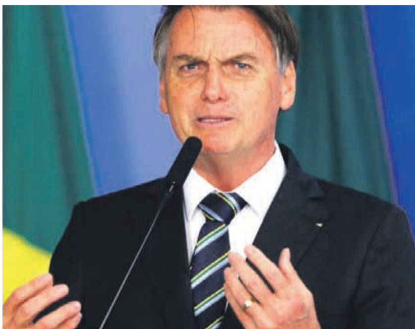
Jair Bolsonaro, presidente de Brasil, confirmó el hecho a través de redes sociales.

“Hoy anuncié mi salida del PSL y el inicio de la creación de un nuevo partido: ‘Alianza por Brasil’, publicó Bolsonaro en su muro de Facebook, en un texto que acom-