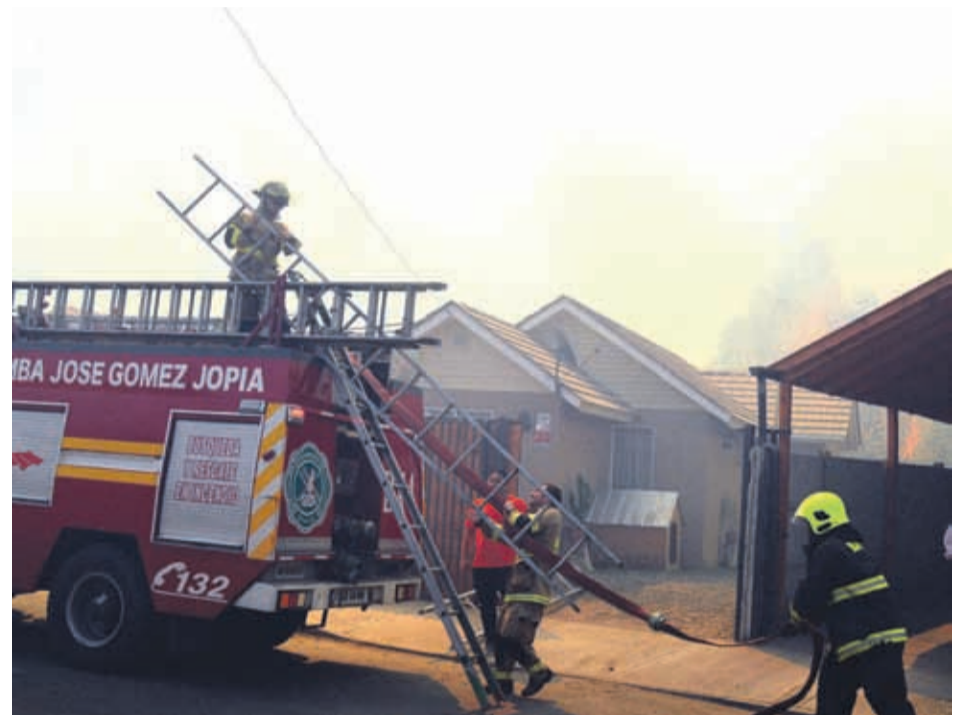
Las llamas amenazaron a varias casas del sector.

Hectáreas fueron afectadas por el incendios según informó CONAF.