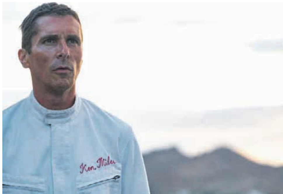
que muestra a Christian Bale en la película “Contra lo imposible”.

Con unas espectaculares escenas de carreras y la dirección de James Mangold, esta cinta, que se estrenará el próximo 05 de diciembre en las salas nacionales, cuenta la historia real del peculiar piloto Ken Miles.