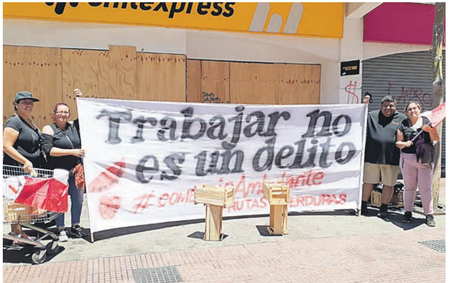
El grupo de mujeres instaló un lienzo con la frase “trabajar no es un delito”

La ambulante admite que en la calle vende lechuga, brócoli y coliflor, y alguna otra fruta o verdura de la estación. Ella trabaja