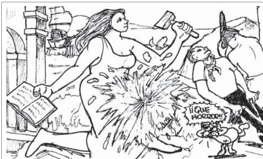
“PARA QUE SE ENNOBLEZCA E VAYA EN CRECIMIENTO” (Gregorio de La Fuente)