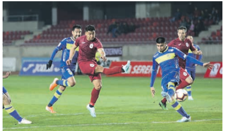
Todo indica que La Serena no jugará este lunes su partido ante Melipilla.

yero dispute su compromiso con su similar de Melipilla, considerando que el fútbol forma parte de la idiosincracia del pueblo chileno y que la vida debe seguir, esta vez entregó otra versión, asegurando que "lo más probable es que yo no preste el estadio para el partido del próximo lunes, porque no están las condiciones y ahora es bueno decirle a la gente que no voy a