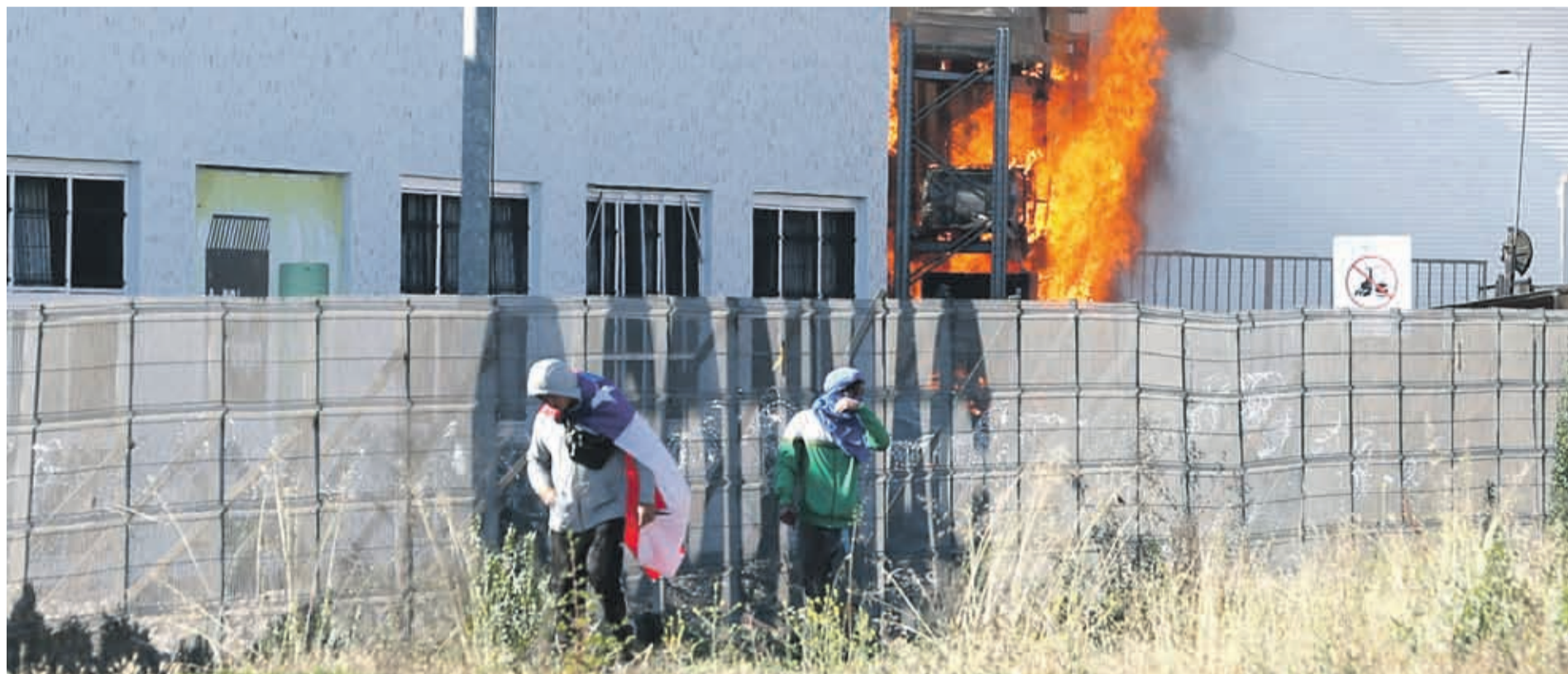
Minutos más tarde, un grupo ingresó a algunos locales del Mall Puertas del Mar, en el mismo sector, para saquear tiendas como Sodimac, donde también se registró un incendio.

Posteriormente, la turba tras dañar la ex estación, ingresó a Homecenter Sodimac y los locales comerciales del Mall Puerta del Mar sacando una gran cantidad de productos.