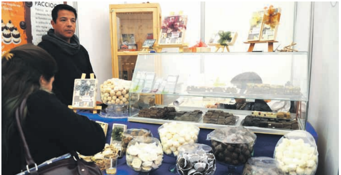
Las pymes pueden desarrollar una serie de acciones para gestionar el pago de una factura.

El abogado añade que “también hay acciones prejudiciales que se pueden realizar para lograr el pago de las facturas y que, desde el punto de vista tributario, van a servir si el deudor no paga, para castigar la deuda y poder rebajar este crédito incobrable de las utilidades de la empresa. Según el experto de LegalChile, las