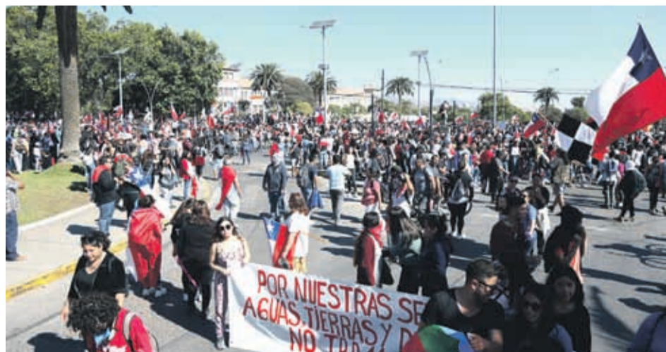
La mayoría de las personas se trasladaron de forma pacífica en familia y poco tuvieron que ver con los desmanes de un grupo de descolgados.

Al cierre de esta edición, una turba de personas ingresó a saquear el Santa Isabel ubicado en Sindempart.