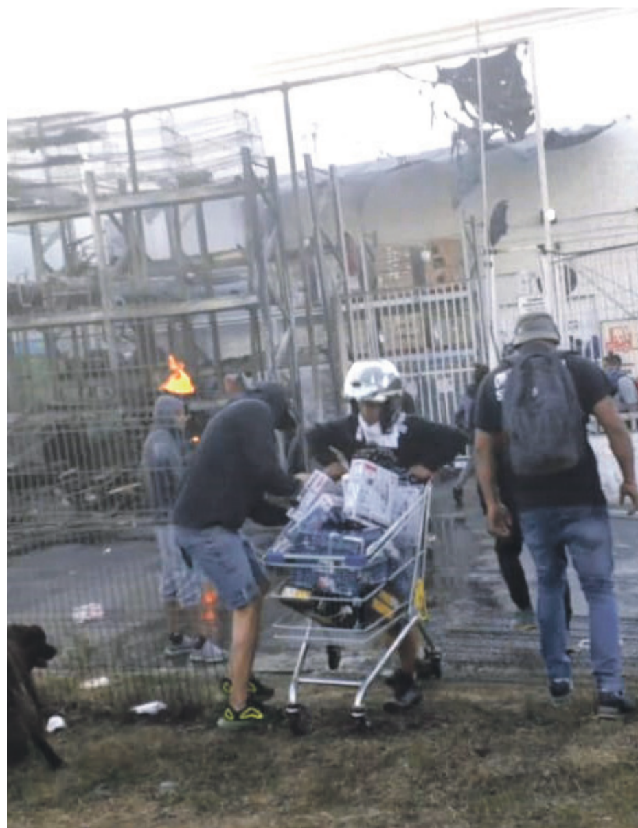
Varias personas ingresaron a robar al local comercial ubicado en el mall Puerta del Mar.