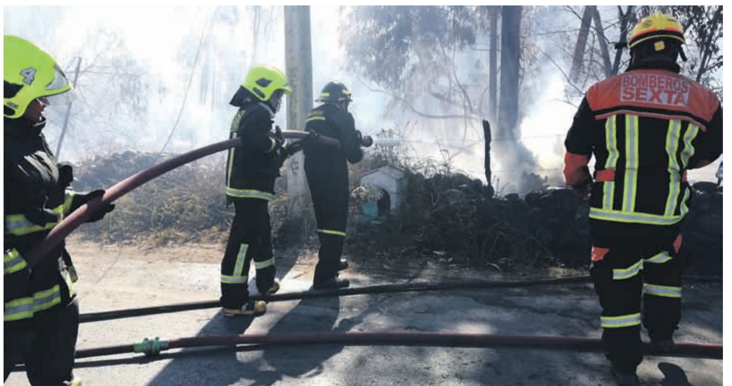
El segundo foco se produjo en la Avenida Laura Pizarro, a metros del Colegio Amalia Errázuriz.

Hasta el momento, se desconocen las causas basales de los siniestros. Carabineros trabajó en el lugar para descartar la participación de terceros a través de un dron, pero no se pudo establecer la intervención de personas en los hechos.