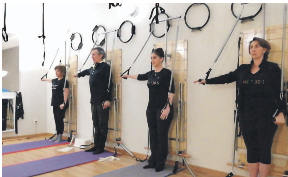
Pilates sirve para poner en forma a practicantes de todas las edades.

¿Estás encorvado cuando trabajas o cuando estás frente al ordenador, y así permaneces 8 horas o más? ¿Tienes dolores y molestias en la zona lumbar o cervical? ¿Eres consciente de los hábitos que mantienes y que te causan esas molestias? Te mostramos las claves del método Pilates.