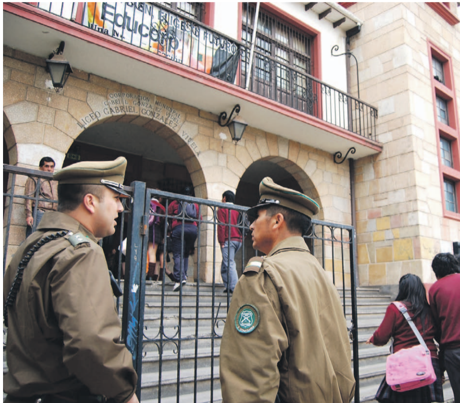
El confuso hecho ocurrió en las cercanías del establecimiento educacional.

Las diligencias realizadas por la PDI no han permitido, hasta ahora, configurar elementos que indiquen la consumación de un delito de sustracción de menor o cualquier otro ilícito. Desde el establecimiento educacional, en tanto, aseguran que reforzarán los protocolos existentes para la salida de sus alumnos.