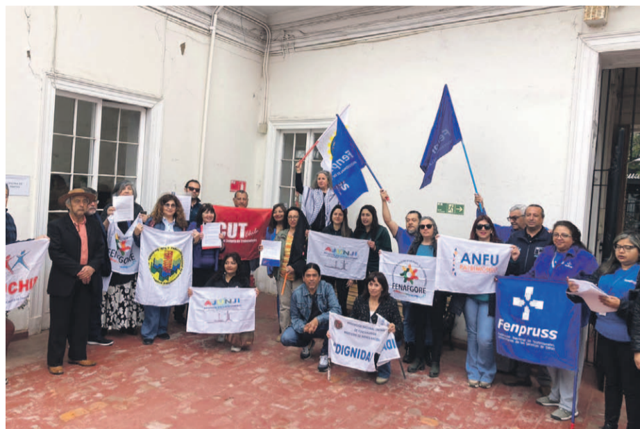
Diferentes dirigentes del sector público acudieron a la sede regional de Contraloría para consultar respecto al dictamen.

Además, este martes, el Colegio de Profesores se sumó a la movilización impulsada por la ANEF y la Central Unitaria de Trabajadores (CUT) en contra del dictamen de Contraloría.