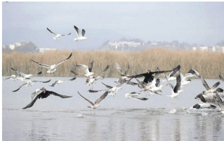
El humedal del río Elqui será uno de los lugares que los expertos visitarán durante el desarrollo del encuentro.

El documento guía o policy brief que se elaborará incluirá orientaciones y recomendaciones para avanzar en la protección de los humedales, por lo que servirá para que Chile, Perú y